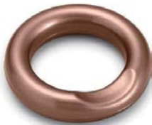
7-1016-8 (85920870) ¥1,000 4.7cmリング型箸置き 銅 A 47×47×11 耐熱温度：60°C