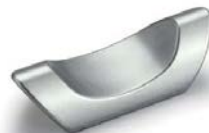
7-1014-9 (85915200) ¥900 5.9cm舟形箸置き 銀 A 59×20×17 耐熱温度：60°C