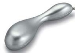
7-1014-7 (85920840) ¥1,000 7.3cmひさご型箸置き 銀 A 73×25×14 耐熱温度：60°C