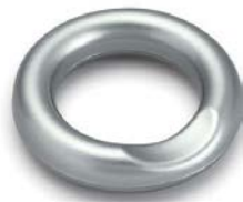
7-1014-8 (85915260) ¥850 4.7cmリング型箸置き 銀 A 47×47×11 耐熱温度：60°C