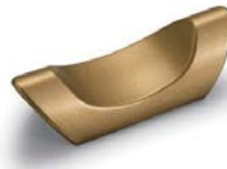
7-1012-9 (85920885) ¥1,000 5.9cm舟形箸置き金 A 59×20×17 耐熱温度：60°C