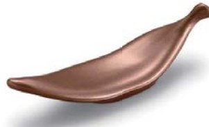
7-1016-6 (85920820) ¥1,000 7.9cm木の葉箸置き 銅 A 79×20×22 耐熱温度：60°C