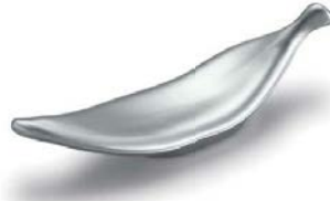
7-1014-6 (85920810) ¥1,000 7.9cm木の葉箸置き 銀 A 79×20×22 耐熱温度：60°C