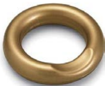
7-1012-8 (85920860) ¥1,000 4.7cmリング型箸置き金 A 47×47×11 耐熱温度：60°C