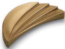
7-1012-5 (85920770) ¥900 5.4cmエンジェル箸置き金 A 54×25×8 耐熱温度：60°C