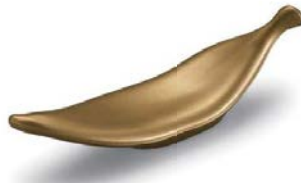
7-1012-6 (85920800) ¥1,000 7.9cm木の葉箸置き金 A 79×20×22 耐熱温度：60°C