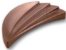
7-1016-5 (85920790) ¥900 5.4cmエンジェル箸置き 銅 A 54×25×8 耐熱温度：60°C