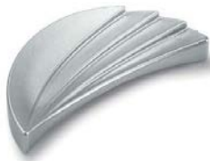
7-1014-5 (85920780) ¥900 5.4cmエンジェル箸置き 銀 A 54×25×8 耐熱温度：60°C