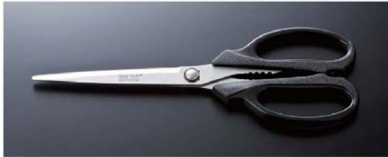
7-963-7 (92987400) ￥2,400 26cm韓国 万能はさみ ST PC 260×92×14