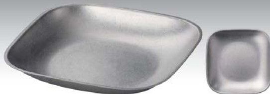
7-957-8 (62163880) ￥5,050 20cm 角ステン盛皿 ST 203×203×29