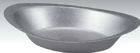
7-957-9 (62164670) ￥5,350 26cmオーバルステンカレー皿 ST 260×180×35