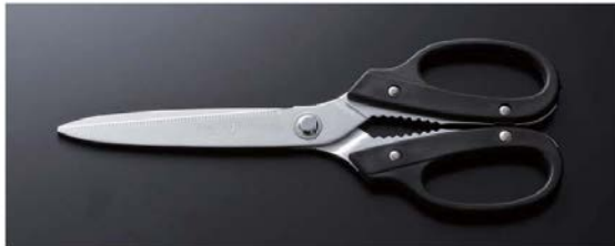
7-963-9 (92987420) ￥4,900 22cm韓国 万能はさみ ST PC 220×85×15