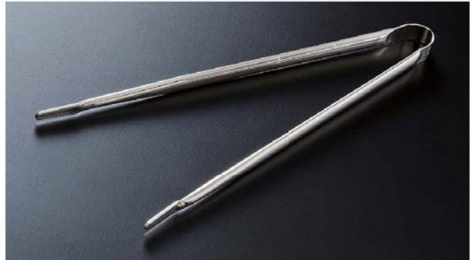
DX中空トング ST 7-963-10 (92987880) 18.5cm ￥2,100 185×77×12 7-963-11 (92987890) 22.5cm ￥2,400 225×80×12 7-963-12 (92987900) 26.5cm ￥2,850 264×96×12 7-963-13 (92987910) 30cm ￥3,100 303×94×12