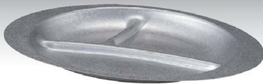
7-957-6 (62164710) ￥4,400 25cmステン小判仕切皿 ST 250×170×15