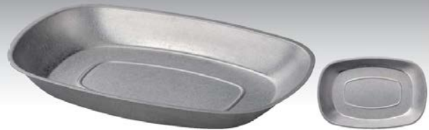
7-957-7 (62163890) ￥4,650 25.5cm オーバルステン ST 256×169×29