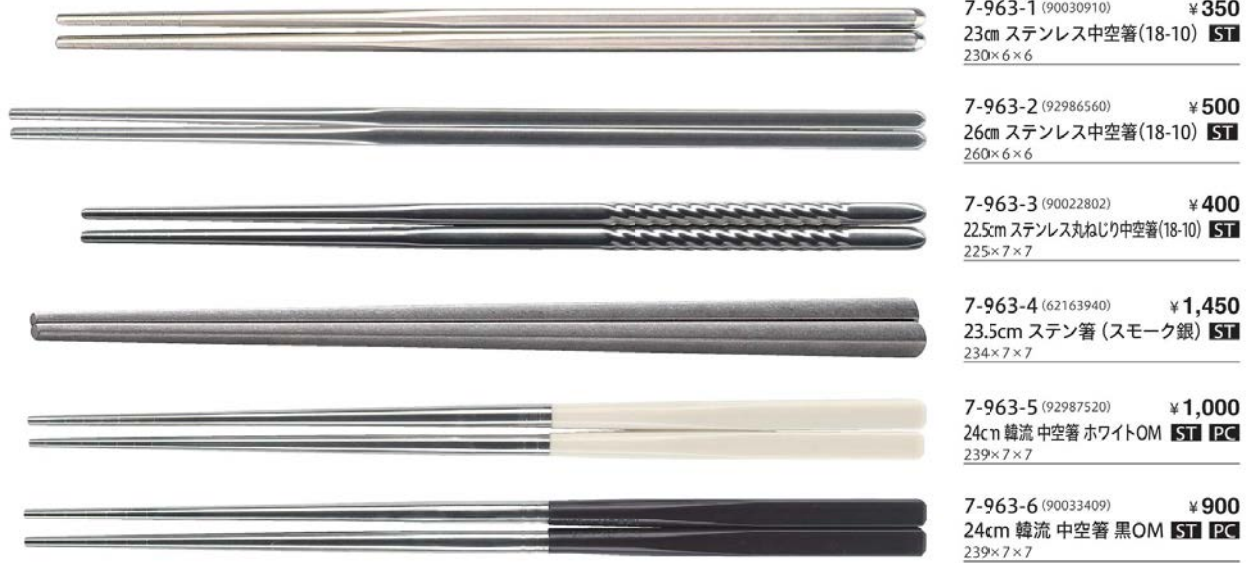
7-963-1 (90030910) ￥350 23cm ステンレス中空箸(18-10) ST 230×6×6