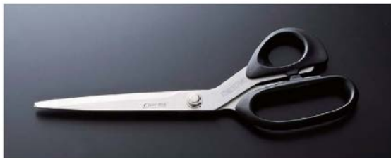
7-963-8 (92987430) ￥2,500 24cm韓国スリム 万能はさみ ST PC 242×84×12