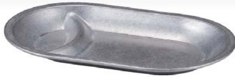
7-957-3 (62164720) ￥3,200 20.8cmステンオーバル仕切皿 ST 208×128×16