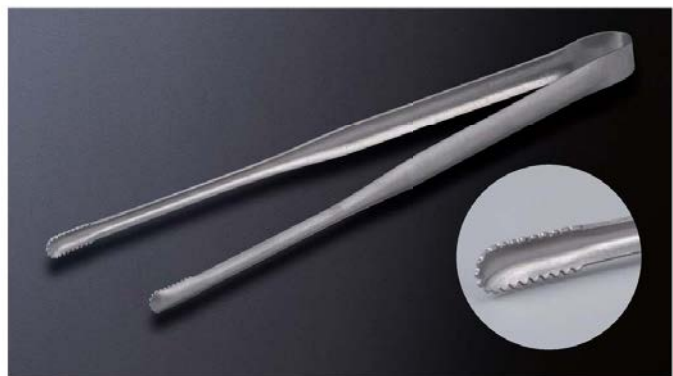
ステントング(滑り止付) ST 7-963-14 (70030630) 23.5cm ￥1,700 235×74×16 7-963-15 (70030620) 29cm ￥1,900 290×83×16