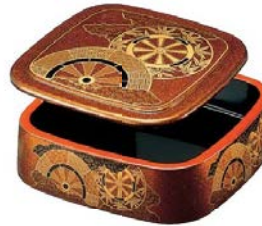
7寸梨地御所車 7-860-12 (65021200) 親 ¥1,880 7-860-13 (67010520) 蓋 ¥2,350