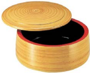
白木 A 7-861-7 (71020372) 親 ¥1,220 7-861-8 (71020371) 蓋 ¥550