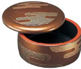
梨地雲波 7-862-3 (72020032) 親 ¥1,600 7-862-4 (72020031) 蓋 ¥1,050