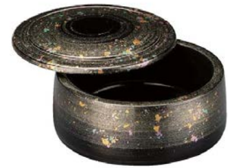
銀光彩 A 7-861-17 (12041100) 親 ¥1,680 7-861-18 (12041090) 蓋 ¥1,030