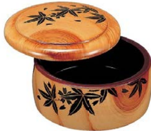
香林モミジ 7-862-9 (72020142) 親 ¥1,900 7-862-10 (72020141) 蓋 ¥1,350