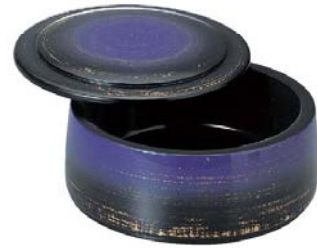
カスミライン A 7-861-15 (70015042) 親 ¥1,450 7-861-16 (70015041) 蓋 ¥570