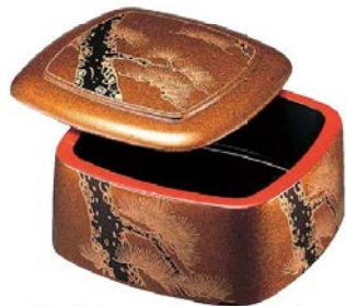
梨地老松 7-862-19 (74010172) 親 ¥1,450 7-862-20 (74010171) 蓋 ¥880