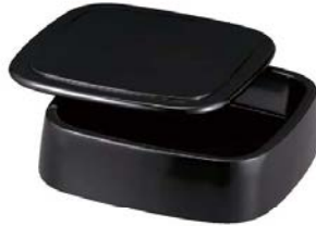
7寸黒 7-860-4 (50262060) 親 ¥1,580 7-860-5 (50262065) 蓋 ¥1,950