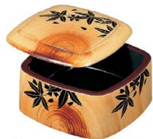
香林モミジ 7-862-23 (74010242) 親 ¥2,150 7-862-24 (74010241) 蓋 ¥1,200