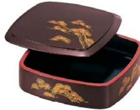
7寸溜パール松 7-860-8 (70013990) 親 ¥1,600 7-860-9 (70014200) 蓋 ¥2,000