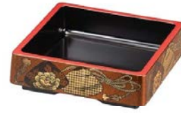
梨地貝合せ 7-860-3 (67020520) 親 ¥2,250