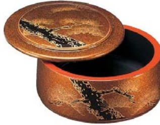
梨地老松 A 7-861-9 (71020192) 親 ¥1,300 7-861-10 (71020191) 蓋 ¥550