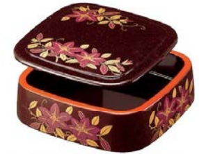
7寸茶パール鉄仙 7-860-20 (65021400) 親 ¥1,900 7-860-21 (67010530) 蓋 ¥2,350