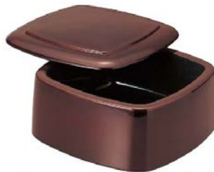
溜 7-862-21 (70014950) 親 ¥1,630 7-862-22 (70014940) 蓋 ¥830