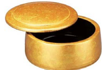
二色金箔 A 7-861-23 (12041190) 親 ¥3,700 7-861-24 (12041180) 蓋 ¥2,050