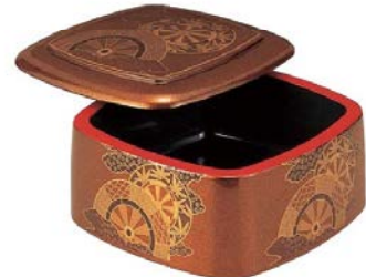
梨地御所車 7-862-17 (74010132) 親 ¥1,560 7-862-18 (74010131) 蓋 ¥830