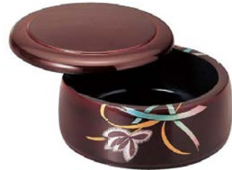
溜蘭内溜 7-862-11 (70014792) 親 ¥2,550 7-862-12 (70014791) 蓋 ¥1,280