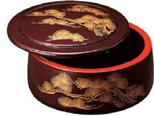
溜パール松 A 7-861-5 (71020022) 親 ¥1,250 7-861-6 (71020021) 蓋 ¥530