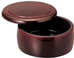
溜 7-862-7 (70014822) 親 ¥1,600 7-862-8 (70014821) 蓋 ¥1,050