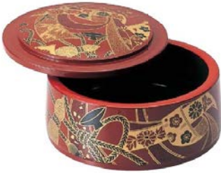
朱むすび A 7-861-13 (70014982) 親 ¥1,300 7-861-14 (70014981) 蓋 ¥550