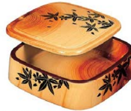
7寸香林モミジ 7-860-24 (65032350) 親 ¥2,700 7-860-25 (67010580) 蓋 ¥2,600