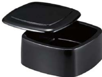
黒 7-862-13 (50262100) 親 ¥1,300 7-862-14 (50262105) 蓋 ¥730