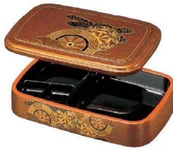
梨地御所車 7-860-30 (67020810) 親 ¥4,000 7-860-31 (67020910) 蓋 ¥1,900