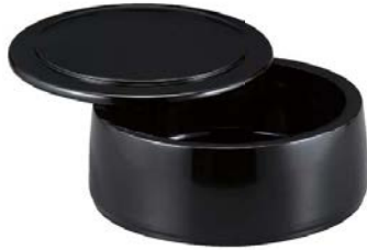
黒 A 7-861-1 (50262070) 親 ¥1,100 7-861-2 (50262075) 蓋 ¥480