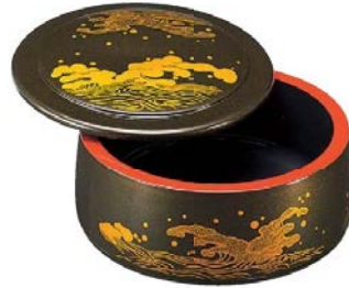
グリーンパール大波 A 7-861-3 (71020012) 親 ¥1,180 7-861-4 (71020011) 蓋 ¥500