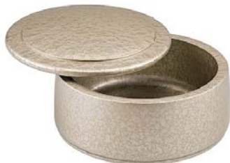
シャンパンゴールドアクア A 7-861-19 (46201050) 親 ¥2,300 7-861-20 (46201060) 蓋 ¥1,330