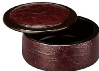
油彩漆刻 A 7-861-21 (12041160) 親 ¥3,100 7-861-22 (12041150) 蓋 ¥1,640