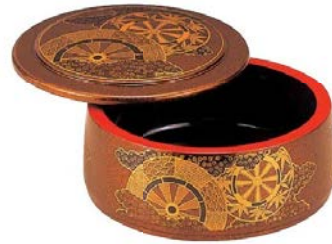
梨地御所車 A 7-861-11 (71020132) 親 ¥1,300 7-861-12 (71020131) 蓋 ¥550