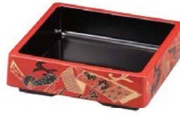
朱ムスビ 7-860-2 (67020330) 親 ¥2,250