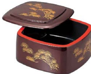
溜パール松 7-862-15 (70014922) 親 ¥1,480 7-862-16 (70014921) 蓋 ¥770