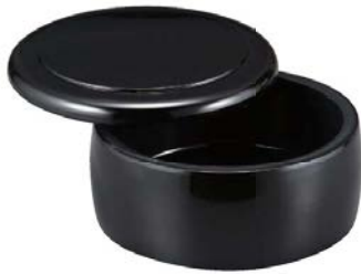
黒 7-862-1 (50262090) 親 ¥1,250 7-862-2 (50262095) 蓋 ¥900