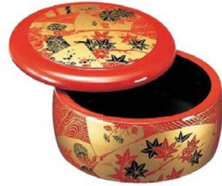
朱扇面 7-862-5 (7202C042) 親 ¥1,600 7-862-6 (7202C041) 蓋 ¥1,050