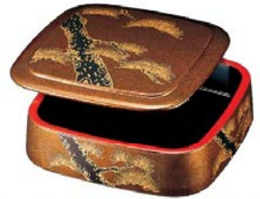
7寸梨地老松 7-860-16 (65021000) 親 ¥1,880 7-860-17 (65022020) 蓋 ¥2,350