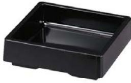
黒 7-860-1 (50262050) 親 ¥1,750