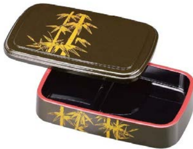
グリーンパール竹 7-860-28 (72020170) 親 ¥3,800 7-860-29 (72020180) 蓋 ¥1,850