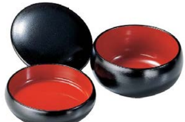
6寸タイコ鉢 黒刷毛目内朱天黒 A 7-663-13 (38191230) 本体 ¥3,000 φ180×90 7-663-14 (38191231) 中子 ¥1,650 φ180×41 7-663-15 (38191232) 蓋 ¥1,450 φ180×25