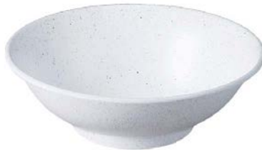
7-671-10 (30048920) ¥3,000 総白粉引 TA φ210×86