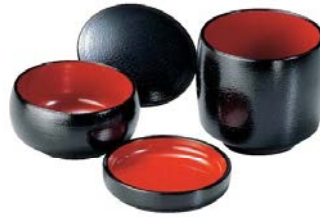
3.3寸タイコ鉢 黒刷毛目内朱天黒 A 7-663-3 (38191251) 本体 ¥1,500 φ100×90 7-663-4 (38191252) 汁鉢 ¥1,200 φ97×50 7-663-5 (38191253) 薬味皿 ¥800 φ95×19 7-663-6 (38191254) 蓋 ¥850 φ98×14