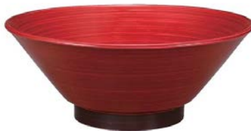
7-673-8 (30045690) ¥4,000 総小豆刷毛目塗り PBT-A φ220×87