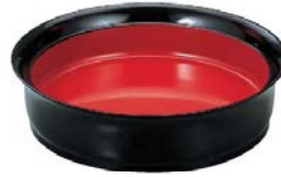
7-675-3 (51272010) ¥2,200 7寸深 黒内朱 φ210×60