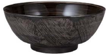
7-673-3 (30045740) ¥4,200 総黒刷毛目塗り PBT-A φ210×86