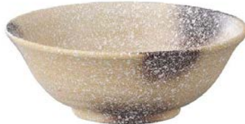
7-672-17 (45023810) ¥3,550 志野 PBT-A φ195×71