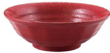
紅赤クリヤータタキ PBT-A 7-672-5 (40421860) 18cm ¥2,950 φ180×71 7-672-6 (40421870) 24cm ¥4,000 φ240×82