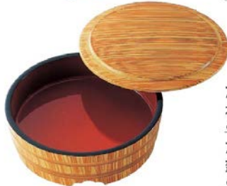
7-675-19 (38020600) ¥2,100 本体 白木内朱金ヒモ