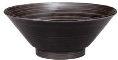
7-673-9 (30045680) ¥4,000 総黒刷毛目塗り PBT-A φ220×87