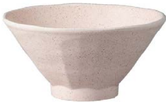
7-673-4 (30048930) ¥3,600 総クリーム粉引 PBT-A φ212×107