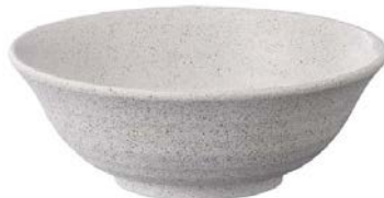
7-672-14 (45023790) ¥2,800 粉引き PBT-A φ195×71