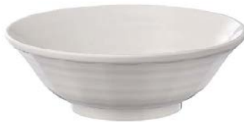
白 PBT-A 7-672-9 (45023640) 18cm ¥3,800 φ180×71 7-672-10 (45023700) 24cm ¥4,650 φ240×82