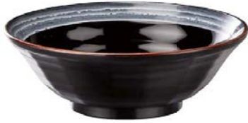
ゆず天目 PBT-A 7-672-1 (45023680) 18cm ¥2,800 φ180×71 7-672-2 (45023740) 24cm ¥3,800 φ240×82