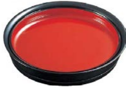
7-675-1 (45012750) ¥2,000 7寸浅 黒内朱 φ210×38