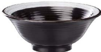
7-672-13 (45023770) ¥2,750 ゆず天目 PBT-A φ195×71