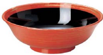
7-671-4 (38020750) ¥1,900 朱かすみ TA φ188×75