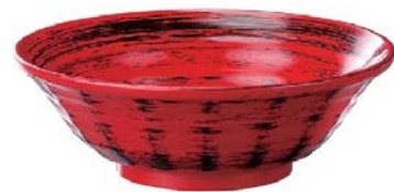
赤に黒刷毛目 PBT-A 7-672-11 (45023670) 18cm ¥4,350 φ180×71 7-672-12 (45023730) 24cm ¥5,400 φ240×82