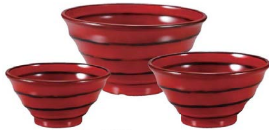
朱研ぎ出し (内外) TA 7-670-4 (31082075) φ130 ¥1,450 φ130×64 7-670-5 (31008150) φ150 ¥1,950 φ150×80 7-670-6 (31082083) φ170 ¥2,250 φ170×90