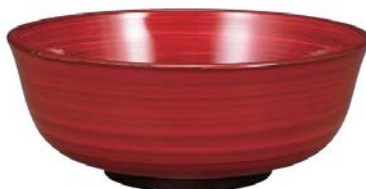
7-673-11 (30045780) ¥4,300 総小豆刷毛目塗り PBT-A φ215×85