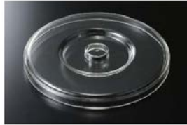
7-675-6 (85020490) ¥1,900 7寸羽反鉢用(蓋) クリア(塗加工) AC