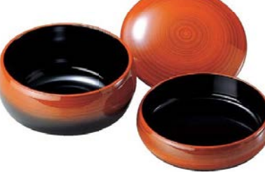
6寸タイコ鉢 ルミナスオレンジ A 7-663-28 (38191341) 本体 ¥3,700 φ180×90 7-663-29 (38191342) 中子 ¥2,050 φ172×41 7-663-30 (38191343) 蓋 ¥2,000 φ100×25