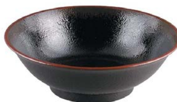
7-671-11 (33101970) ¥3,000 黒天目 TA φ210×86