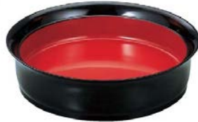
7-675-7 (51272100) ¥2,200 8寸深 黒内朱 φ235×60