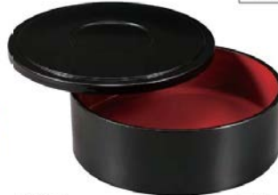
黒内朱 7-675-13 (40431300) 深鉢 ¥2,600 φ200×70