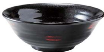
7-672-16 (40421890) ¥3,150 曙内黒タタキ PBT-A φ195×71