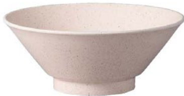
7-673-7 (30048950) ¥3,300 総クリーム粉引 PBT-A φ220×87