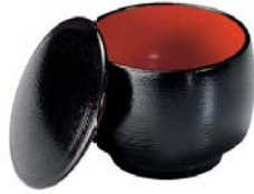
タイコ吸物椀 黒刷毛目内朱天黒 A 7-663-1 (38191241) 本体 ¥1,500 φ93×71 7-663-2 (38191242) 蓋 ¥850 φ93×16