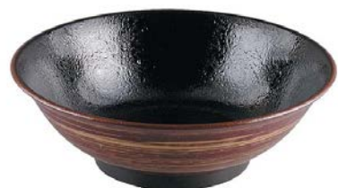
7-671-12 (33101950) ¥3,300 うるみ金霞内黒タタキ TA φ210×86