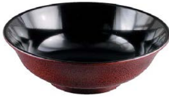
7-671-1 (33101560) ¥1,450 溜ハジキ刷毛目内黒 A φ188×75