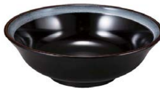
7-671-5 (30045620) ¥2,000 ゆず天目 TA φ188×75