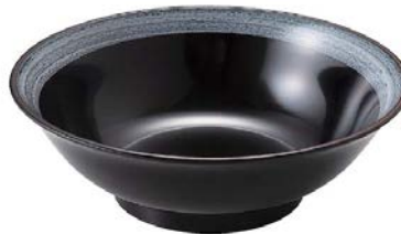
7-671-8 (40421850) ¥2,600 ゆず天目 TA φ210×86