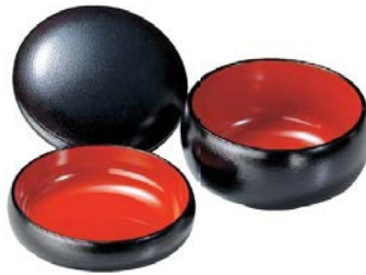
5寸タイコ鉢 黒刷毛目内朱天黒 A 7-663-10 (38191220) 本体 ¥2,300 φ150×75 7-663-11 (38191221) 中子 ¥1,300 φ145×40 7-663-12 (38191222) 蓋 ¥1,300 φ145×23