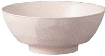
7-673-1 (30048970) ¥3,500 総クリーム粉引 PBT-A φ210×86