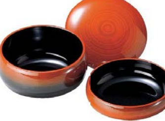
5寸タイコ鉢 ルミナスオレンジ A 7-663-25 (38191351) 本体 ¥2,900 φ150×75 7-663-26 (38191352) 中子 ¥1,600 φ145×40 7-663-27 (38191353) 蓋 ¥1,750 φ145×23