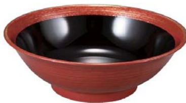
7-671-7 (30045630) ¥2,450 朱かすみ TA φ210×86