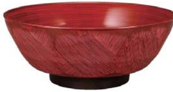
7-673-2 (30045730) ¥4,200 総小豆刷毛目塗り PBT-A φ210×86