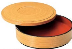
白木内朱 7-675-11 (45150990) 浅鉢 ¥1,900 φ200×48