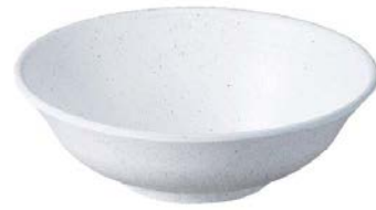
7-671-3 (30048910) ¥2,100 総白粉引 A φ188×75