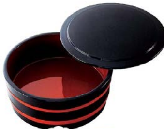
7-675-21 (38020620) ¥2,350 本体 黒朱ヒモ