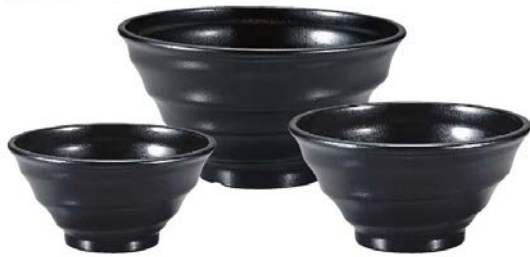
黒石目 TA 7-670-1 (3108207C) φ130 ¥900 φ130×64 7-670-2 (3100811C) φ150 ¥1,300 φ150×80 7-670-3 (3108207E) φ170 ¥1,450 φ170×90