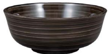
7-673-12 (30045770) ¥4,300 総黒刷毛目塗り PBT-A φ215×85