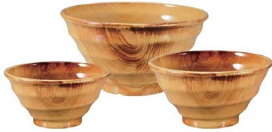
香林 TA 7-670-13 (31082075) φ130 ¥1,700 φ130×64 7-670-14 (31008173) φ150 ¥2,300 φ150×80 7-670-15 (31082084) φ170 ¥2,500 φ170×90