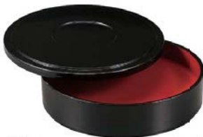
黒内朱 7-675-9 (40431280) 浅鉢 ¥2,200 φ200×48