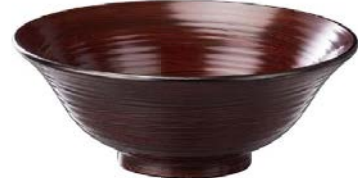
7-672-18 (45023800) ¥3,750 栃刷毛目 PBT-A φ195×71