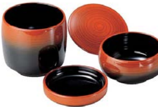
3.3寸タイコ鉢 ルミナスオレンジ A 7-663-18 (38191321) 本体 ¥2,200 φ100×90 7-663-19 (38191322) 汁鉢 ¥1,800 φ97×50 7-663-20 (38191323) 薬味皿 ¥1,100 φ95×19 7-663-21 (38191324) 蓋 ¥1,200 φ98×14