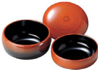
4寸タイコ鉢 ルミナスオレンジ A 7-663-22 (38191361) 本体 ¥2,200 φ120×60 7-663-23 (38191362) 中子 ¥1,650 φ115×40 7-663-24 (38191363) 蓋 ¥1,400 φ118×21