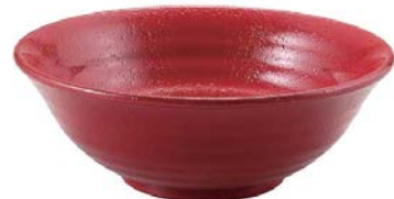
7-672-15 (40421880) ¥2,900 紅赤クリヤータタキ PBT-A φ195×71