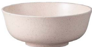
7-673-10 (30048990) ¥3,700 総クリーム粉引 PBT-A φ215×85