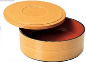
白木内朱 7-675-15 (45151000) 深鉢 ¥2,100 φ200×70