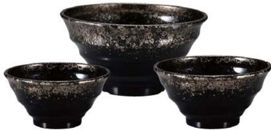
銀泡 TA 7-670-7 (31082073) φ130 ¥1,450 φ130×64 7-670-8 (3100814C) φ150 ¥1,950 φ150×80 7-670-9 (31082081) φ170 ¥2,250 φ170×90