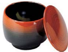
タイコ吸物椀 ルミナスオレンジ A 7-663-16 (38191331) 本体 ¥2,000 φ93×71 7-663-17 (38191332) 蓋 ¥1,200 φ93×16