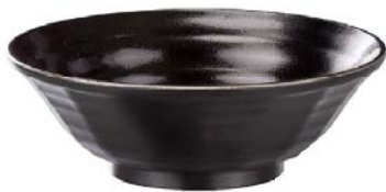
総黒タタキ PBT-A 7-672-7 (45023660) 18cm ¥3,250 φ180×71 7-672-8 (45023720) 24cm ¥4,200 φ240×82