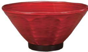
7-673-5 (30045650) ¥4,300 総小豆刷毛目塗り PBT-A φ212×107