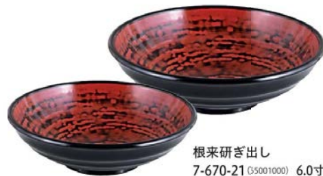
根来研ぎ出し A 7-670-21 (55001000) 6.0寸 ¥1,650 φ180×53 7-670-22 (55001010) 7.0寸 ¥2,000 φ210×60