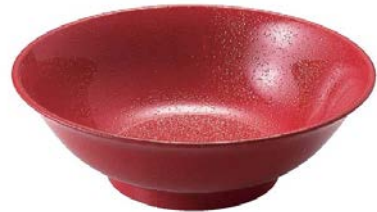
7-671-9 (+0421840) ¥2,800 総紅赤クリヤータタキ TA φ210×86