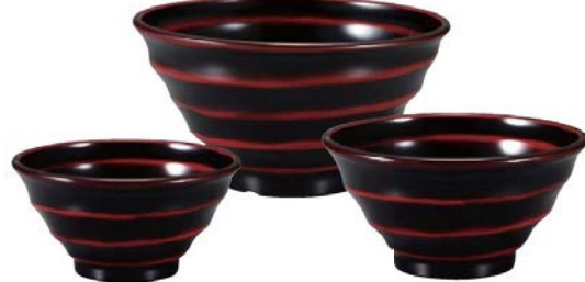
曙研ぎ出し (内外) TA 7-670-10 (31082074) φ130 ¥1,650 φ130×64 7-670-11 (31008160) φ150 ¥2,150 φ150×80 7-670-12 (31082082) φ170 ¥2,400 φ170×90