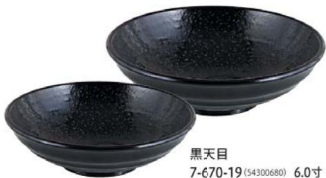
黒天目 A 7-670-19 (54300680) 6.0寸 ¥1,350 φ180×53 7-670-20 (54300690) 7.0寸 ¥1,550 φ210×60