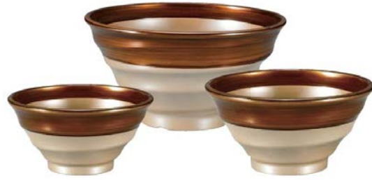
銀透きべっ甲 TA 7-670-16 (31082077) φ130 ¥1,800 φ130×64 7-670-17 (31008180) φ150 ¥2,300 φ150×80 7-670-18 (31082085) φ170 ¥2,600 φ170×90