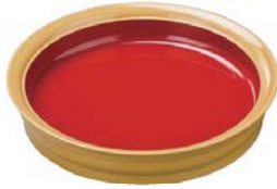
7-675-2 (51271990) ¥1,900 7寸浅 白木内朱 φ210×38