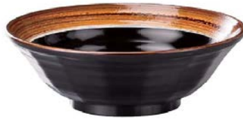
ゆず栃天目 PBT-A 7-672-3 (45023690) 18cm ¥2,800 φ180×71 7-672-4 (45023750) 24cm ¥3,800 φ240×82