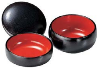
4寸タイコ鉢 黒刷毛目内朱天黒 A 7-663-7 (38191210) 本体 ¥1,500 φ120×60 7-663-8 (38191211) 中子 ¥1,300 φ115×40 7-663-9 (38191212) 蓋 ¥980 φ118×21