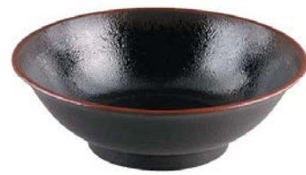
7-671-6 (+0421830) ¥2,400 黒天目 TA φ188×75