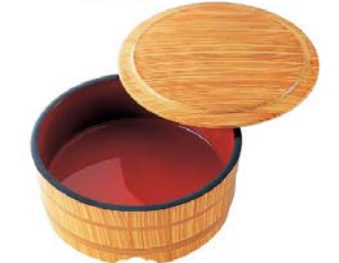
7-675-23 (38020640) ¥2,650 本体 白木内朱金ヒモ