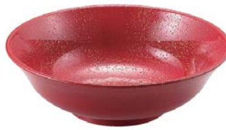
7-671-2 (40421820) ¥1,600 総紅赤クリヤータタキ A φ188×75