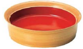
7-675-4 (51272020) ¥2,300 7寸深 白木内朱 φ210×60