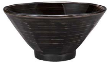
7-673-6 (30045640) ¥4,300 総黒刷毛目塗り PBT-A φ212×107