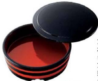
7-675-17 (38020580) ¥1,900 本体 黒朱ヒモ