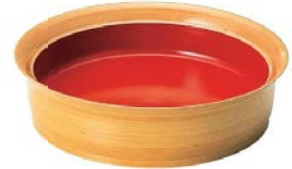
7-675-8 (45150970) ¥2,300 8寸深 白木内朱 φ235×60