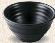
7-348-11 (51024390) ¥1,050 φ9.6cmコマ型内外ウズ深丸小鉢 黒マット φ96×51