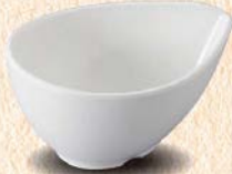
7-346-5 (75006580) ¥700 10cmドロップ深小鉢 白グロス 100×75×48