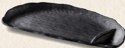
7-352-5 (51024850) ¥2,650 27.5cmひねり柿種タレ付皿 黒マット 275×116×23