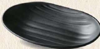
7-350-11 (51024680) ¥1,650 20.9cmひねり小判内波筋皿 防汚 黒マット 209×131×33