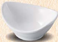
7-345-11 (51024160) ¥720 9.5cm 雅ひとひら小鉢 白グロス 95×74×39