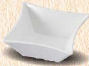
7-345-1 (75006430) ¥550 7.8cm スター角小鉢 白グロス 78×78×33