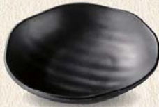
7-349-11 (51024510) ¥1,300 13.6cm三ツ足ひねり内筋丸鉢 黒マット 136×134×37