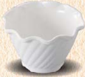
7-346-1 (75006590) ¥720 フラワースパイラル小鉢 白グロス 93×87×58