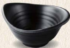
7-348-17 (51024380) ¥1,350 11.6cm卵中内ウズ深小鉢 黒マット 116×95×56