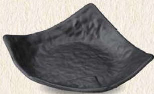
7-351-10 (75005685) ¥2,900 23cmムスビ内ゆず柄皿 黒マット 230×187×49