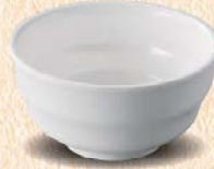
7-346-3 (51024420) ¥680 φ9.7cm段付深丸小鉢 白グロス φ97×51