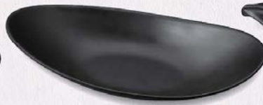
7-354-7 (75005720) ¥2,750 31.6cmひねり反舟皿 黒マット 316×167×63