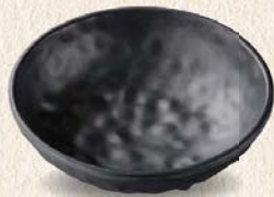
7-350-7 (51024770) ¥3,050 16.5cmひねり内ゆず目丸浅皿 防汚 黒マット 165×163×53