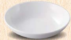
7-345-14 (51024260) ¥350 φ9.8cm 雅丸浅小皿 白グロス φ98×24