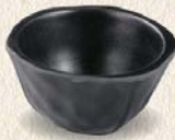
7-348-6 (51024220) ¥900 9.2cmひねり曲り深小鉢 黒マット 92×91×49