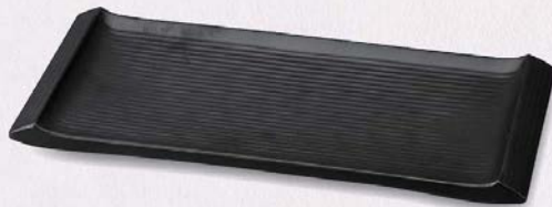
両淵高筋目長角皿 黒マット 7-354-9 (75005810) 35.5cm ¥5,950 355×156×30 7-354-10 (75005820) 40cm ¥6,950 400×157×33 7-354-11 (75005830) 45.5cm ¥7,950 455×158×33