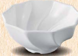
7-346-15 (51024630) ¥860 11.8cmねじり十角鉢 白グロス 118×112×52