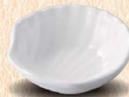
7-345-9 (51024130) ¥600 8.8cm 姫シェル小鉢 白グロス 88×88×32