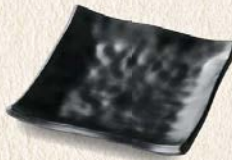
7-349-14 (51024710) ¥1,700 12.7cmひねり四方上皿 黒マット 127×127×31