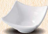
7-345-6 (51024210) ¥650 8.4cm 雅四方上角小鉢 白グロス 84×84×44