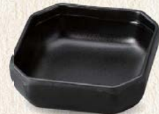
7-348-16 (75005530) ¥1,450 11.3cm角スミ切鉢 黒マット 113×113×38