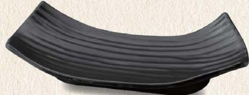
7-352-7 (75005780) ¥3,150 29.4cmひねり両上り帯筋目鉢 黒マット 294×123×58