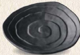
7-351-5 (51024810) ¥2,350 19.5cmひねり内ウズ巻皿 黒マット 195×190×30