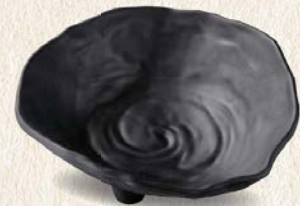
7-351-6 (51024820) ¥3,600 19.8cm三ツ足ひねり羽反内ウズ巻鉢 黒マット 198×190×64