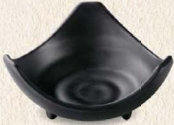
7-349-4 (51024640) ¥1,550 13.2cmひねり三ツ山内ウズ鉢 黒マット 132×132×66