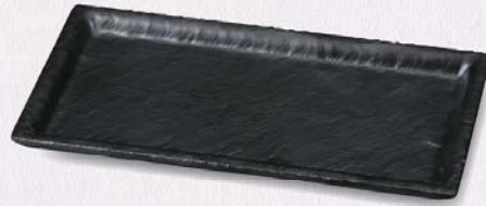
7-354-5 (80521950) ¥3,650 27.8cm石削り長角皿 黒マット 278×144×18