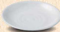
7-345-21 (50255010) ¥530 φ11cm 醤油皿(大) 白グロス φ109×18