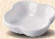
7-345-4 (51024090) ¥580 8cm クローバー姫小皿 白グロス 80×80×25