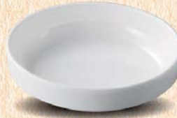
7-346-11 (51024290) ¥530 φ11.3cm雅切立小皿 白グロス φ113×27