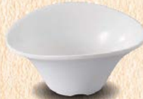
7-346-7 (75006570) ¥620 たわみ楕円小鉢 白グロス 101×78×46