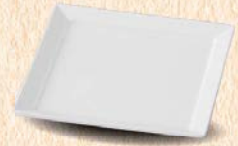
7-346-4 (75006460) ¥570 9.8cmスクエアリム小皿 白グロス 98×98×11