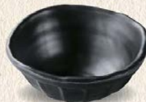
7-348-15 (51024580) ¥1,000 φ10.9cmひねり隅丸外縦筋鉢 黒マット φ109×50