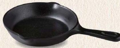
7-350-14 (83360120) ¥2,000 フライパン 防汚 黒マット 170×252×34