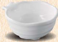
7-346-2 (51024230) ¥660 9.6cm雅ひねり片口小鉢 白グロス 96×84×43