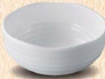
7-346-10 (51024570) ¥900 φ10.7cm波淵外筋丸鉢 白グロス φ107×46