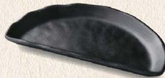
7-351-11 (51024650) ¥2,600 24cmひねり半月測反皿 黒マット 240×127×26