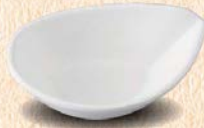
7-345-16 (75006420) ¥450 9.9cm バロック小皿 白グロス 99×77×25