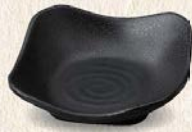
7-350-1 (75005550) ¥500 9.1cm角隅切羽反皿 防汚 黒マット 91×91×27