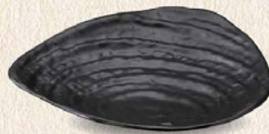
7-351-8 (75005680) ¥1,850 20.2cmひねり三方内ウズ皿 黒マット 202×160×28