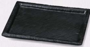
7-354-4 (80521740) ¥3,650 24.5cm石削り幅広長角皿 黒マット 245×174×18