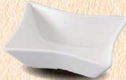
7-345-12 (75006440) ¥700 9.7cm ツノ長角小鉢 白グロス 97×77×34