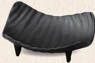
7-351-4 (75005690) ¥3,050 18.5cm四方上り内筋四ツ足鉢 黒マット 185×150×65