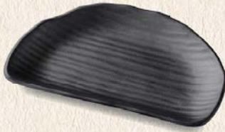
7-351-1 (51024530) ¥1,150 16.4cmひねり半月内筋皿 黒マット 164×104×21