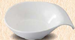
7-346-16 (75006390) ¥750 ハンドリム 白グロス 119×87×34