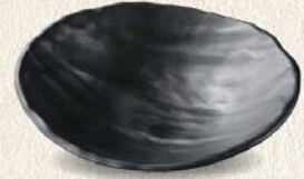
7-349-3 (51024490) ¥1,100 13.2cmひねり楕円羽反鉢 黒マット 132×119×32