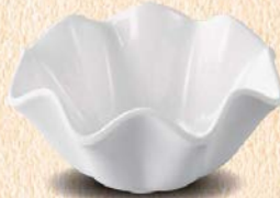
7-346-14 (51024430) ¥700 φ11.6cm花型深小鉢 白グロス 116×102×55