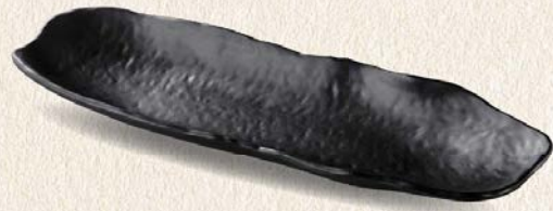
7-352-3 (51024890) ¥3,100 26.3cmひねり変り舟型長皿 黒マット 263×87×28