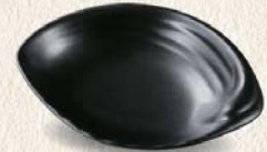
7-349-9 (51024460) ¥1,100 13.8cm測反ハマグリ小鉢 黒マット 138×106×29