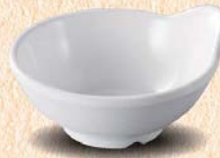
7-345-13 (51024180) ¥550 9.7cm トン水型小鉢 白グロス 97×89×46