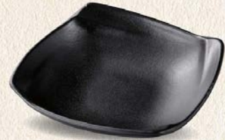
7-350-6 (51024750) ¥3,200 18.5cmひねり四方折り目鉢 防汚 黒マット 185×185×50