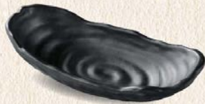
7-351-7 (51024830) ¥1,900 19.6cm三ツ足ひねり舟型内段付鉢 黒マット 196×90×52