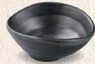
7-348-8 (51024190) ¥1,000 9.8cmひねり楕円小鉢 黒マット 98×79×43