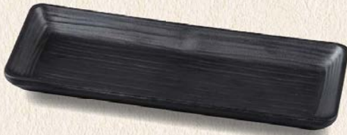
7-352-1 (80521925) ¥1,400 18cm木肌長角 串皿 黒マット 180×97×23