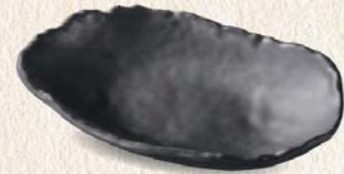
7-351-9 (51024790) ¥3,050 22cmひねり小判測上皿 黒マット 220×145×47