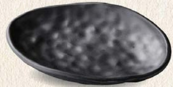
7-350-9 (51024660) ¥2,500 19.3cmひねり楕円曲皿 防汚 黒マット 193×139×37