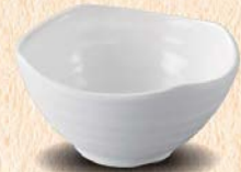
7-346-8 (51024440) ¥700 φ10.5cm四ツ山深丸小鉢 白グロス φ105×55