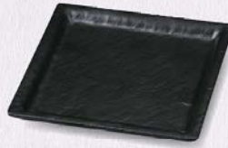
7-354-2 (80521920) ¥2,500 16.9cm石削り角皿 黒マット 169×169×18