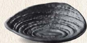
7-348-20 (51024320) ¥1,000 12.5cmひねり三方内ウズ小皿 黒マット 125×98×20