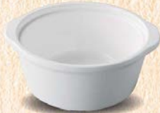
7-346-9 (51024410) ¥900 10.9cm耳付深丸小鉢 白グロス 109×99×48