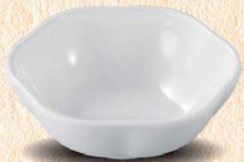
7-346-17 (51024610) ¥1,080 12cm隅丸亀甲鉢 白グロス 120×112×45