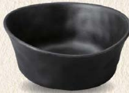
7-349-8 (75005670) ¥1,750 14.3cmひねり切立測反鉢 黒マット 143×130×61