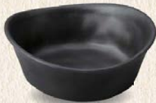
7-349-7 (75005660) ¥1,200 13.3cmひねり切立測反鉢 黒マット 133×122×50