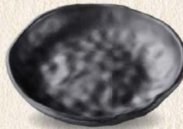
7-350-8 (51024760) ¥2,250 17cmひねり内ゆず目丸浅皿 防汚 黒マット 170×164×30