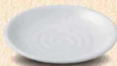
7-345-20 (50255000) ¥450 φ10cm 醤油皿(中) 白グロス φ100×17