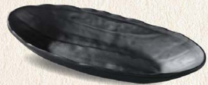
7-351-12 (51024840) ¥3,600 28.4cmひねり舟型羽反鉢 黒マット 284×119×51