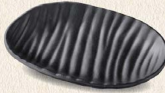
7-351-2 (51024540) ¥1,600 16.9cmひねり半月内筋皿 黒マット 169×111×24