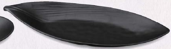
7-354-8 (75005790) ¥3,400 36.7cmリーフゆず柄長目皿 黒マット 367×156×45