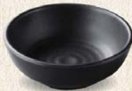
7-348-10 (51024350) ¥1,000 φ9.9cmひねりウズ丸小鉢 黒マット φ99×36