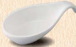
7-345-17 (75006360) ¥900 10cm 平レンゲ小鉢 白グロス 100×46×20