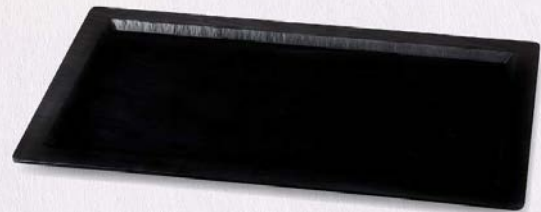
7-354-12 (80521985) ¥23,500 52.5cm石削り長角皿 黒マット 525×320×16