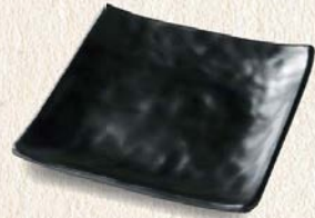
7-349-15 (51024720) ¥2,050 15.1cmひねり四方上皿 黒マット 151×151×25