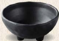
7-348-13 (51024370) ¥1,500 φ10.3cmひねり三ツ足深小鉢 黒マット φ103×51