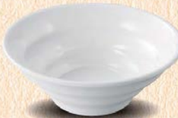
7-346-18 (51024590) ¥700 φ12.1cm外段付内筋丸鉢 白グロス φ121×45