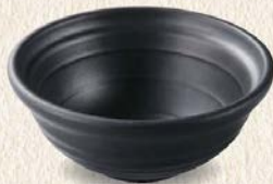
7-348-18 (51024620) ¥1,700 φ12.2cm測付内筋丸深鉢 黒マット φ122×53