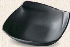
7-350-4 (51024730) ¥1,350 13.5cmひねり四方折り目鉢 防汚 黒マット 135×135×40