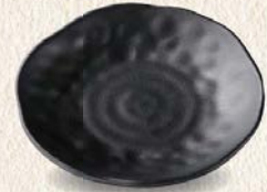
7-349-12 (51024520) ¥1,650 φ14.2cmひねり波測丸皿 黒マット φ142×27