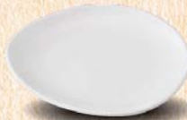
7-346-6 (75006450) ¥460 10.1cm変り雲小鉢 白グロス 101×98×10