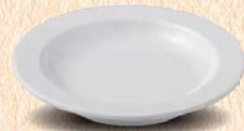
7-345-22 (50255020) ¥440 φ10cm DX 醤油皿 白グロス φ100×15