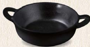
7-350-13 (83360110) ¥2,300 持ち手付き鍋 防汚 黒マット 147×197×57