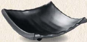
7-349-10 (51024330) ¥950 13.9cmひねり菱型小鉢 黒マット 139×107×38