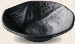
7-349-1 (51024470) ¥1,050 12.6cmひねり羽反内斜筋鉢 黒マット 126×123×32