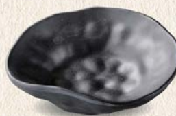
7-348-19 (51024480) ¥1,300 12.5cmひねり一方押し羽反鉢 黒マット 125×113×41