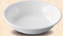
7-346-12 (51024270) ¥500 φ11.4cm雅丸小皿 白グロス φ114×24