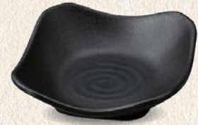
7-350-3 (75005570) ¥1,250 13.4cm角隅切羽反皿 防汚 黒マット 134×134×40