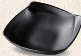
7-350-5 (51024740) ¥2,000 15.4cmひねり四方折り目鉢 防汚 黒マット 154×154×45