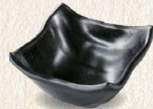
7-348-12 (51024550) ¥1,450 10cmひねり四方上角小鉢 黒マット 100×100×55