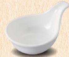
7-345-18 (75006380) ¥640 10cm ラウンドレンゲ小鉢 白グロス 100×70×46