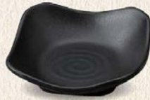
7-350-2 (75005560) ¥880 11.5cm角隅切羽反皿 防汚 黒マット 115×115×34