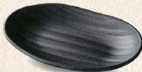
7-350-10 (51024670) ¥1,700 18.2cmひねり小判内波筋皿 防汚 黒マット 182×115×30