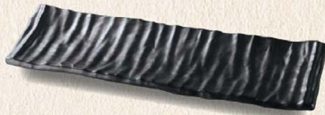
7-352-8 (51024920) ¥2,350 23.8cmひねりナタ目長角皿 黒マット 238×78×22