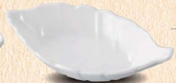
7-346-20 (51024450) ¥700 16.3cm測反この葉小鉢 白グロス 163×90×36