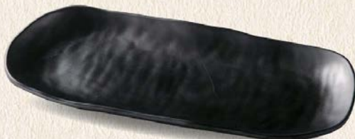
7-352-10 (51024880) ¥3,200 32.5cmひねり隅丸長角内筋皿 黒マット 325×146×33