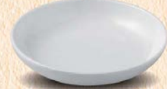
7-345-23 (50255030) ¥440 φ9.7cm 腰丸醤油皿 白グロス φ97×20

※カレー・ケチャップなどの料理を盛り付けると、シミの原因になりますのでご注意ください。