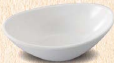
7-345-15 (75006410) ¥650 9.9cm オーバル羽反小鉢 白グロス 99×63×31