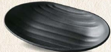
7-350-12 (51024690) ¥1,850 23cmひねり小判内波筋皿 防汚 黒マット 230×144×36