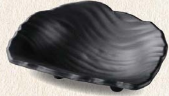
7-351-3 (51024780) ¥2,250 17.7cm三ツ足ひねり一方切鉢 黒マット 177×137×52