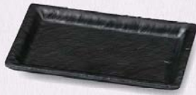
7-354-1 (80521910) ¥1,600 16.8cm石削り長角皿 黒マット 168×98×18