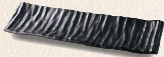
7-352-9 (51024930) ¥4,050 32.5cmひねりナタ目長角皿 黒マット 325×105×24