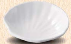
7-345-10 (51024140) ¥550 φ10.2cm 雅シェル小鉢 白グロス 102×95×23