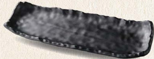
7-352-11 (51024870) ¥3,950 32.5cmひねり長角内ゆず目皿 黒マット 325×124×34