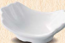
7-346-19 (51024360) ¥850 12.5cm両葉羽反小鉢 白グロス 125×75×45