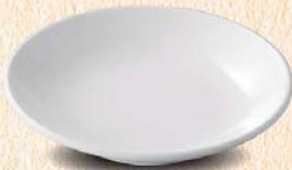
7-346-13 (51024280) ¥530 φ11.6cm雅丸浅小皿 白グロス φ116×22