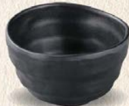
7-348-14 (51024560) ¥1,400 φ10.6cmひねり外段付丸深鉢 黒マット φ106×64