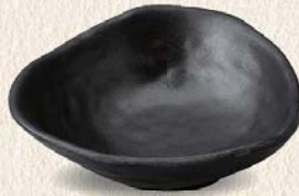
7-349-2 (75005540) ¥1,300 三角反ゆず目鉢 黒マット 131×125×44