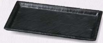
7-354-3 (80521930) ¥2,500 24.5cm石削り細長角皿 黒マット 245×100×18