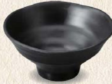
7-349-5 (75005650) ¥1,400 φ13.2cm細高台羽反丸鉢 黒マット 132×130×64