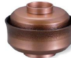
7-252-6 (33502850) ¥6,100 絞り墨入れ銅内黒 TA