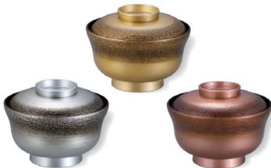
絞り墨入れ内黒 TA 7-252-10 (33508130) 金 ¥6,500 7-252-11 (33508140) 銀 ¥6,450 7-252-12 (33508150) 銅 ¥6,400