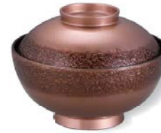
7-252-3 (33502880) ¥5,450 絞り墨入れ銅内黒 TA