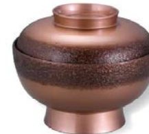
7-252-9 (33503090) ¥6,150 絞り墨入れ銅内黒 TA