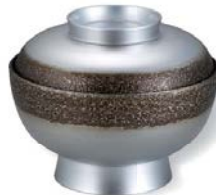
7-252-8 (33503080) ¥6,200 絞り墨入れ銀内黒 TA