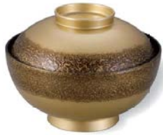
7-252-1 (33502860) ¥5,550 絞り墨入れ金内黒 TA