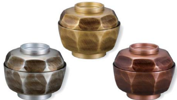
絞り墨入れ内黒 TA 7-252-13 (33503100) 金 ¥5,700 7-252-14 (33503110) 銀 ¥5,650 7-252-15 (33503120) 銅 ¥5,600