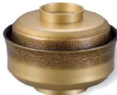
7-252-4 (33502830) ¥6,200 絞り墨入れ金内黒 TA