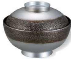
7-252-2 (33502870) ¥5,500 絞り墨入れ銀内黒 TA