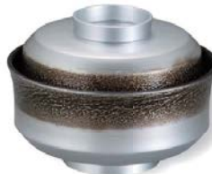
7-252-5 (33502840) ¥6,150 絞り墨入れ銀内黒 TA