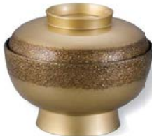
7-252-7 (33503070) ¥6,250 絞り墨入れ金内黒 TA