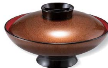
7-206-12 (30120270) ¥4,000 梨地ツバ黒内朱 TA