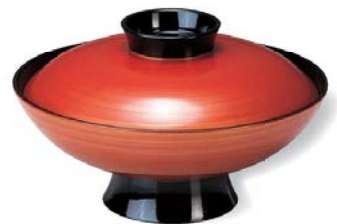
7-206-7 (30048450) ¥3,350 朱こがねツバ黒内黒 TA