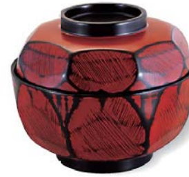
7-211-3 (42010740) ¥3,300 根来内黒 TA (フタ ¥1,380) (オヤ ¥1,920)