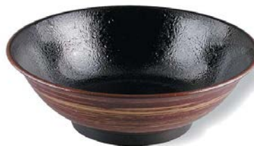
7-229-11 (33101950) ¥3,300 うるみ金霞内黒タタキ ■TA