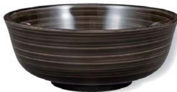
7-232-7 (30045770) ¥4,300 総黒刷毛目塗り PBT-A