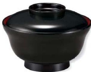
7-210-4 (30048610) ¥2,700 黒内朱 TA