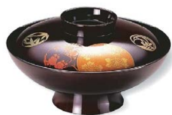
7-206-8 (34010650) ¥4,100 溜/花丸内黒 TA