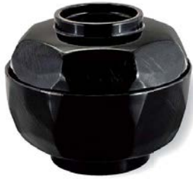
7-211-1 (42010730) ¥2,700 黒内朱 TA (フタ ¥1,100) (オヤ ¥1,600)