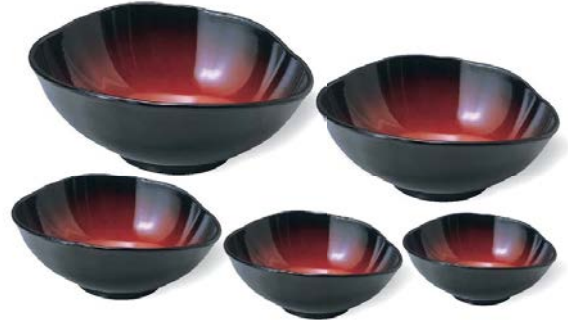
黒内朱ぼかしパール 7-233-11 (51353540) A 4.0寸 ¥950 7-233-12 (51353550) A 5.0寸 ¥1,400 7-233-13 (51353560) A 6.0寸 ¥1,650 7-233-14 (51353570) A 7.0寸 ¥2,050 7-233-15 (51353580) 木製 8.0寸 ¥5,200