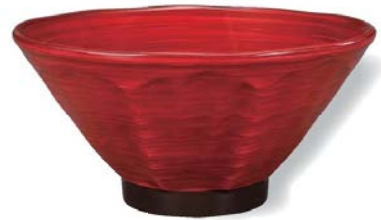
7-231-4 (30045650) ¥4,300 総小豆刷毛目塗り PBT-A