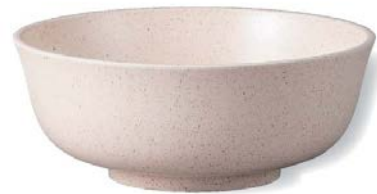
7-232-5 (30048990) ¥3,700 総クリーム粉引 PBT-A

受け皿を器の上に乗せれば、残り汁等がこぼれず、器をまとめて持ち運ぶことができます。