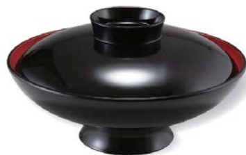
7-205-10 (33710960) ¥3,500 黒内朱 TA