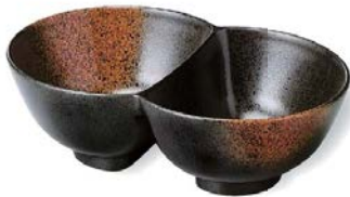
7-233-3 (42012690) ¥3,100 焼き締め A