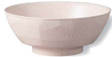
7-232-1 (30048970) ¥3,500 総クリーム粉引 PBT-A