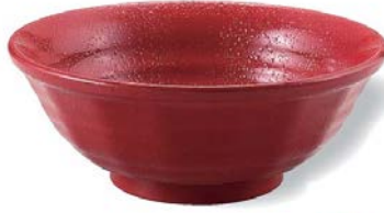
紅赤クリヤータタキ PBT-A 7-230-3 (40421860) 18cm ¥3,250 7-230-4 (40421870) 24cm ¥4,200