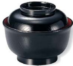
7-208-1 (33100610) ¥1,950 黒内朱 A