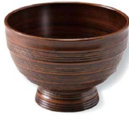
7-217-2 (33711020) ¥2,300 総栃 A