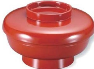
7-208-9 (12033630) ¥2,200 総朱 A