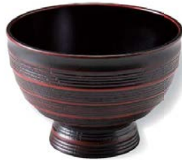
7-217-4 (21080200) ¥2,400 総曙 A