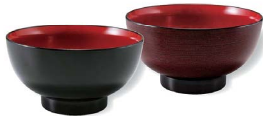
5.6 寸 うどん井 φ169×H90 1,180cc,183g

7-225-7 (45150830) ¥1,300 黒内朱 A 7-225-8 (45150840) ¥1,550 溜刷毛目内朱 A