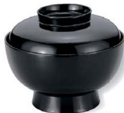
7-210-11 (45014210) ¥2,400 黒内朱 TA