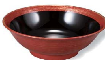
7-229-8 (30045650) ¥2,450 朱かすみ ■TA