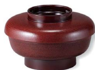
7-208-13 (30048570) ¥2,850 溜刷毛目内黒 A