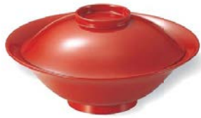
7-202-1 (3100050) ¥3,000 総朱 本質