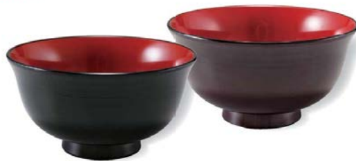
耐熱 5 寸 千筋鉢 φ156×H83 820cc,166g

7-225-5 (38320212) ¥1,550 黒内朱 TA 7-225-6 (38320222) ¥1,700 溜内朱 TA