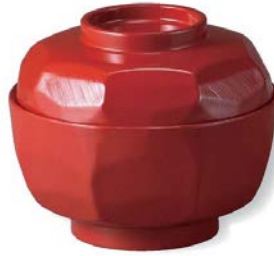
7-211-2 (30048630) ¥2,700 朱内黒 TA (フタ ¥1,100) (オヤ ¥1,600)