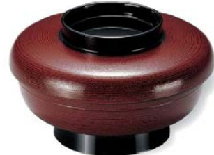
7-208-10 (38050510) ¥2,700 溜刷毛目内黒 A