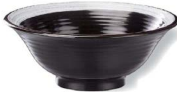
7-230-14 (45023770) ¥3,050 ゆず天目 PBT-A