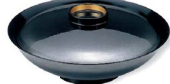
7-202-12 (70001090) ¥8,500 銀ボカシ高台内金 内黒 本質