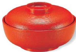
7-202-5 (3260200C) ¥2,650 総柿朱 TA