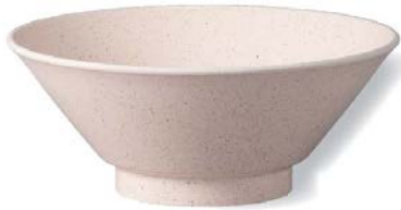
7-231-5 (30048950) ¥3,300 総クリーム粉引 PBT-A