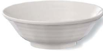
白 PBT-A 7-230-9 (45023640) 18cm ¥3,800 7-230-10 (45023700) 24cm ¥4,650