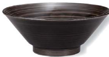
7-231-7 (30045680) ¥4,000 総黒刷毛目塗り PBT-A