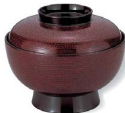
7-210-12 (45014200) ¥3,150 溜刷毛目内黒 TA