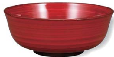
7-232-8 (30045780) ¥4,300 総小豆刷毛目塗り PBT-A