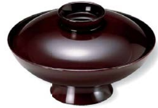
7-205-3 (33601410) ¥2,950 溜内黒 TA