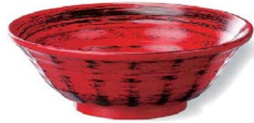
赤に黒刷毛目 PBT-A 7-230-11 (45023670) 18cm ¥4,350 7-230-12 (45023730) 24cm ¥5,400