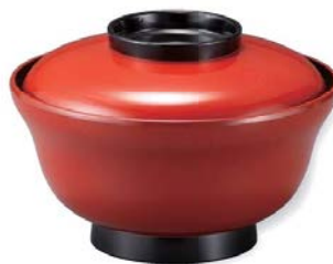
7-210-5 (33601430) ¥2,850 朱ツバ黒内黒 TA