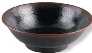
7-229-10 (33101970) ¥3,000 黒天目 ■TA