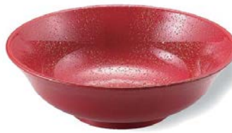
7-229-2 (40421820) ¥1,600 総紅赤クリアータタキ ■A