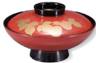
7-205-9 (30048410) ¥3,700 朱ツバ黒/ひょうたん内黒 TA