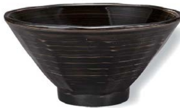
7-231-3 (30045640) ¥4,300 総黒刷毛目塗り PBT-A