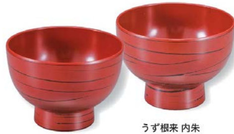
うず根来内朱 A 7-217-7 (33102040) 4.3寸 ¥1,850 7-217-8 (33102060) 4.5寸 ¥2,050