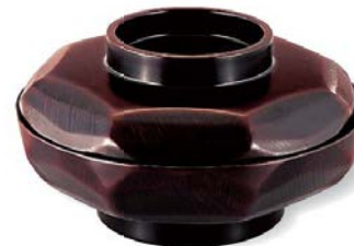
7-211-12 (42010820) ¥3,800 うるし調溜内黒 TA (フタ ¥1,530) (オヤ ¥2,170)