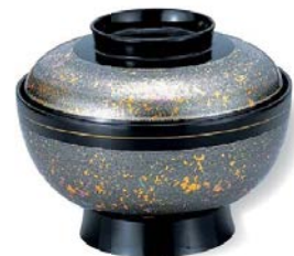
7-210-13 (70001060) ¥3,500 銀光彩高台内金ライン内黒 TA