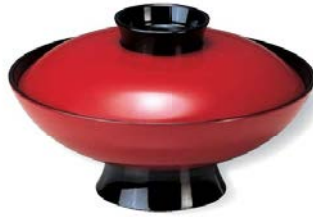
7-205-2 (12025530) ¥2,900 朱ツバ黒内黒 TA