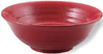
7-230-13 (40421880) ¥3,000 紅赤クリヤータタキ PBT-A