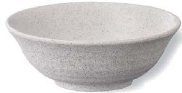
7-230-15 (45023790) ¥3,100 粉引き PBT-A