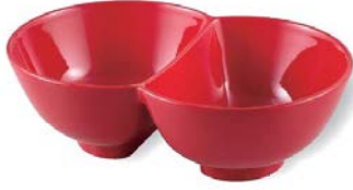
7-233-1 (40421610) ¥2,800 紅赤クリヤータタキ A