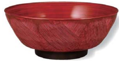
7-232-4 (30045730) ¥4,200 総小豆刷毛目塗り PBT-A