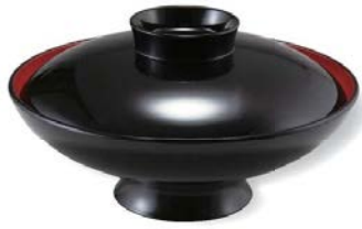
7-205-1 (33710970) ¥2,700 黒内朱 TA