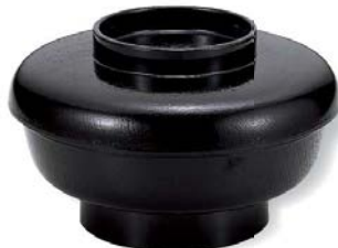
7-208-11 (45151859) ¥2,200 黒内朱 A