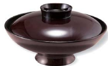
7-205-12 (30120260) ¥3,800 溜内黒 TA