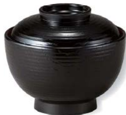
7-210-7 (30048620) ¥3,450 黒内朱 TA