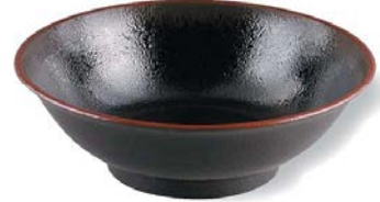
7-229-6 (10421830) ¥2,400 黒天目 ■TA