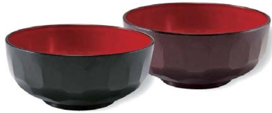
6 寸 亀甲平井 φ184×H82 1,300cc,185g

7-225-3 (33101480) ¥1,100 黒内朱 A 7-225-4 (45150890) ¥1,250 溜内朱 A