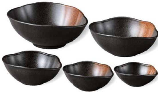
焼き締め 7-233-6 (51353450) A 4.0寸 ¥1,500 7-233-7 (51353450) A 5.0寸 ¥1,950 7-233-8 (51353470) A 6.0寸 ¥2,250 7-233-9 (51353480) A 7.0寸 ¥2,700 7-233-10 (51353490) 木製 8.0寸 ¥5,800