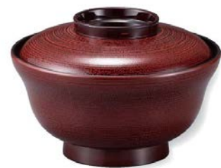
7-210-6 (12033680) ¥3,400 溜刷毛目内黒 TA