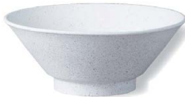
7-231-6 (30048960) ¥3,300 総白粉引 PBT-A