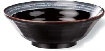
ゆず天目 PBT-A 7-230-5 (45023580) 18cm ¥3,250 7-230-6 (45023740) 24cm ¥4,200