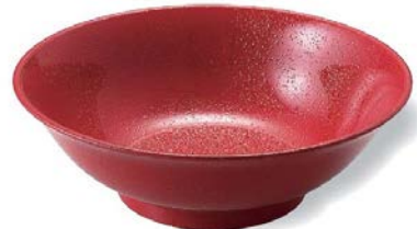
7-229-9 (10421840) ¥2,800 総紅赤クリアータタキ ■TA