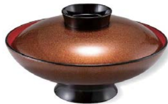
7-206-5 (33710990) ¥3,300 梨地ツバ黒内朱 TA