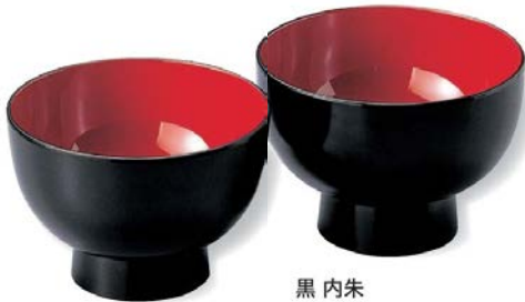
黒内朱 A 7-217-5 (33102045) 4.3寸 ¥1,600 7-217-6 (33102065) 4.5寸 ¥1,650