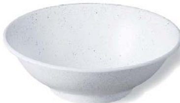
7-229-7 (30048920) ¥3,000 総白粉引 ■TA