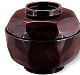
7-211-6 (42010770) ¥3,550 うるし調溜内黒 TA (フタ ¥1,480) (オヤ ¥2,070)