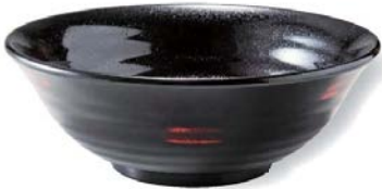
7-230-16 (40421890) ¥3,150 曙内黒タタキ PBT-A