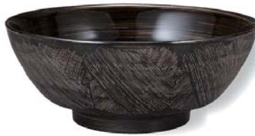
7-232-3 (30045740) ¥4,200 総黒刷毛目塗り PBT-A