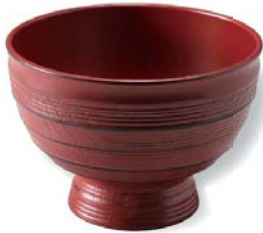
7-217-3 (21080190) ¥2,150 総根来 A