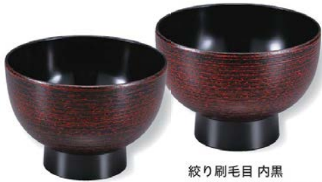
絞り刷毛目内黒 A 7-217-9 (45150720) 4.3寸 ¥1,950 7-217-10 (45150730) 4.5寸 ¥2,150