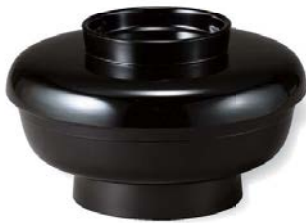
7-208-8 (30048550) ¥2,200 黒内朱 A