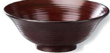
7-230-18 (45023800) ¥3,750 栃刷毛目 PBT-A