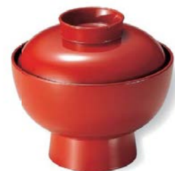
7-210-10 (33021170) ¥2,350 朱内黒 TA