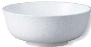
7-232-6 (30049010) ¥3,700 総白粉引 PBT-A