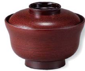
7-210-3 (30048590) ¥2,500 溜刷毛目内黒 TA