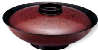
7-202-10 (70001080) ¥7,300 溜刷毛目 内黒 本質