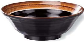
ゆず栃天目 PBT-A 7-230-7 (45023690) 18cm ¥3,200 7-230-8 (45023750) 24cm ¥4,200