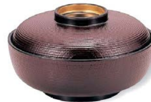
7-202-5 (32602020) ¥3,100 溜高台内金 内黒 TA