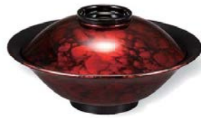
7-202-2 (3004516C) ¥4,500 ワイン刷毛八雲内黒 本質