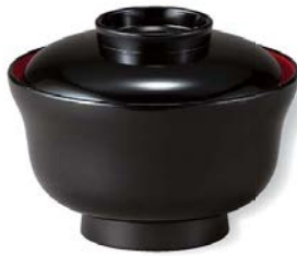
7-210-1 (30048580) ¥2,150 黒内朱 TA