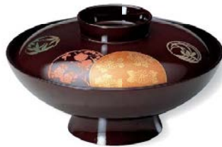
7-205-8 (34010550) ¥4,100 溜/花丸内黒 TA