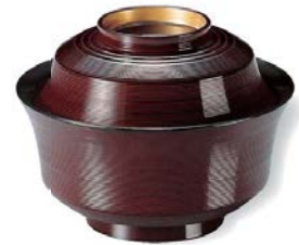
7-208-4 (32602180) ¥2,950 溜高台内金内黒 TA