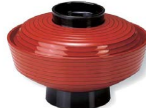
7-202-8 (1202570C) ¥3,300 朱研出し 内朱 TA