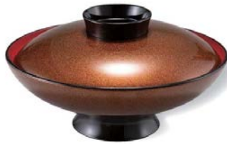
7-205-5 (30048390) ¥3,400 梨地ツバ黒内朱 TA