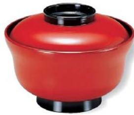
7-210-2 (33601380) ¥2,200 朱ツバ黒内黒 TA