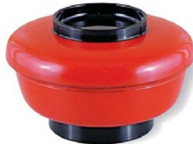
7-208-6 (41000040) ¥1,950 朱ツバ黒内黒 A