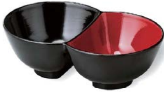
7-233-2 (42012680) ¥2,950 黒/朱ツートン A