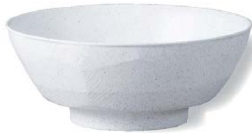
7-232-2 (30048980) ¥3,500 総白粉引 PBT-A