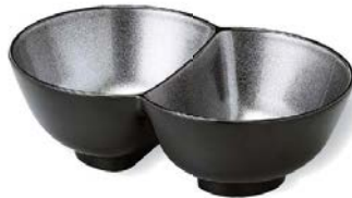
7-233-4 (42012700) ¥3,700 黒内銀梨地 A