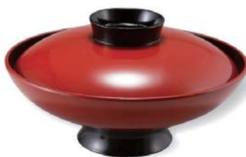
7-205-11 (30120250) ¥3,800 朱ツバ黒内黒 TA