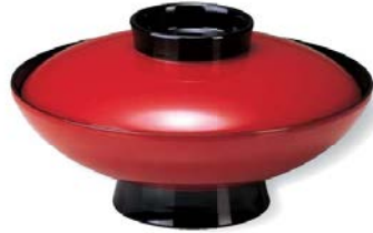
7-206-2 (12025570) ¥2,850 朱ツバ黒内黒 TA