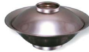
7-202-3 (15158240) ¥4,500 総銀透ぎ 本質