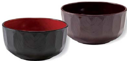
5 寸 亀甲井 φ146×H73 930cc,113g

7-225-1 (41300620) ¥850 黒内朱 A 7-225-2 (41300630) ¥850 総新溜 A