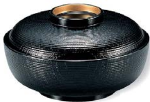
7-202-4 (32602010) ¥2,750 黒高台内金 内黒 TA