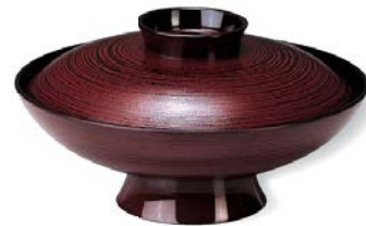
7-206-6 (30048440) ¥3,000 溜刷毛目内黒 TA