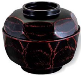
7-211-4 (42010750) ¥3,450 曙内黒 TA (フタ ¥1,430) (オヤ ¥2,020)