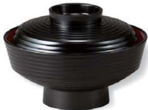
7-202-7 (30048350) ¥2,600 黒無地 内朱 TA