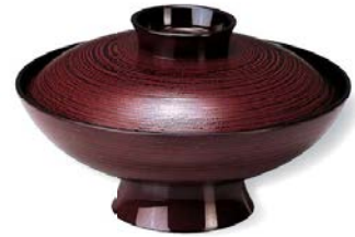
7-205-6 (12025540) ¥3,050 溜刷毛目内黒 TA