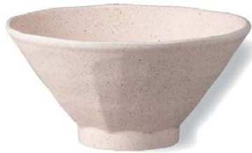
7-231-1 (30048930) ¥3,600 総クリーム粉引 PBT-A