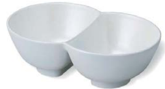
7-233-5 (42012760) ¥4,500 ホワイトアクア A