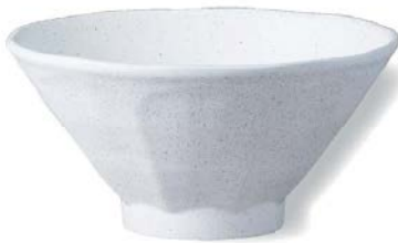
7-231-2 (30048940) ¥3,600 総白粉引 PBT-A