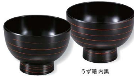
うず曙内黒 A 7-217-11 (33102030) 4.3寸 ¥1,850 7-217-12 (33102050) 4.5寸 ¥2,050