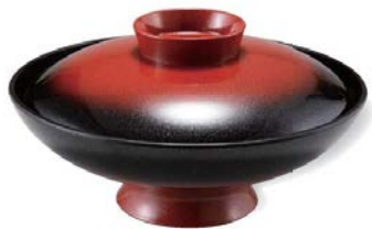
7-206-4 (30048430) ¥3,200 朱ぼかしパール内黒 TA