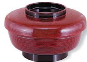
7-208-7 (41000060) ¥2,300 溜刷毛目内朱 A