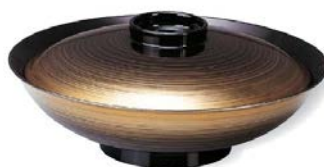
7-202-11 (12025880) ¥8,000 金カスミライン 内黒 本質