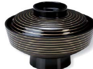
7-202-9 (12025720) ¥3,600 黒/金ライン 内黒 TA