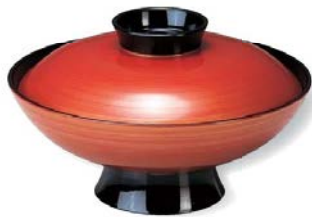
7-205-7 (12025550) ¥3,450 朱こがねツバ黒内黒 TA