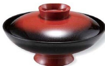
7-206-11 (30120290) ¥4,000 朱ぼかしパール内黒 TA