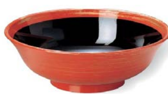
7-229-5 (38020750) ¥1,900 朱かすみ ■TA