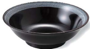
7-229-12 (40421850) ¥2,600 ゆず天目 ■TA