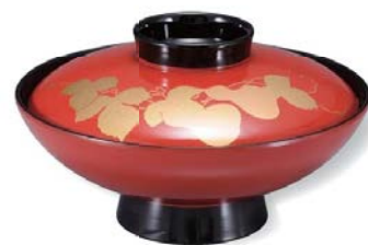
7-206-9 (33100655) ¥3,600 朱ツバ黒/ひょうたん内黒 TA