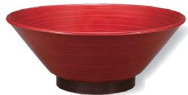
7-231-8 (30045690) ¥4,000 総小豆刷毛目塗り PBT-A