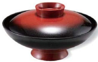
7-205-4 (30048380) ¥3,300 朱ぼかしパール内黒 TA