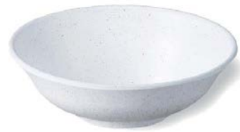
7-229-3 (30048910) ¥2,100 総白粉引 ■A