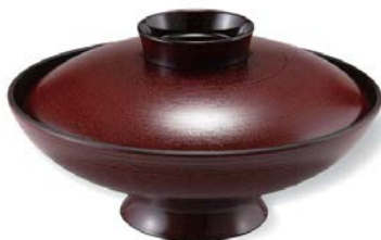
7-206-10 (30120280) ¥4,000 溜刷毛目内黒 TA