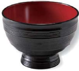
7-217-1 (33711010) ¥1,700 黒内朱 A