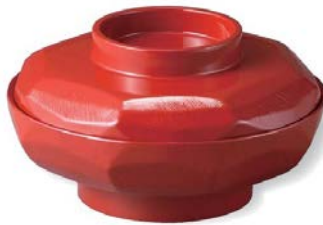
7-211-8 (30048640) ¥2,750 朱内黒 TA (フタ ¥1,150) (オヤ ¥1,600)