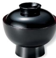
7-210-9 (33021180) ¥2,350 黒内朱 TA