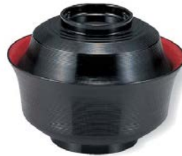
7-208-3 (33601350) ¥2,450 黒内朱 TA