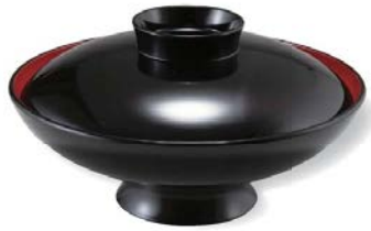
7-206-1 (33710980) ¥2,700 黒内朱 TA