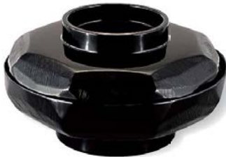
7-211-7 (42010780) ¥2,750 黒内朱 TA (フタ ¥1,150) (オヤ ¥1,600)