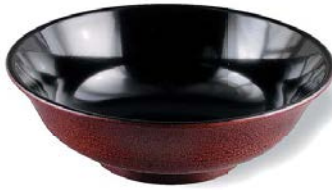
7-229-1 (33101560) ¥1,450 溜刷毛目内黒 ■A