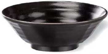
総黒タタキ PBT-A 7-230-1 (45023660) 18cm ¥3,250 7-230-2 (45023720) 24cm ¥4,200

18cm : φ180×H71 800cc,275g 24cm : φ240×H82 1,600cc,440g