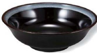
7-229-4 (30045620) ¥2,000 ゆず天目 ■TA