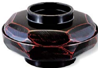
7-211-10 (42010800) ¥3,700 曙内黒 TA (フタ ¥1,550) (オヤ ¥2,150)