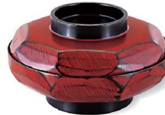
7-211-9 (42010790) ¥3,500 根来内黒 TA (フタ ¥1,500) (オヤ ¥2,000)