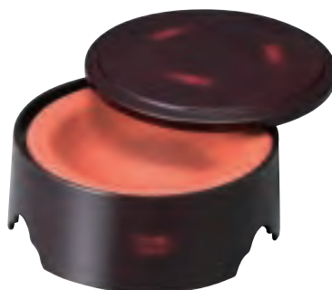
6寸 柳川溜曙 M (皿別売) 6-897-3 本体 ¥1,850 φ178×85 5-755-3 (44013060) 6-897-4 蓋 ¥1,450 φ170 5-755-4 (44013050)