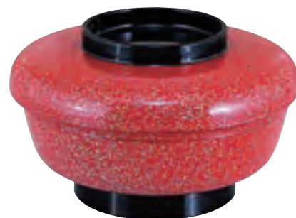
6-895-6 ¥2,950 やすらぎミニ井 朱本銀平目ツバ黒内黒 [A] 5-248-12 (41000100)