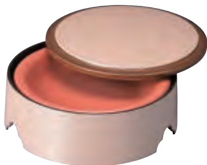
7寸 柳川銀 M (皿別売) 6-897-5 本体 ¥3,400 φ225×88 5-755-5 (44013770) 6-897-6 蓋 ¥2,750 φ215 5-755-6 (44013780)