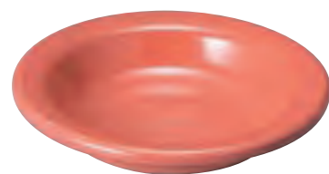
6-897-9 ¥1,350 6寸 柳川陶皿 陶 φ158×20 5-755-9 (44883030)