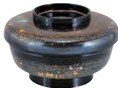
6-895-3 ¥2,750 やすらぎミニ井 鏡光彩ぼかし内朱 [A] 5-248-9 (41000090)