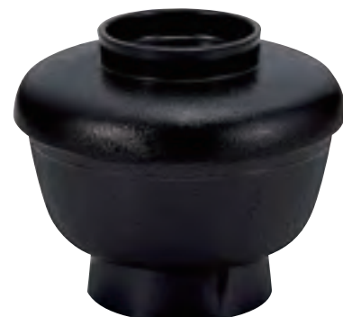
6-893-11 ¥1,650 5寸やすらぎ木目井 黒内朱 A 5-259-11 (45151858)