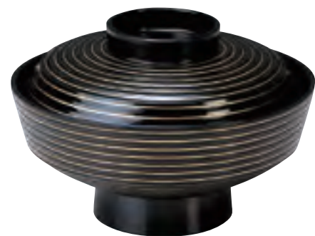
6-892-10 ￥3,500 耐熱5.5寸 直筋カツ井 金ライン [TA] 5-250-8 (12025720)