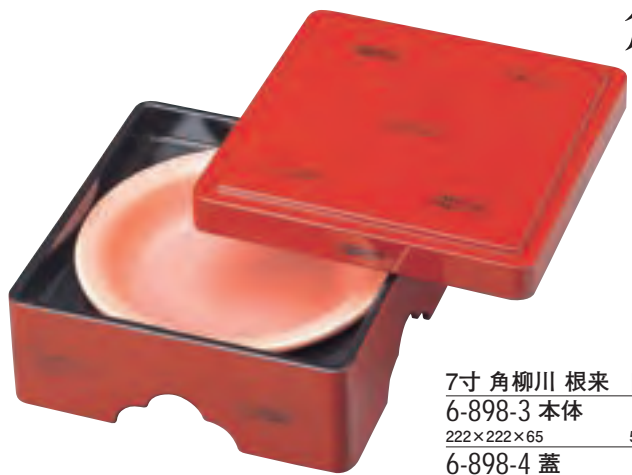
7寸 角柳川 根来 M (皿別売) 6-898-3 本体 ￥3,300 222×222×65 5-756-3 (44013320) 6-898-4 蓋 ￥2,900 222×222×27 5-756-4 (44013310)