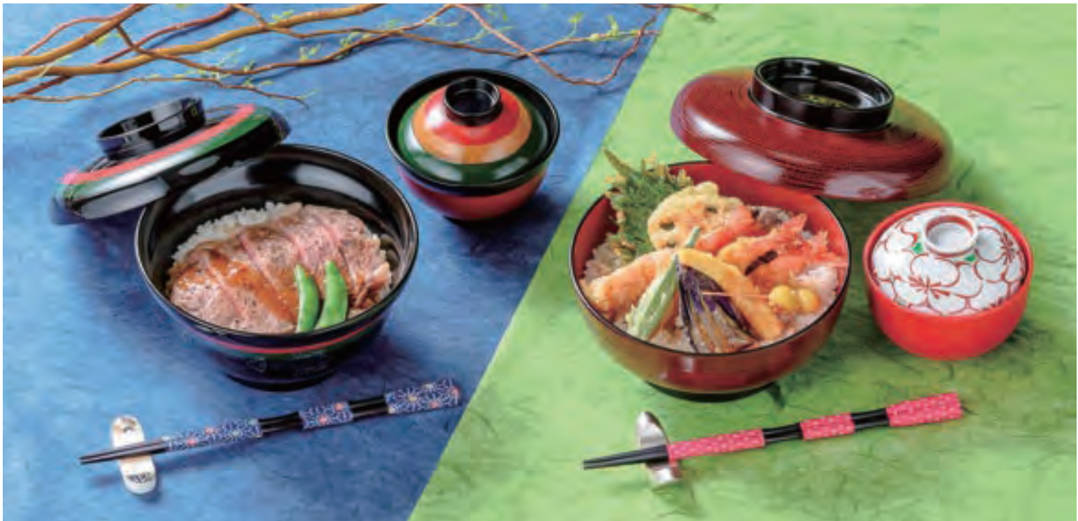
6-894-3 ¥3,200 耐熱5.5寸 かすみ丼椀 溜刷毛目 TA 5-256-10 (12033680)