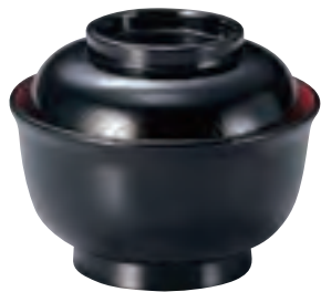
6-896-1 ¥1,650 姫木目井 黒内朱 [A] 5-256-1 (33100610)