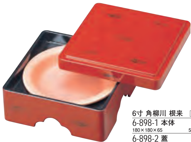
6寸 角柳川 根来 M (皿別売) 6-898-1 本体 ￥2,700 180×180×65 5-756-1 (44013280) 6-898-2 蓋 ￥2,300 180×180×25 5-756-2 (44013270)