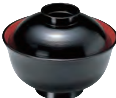
6-893-9 ¥2,100 耐熱5寸 千筋井物椀 黒内朱 TA 5-259-9 (38020210) (親のみ¥1,550)