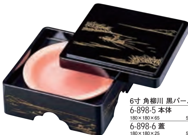
6寸 角柳川 黒パール山水 M 6-898-5 本体 ￥3,200 180×180×65 5-756-5 (44013300) 6-898-6 蓋 ￥2,300 180×180×25 5-756-6 (44013290) (皿別売)