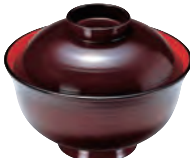
6-893-10 ¥2,400 耐熱5寸 千筋井物椀 溜内朱 TA 5-259-10 (38020220) (親のみ¥1,700)