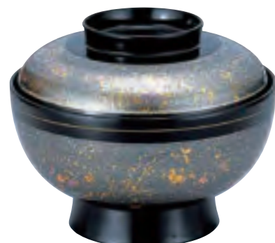
6-893-3 ¥3,300 耐熱5寸 羽衣井 銀光彩高台内金ライン TA 5-259-3 (70001060)