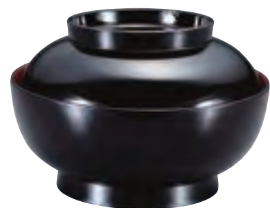
6-893-6 ¥1,750 三笠井 黒内朱 A 5-259-6 (12033650)