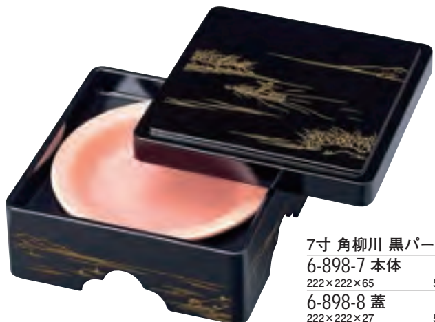
7寸 角柳川 黒パール山水 M 6-898-7 本体 ￥3,900 222×222×65 5-756-7 (44013340) 6-898-8 蓋 ￥2,900 222×222×27 5-756-8 (44013330) (皿別売)