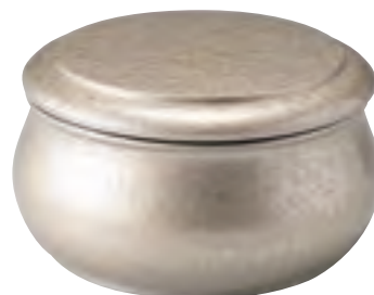
寿冠ちらし シャンパンゴールド内朱塗 [A] 6-896-10 本体(浅) ¥3,050 φ170×80 (40420940) 6-896-11 蓋 ¥1,550 φ155×20 (40420950)