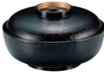
6-892-6 ￥2,750 耐熱5.5寸 千筋木目椀 黒高台内金 [TA] 5-250-4 (32602010)