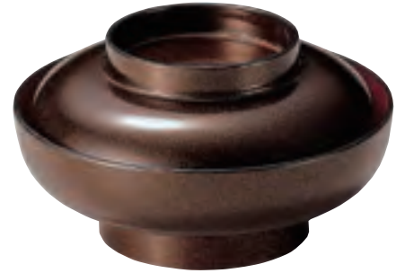
6-892-1 ￥1,750 5.5寸 高野椀 梨地内朱 [A] 5-255-7 (38020010)

5.5寸：φ165×H93 (H63) 650cc,262g (149g) 6寸：φ178×H98 (H66) 810cc,271g (160g)