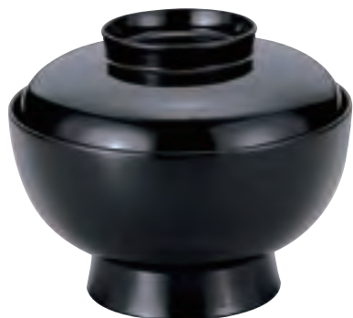
6-893-1 ¥2,200 耐熱5寸 羽衣井 黒内朱 TA 5-259-1 (45014210)