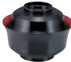
6-896-3 ¥2,200 耐熱4.5寸 竹型井碗 黒内朱 [TA] 5-256-3 (33601350)