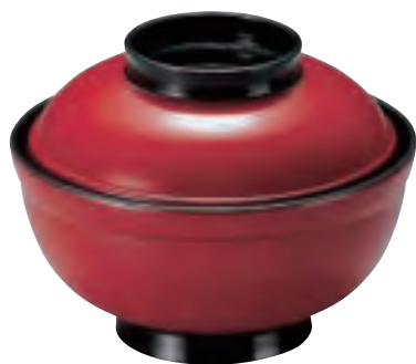
6-893-7 ¥1,700 5寸 大輪井 朱ツバ黒内黒 A 5-259-7 (33100590)