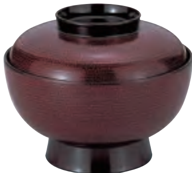
6-893-2 ¥2,950 耐熱5寸 羽衣井 溜はじき刷毛目 TA 5-259-2 (45014200)