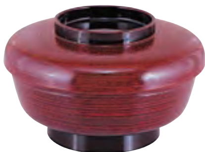
6-895-4 ¥2,200 やすらぎミニ井 緋はじぎ剛毛目内朱 [A] 5-248-10 (41000080)