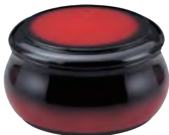
寿冠ちらし 朱黒ぼかし毘沙門内黒塗 [A] 6-896-12 本体(浅) ¥3,400 φ170×80 (40420960) 6-896-13 蓋 ¥1,550 φ155×20 (40420970)