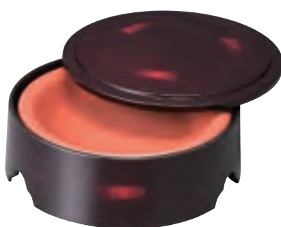
7寸 柳川溜曙 M (皿別売) 6-897-7 本体 ¥2,450 φ225×88 5-755-7 (44013160) 6-897-8 蓋 ¥1,850 φ215 5-755-8 (44013150)