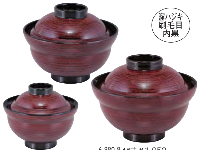
溜ハジキ 刷毛目 内黒

耐熱かがみ椀 蛇の目内黒 TA 6-889-4 3.5寸 ¥1,400 5-261-4 (32015740) 6-889-5 4.6寸 ¥1,900 5-261-5 (32015730) 6-889-6 6寸 ¥2,200 5-261-6 (32015720)