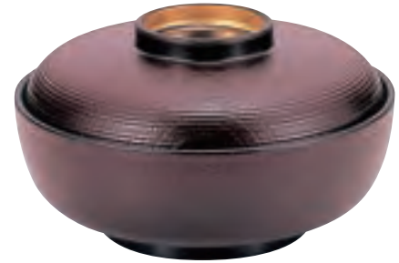
6-892-7 ￥3,100 耐熱5.5寸 千筋木目椀 溜高台内金 [TA] 5-250-5 (32602020)