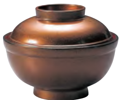
6-893-8 ¥1,700 5寸 大輪井 梨地内朱 A 5-259-8 (12025830)