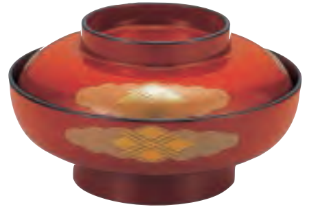
6-892-3 ￥2,800 5.5寸 高野椀 正法寺内朱 [A] 5-255-11 (38020030)