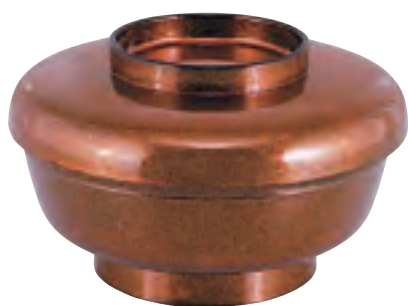
6-895-1 ¥1,750 やすらぎミニ井 梨地天黒内朱 [A] 5-248-7 (41000140)