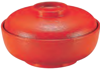
6-892-5 ￥2,700 耐熱5.5寸 千筋木目椀 柿朱 [TA] 5-250-3 (32602000)