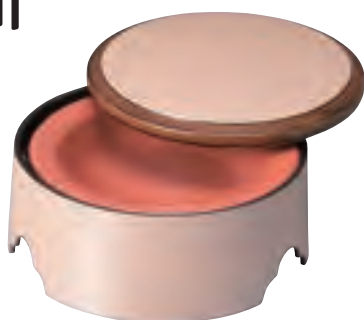
6寸 柳川銀 M (皿別売) 6-897-1 本体 ¥2,800 φ178×85 5-755-1 (44013750) 6-897-2 蓋 ¥2,350 φ170 5-755-2 (44013760)