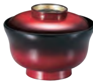
6-896-6 ¥2,200 耐熱4.5寸 かすみ碗 朱ぼかし高台内金 [TA] 5-256-6 (37002220)