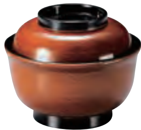
6-896-2 ¥2,300 姫木目井 栃 [A] 5-256-2 (32602370)