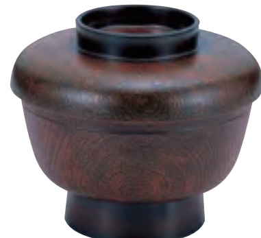
6-893-12 ¥1,950 5寸やすらぎ木目井 栃内朱 A 5-259-12 (45014220)