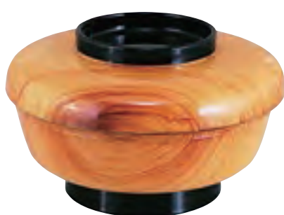
6-895-5 ¥2,950 やすらぎミニ井 香林内朱 [A] 5-248-11 (41000080)