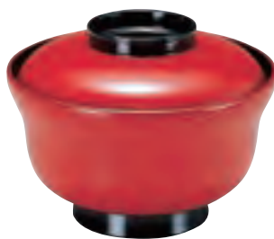
6-896-5 ¥2,100 耐熱4.5寸 かすみ碗 朱ツバ黒 [TA] 5-256-5 (33601380)