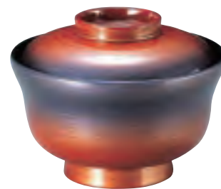
6-896-7 ¥2,450 耐熱4.5寸 かすみ碗 アメジスト [TA] 5-256-7 (32602170)