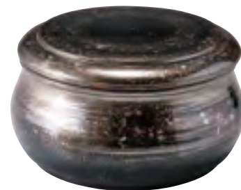
寿冠ちらし 銀光彩内朱塗 [A] 6-896-8 本体(浅) ¥2,700 φ170×80 (40420920) 6-896-9 蓋 ¥1,550 φ155×20 (40420930)