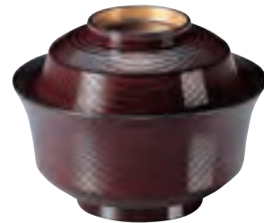
6-896-4 ¥2,700 耐熱4.5寸 竹型井碗 溜高台内金 [TA] 5-256-4 (32602180)