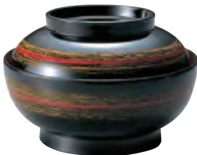
6-893-5 ¥2,000 三笠井 立見ライン内朱 A 5-259-5 (12025590)