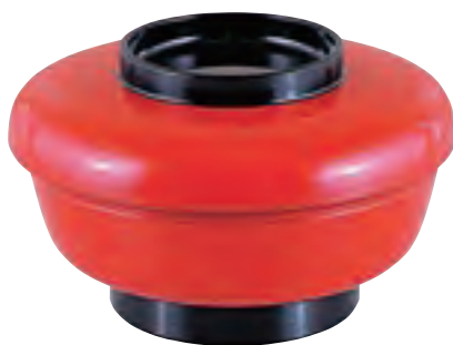
6-895-2 ¥1,850 やすらぎミニ井 朱ツバ黒内黒 [A] 5-248-8 (41000040)