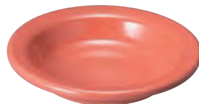
6-897-10 ¥1,450 7寸 柳川陶皿 陶 φ200×25 5-755-10 (44883130)