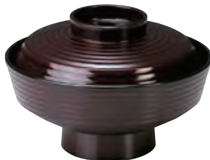
6-892-9 ￥2,700 耐熱5.5寸 直筋カツ井 溜 [TA] 5-250-7 (12025710)