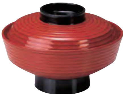
6-892-8 ￥3,100 耐熱5.5寸 直筋カツ井 朱研出し内朱 [TA] 5-250-6 (12025700)