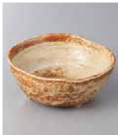
72-34-71G 680円 黄灰釉小鉢 12.5×5.2cm