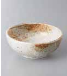
76-19-51G 380円 雪志野3.5ボール 10.8×4.5cm