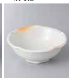
68-17-2G 1,100円 火色志野4.0鉢 12×4.8cm