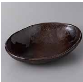
55-4-77G 1,380円 備前灰釉6寸小判鉢 18.5×13.5×3.5cm