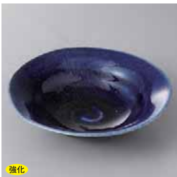
強化 43-3-79G 2,250円 紺勾玉平鉢 19.3×5.4cm