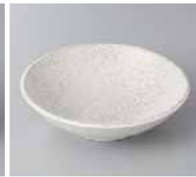
56-9-55G 1,100円 飛白 4.5 浅ボール 14×4cm