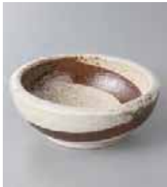
75-23-25G 480円 志野サビ刷毛括り手 4.0鉢 12.8×4.8cm