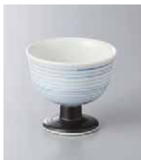
63-18-27G 1,500円 青千段高台小付 8.2×7.5cm