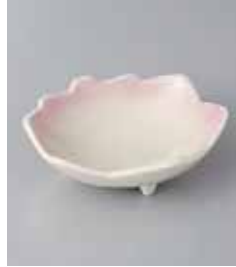
79-17-77G 1,100円 もみじ紫吹小鉢 11×10×4cm