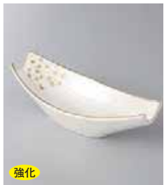
強化 78-1-79G 2,960円 金吹雪小鉢 17.3×8.1×5.5cm