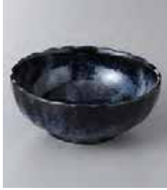
76-8-8G 420円 菊型40ボールあいの雪 12.5×5cm