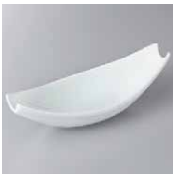
43-16-22G 2,200円 白釉舟型向付 25.3×10×7.3cm