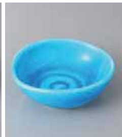
78-3-52G 2,300円 青交趾まゆ型小付 11×10×4cm