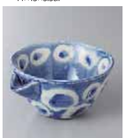
78-13-34G 1,800円 風船片口鉢 15.5×13.5×7.2cm