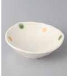
77-22-36G 300円 ドット三角 3.3浅鉢 11.3×3.6cm