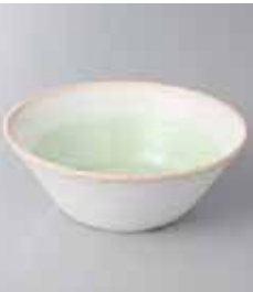
73-21-25G 650円 若葉4.5鉢 14.3×5.1cm