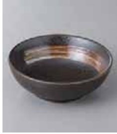
76-10-21G 410円 白刷毛天目3.9ボール 12×4.1cm