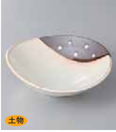
土物 70-26-2G 840円 測水玉小鉢(小) 13×11.5×4.2cm