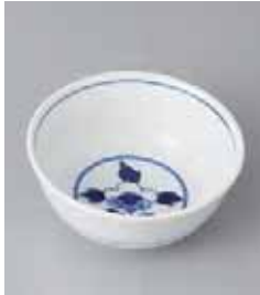
72-20-52G 700円 牡丹玉割 10.3×4.3cm