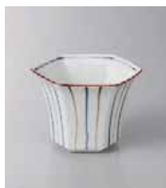
78-8-52G 2,150円 二色十草六角小鉢 10.5×9.5×7.7cm