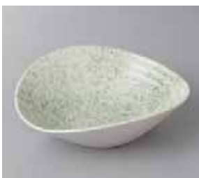
46-28-57G 1,800円 ピフしぶきラスターたわみ型向付 16.6×15.1×5cm