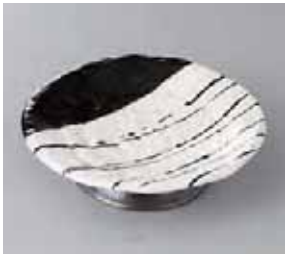
46-15-77G 1,820円 黒塗分けストライプ高台5寸皿 16.5×5cm