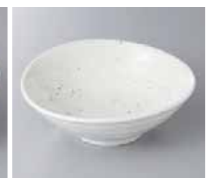
56-25-43G 900円 たわみ粉引 16 寸鉢 18×17×5.7cm