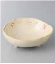
80-8-77G 930円 彫り小花三つ足4.0小鉢 12×10.8×4cm