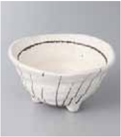
70-10-35G 900円 ストライプ(白)三ツ足小鉢 11.4×6.1cm