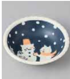
75-31-8G 450円 ねごと日曜白雪だるま 40鉢 13.5×4cm