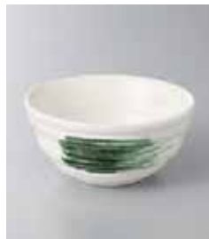
77-35-71G 260円 粉引|織部刷毛小鉢 10.8×5cm