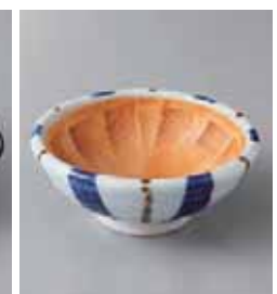
74-24-79G 560円 十草スリ鉢 3.3 10.3×4.1cm