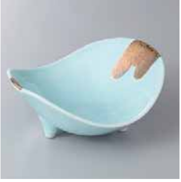
60-6-23G 2,650円 青白磁石庭小鉢 14.7×12.2×5.7cm