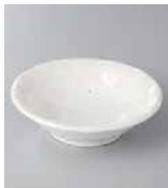
75-7-77G 500円 石目白 12.5cm丸鉢 12.5×3.7cm