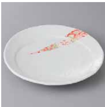
45-4-77G 2,300円 赤華友禅 6.5寸皿 20.5×3cm