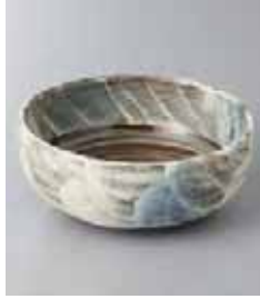
67-16-33G 1,350円 青吹白タタキ4.0ボール 12.5×5cm