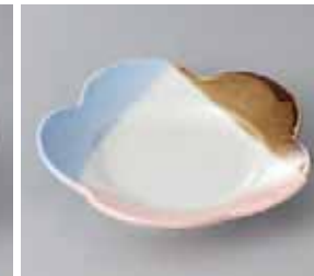
47-20-23G 1,600円 梅花型鉢 17.9×3.8cm