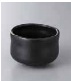
75-12-43G 500円 天目はんわり碗 9.3×6.4cm