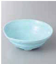
77-28-2G 290円 ブルー片口小鉢 11.3×4.2cm