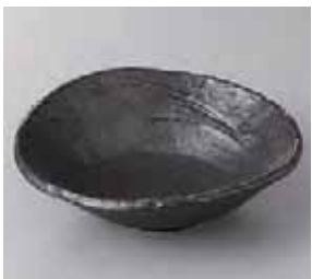
50-29-37G 720円 黒備前扇中鉢 17.5×16.5×5.5cm