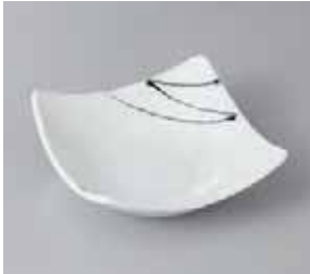
50-9-22G 970円 白釉黒一珍四方上り鉢(小) 13×13×4.5cm