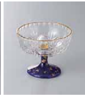
62-3-22G 2,800円 ガラスソアール小鉢 8.8×7cm