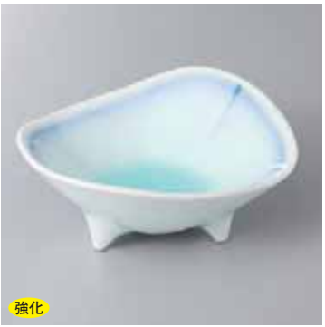
強化 60-10-71G 2,500円 青白磁藍流し小鉢 13.8×11.5×5.7cm