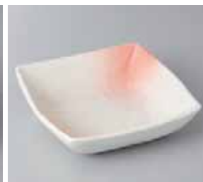
56-13-43G 1,050円 弥生しくめ角中鉢 15.2×15.2×4.4cm