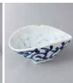
78-11-23G 1,850円 タコ唐草変型小鉢 14.4×11.5×6.5cm