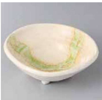
55-11-21G 1,300円 葉桜四足四角中鉢 16.3×16.2×5.7cm