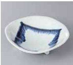
50-15-22G 880円 四方均煮 5.0 鉢 15.8×4.5cm