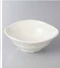
76-24-31-56G 370円 乳白4.0鉢 12.9×4.7cm