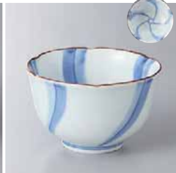
61-12-37G 2,200円 染付祥瑞輪花3.8小鉢 10.7×6.7cm