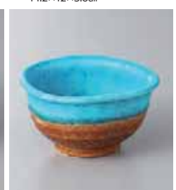
80-30-34G 800円 トルコ三角(小) 8.8×8.8×5cm