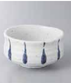
73-15-48G 650円 藍十草抹茶型小鉢(大) 9.8×5.5cm