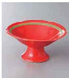
63-24-77G 1,650円 赤釉高台小鉢 13×6.5cm