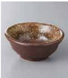
72-31-78G 690円 信楽吹小鉢(吞水) 11.4×5cm