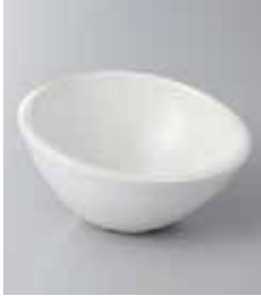
69-13-2G 980円 白マット4.0ボール 12×12×6.5cm