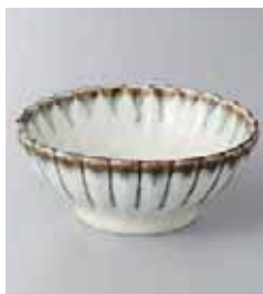
73-31-71G 630円 うのふ流し菊型3.6鉢 11.2×4.5cm