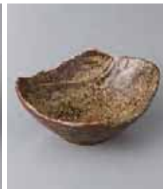
80-5-51G 950円 不動小鉢 14×12.3×5.5cm