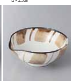
68-22-23G 1,100円 モタン十草片口3.5鉢 11.2×10.4×4.4cm