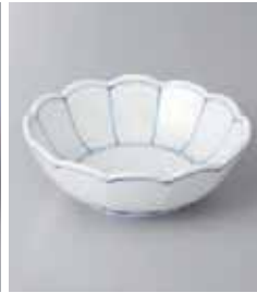
69-6-37G 1,000円 菊割取皿 11.7×4cm