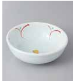
72-6-37G 720円 青地花だより玉淵 3.5ボール 11.5×4.3cm