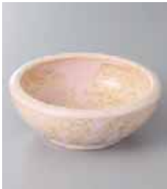
75-22-77G 480円 夢ロマンくくり手 4寸深鉢 12.8×4.8cm