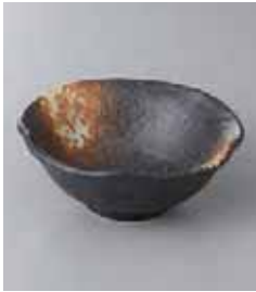
72-1-8G 740円 黒備前花 12cm小鉢 12×4.5cm