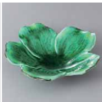
43-14-33-77G 2,400円 緑釉黄流し花形向付 19.5×4.3cm