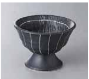
64-28-35G 900円 ストライプ(黒)高台小鉢 10.2×7.4cm