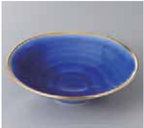
46-3-93G 2,000円 有田焼 四軸金青平小鉢 5入 15.5×4.5cm