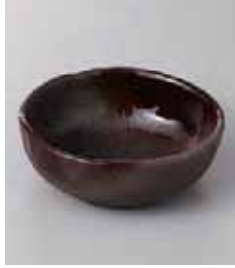
69-10-77G 1,110円 備前灰釉4寸丸鉢 12×4.3cm