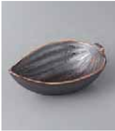
79-1-27G 1,340円 白土孔雀型小鉢 14.8×8.7×5.6cm