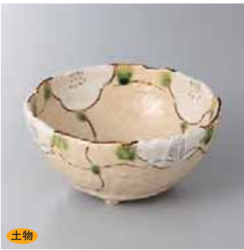
土物 42-2-22G 2,500円 格子花三ツ足5.0鉢 15.3×7cm