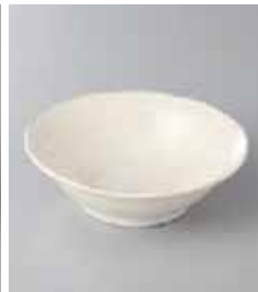
77-30-43G 300円 クラフ粉引|3.3浅鉢 11.3×4.5cm