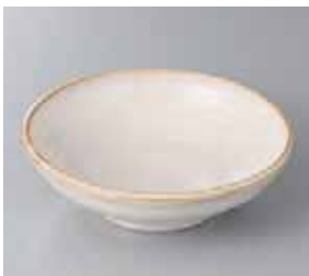
50-31-25G 700円 粉引 荒引 浅鉢 16.8×5.2cm