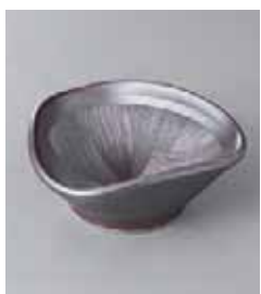
80-19-2G 880円 鉄錆三角すり4.0小鉢 12×4.8cm