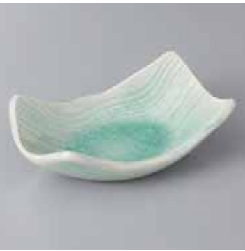
60-11-45G 2,500円 青磁流水紋舟形小鉢 14×8.5×4.8cm