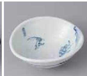
47-8-2G 1,700円 染付鳥獸戯画たわみ小鉢 15.5×13.8×5.9cm