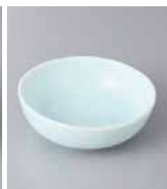
74-21-32G 570円 青白磁五輪鉢 11×4cm