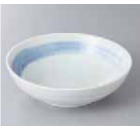
57-19-2G 530円 清瀬内外4.5ボール 15×4.8cm