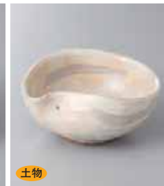
土物 78-5-45G 2,000円 粉引刷毛片口中鉢(手造) 13.6×12×6cm