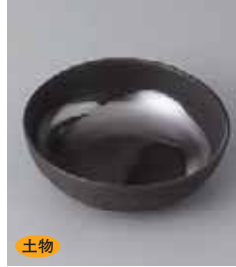
土物 72-17-61G 700円 銀流し小鉢 80入 12×4cm