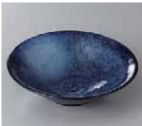
51-7-33G 620円 雲海5.5平鉢 17.5×5cm