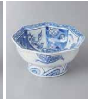
62-15-23G 2,350円 八角高台祥瑞小鉢 12.4×6cm