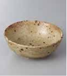
70-18-71G 860円 黄唐津 4.0ボール 13.1×4.7cm