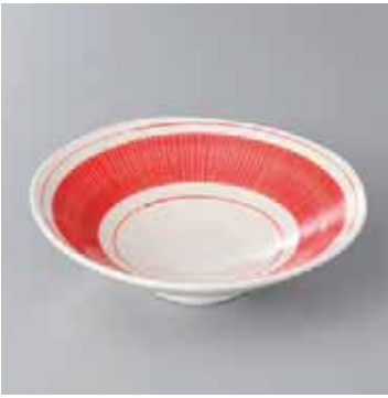
42-18-93G 2,400円 有田焼 絹十草(赤)平鉢 5入 15.5×4.5cm