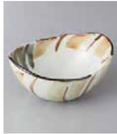
79-5-23G 1,300円 モダン十草楕円鉢(小) 14.5×11×6.8cm