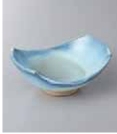
79-10-34G 1,180円 藍釉流し舟型鉢 12.2×10×5cm