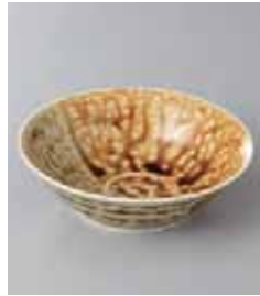
76-5-21G 430円 彩ア×織部手引3.5浅鉢 10.7×3.2cm