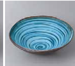
47-30-23G 1,500円 黒潮5.0円錐鉢 17×5.5cm