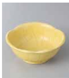
74-20-79G 560円 イエロー梅小鉢 11.5×11.2×4.5cm