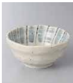
75-1-23G 540円 唐津十草 3.8小鉢 12×5.7cm