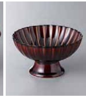
62-20-48G 2,700円 うるしブラウン高台デザート鉢 11.5×7cm