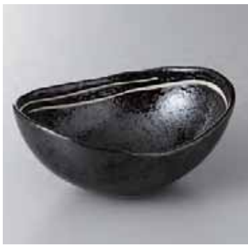
53-10-6G 1,800円 黒けがき楕円鉢(大) 17.7×13.3×7.1cm