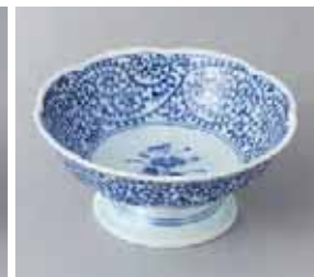
65-29-51G 670円 タコ唐草高台デザート 12.3×5.6cm