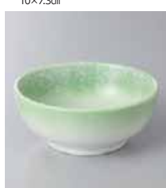
68-20-77G 1,130円 ヒフ吹白タキ小鉢 10×4.2cm