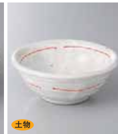
土物 68-5-73G 1,160円 赤い糸4.5中鉢 13.7×5.3cm