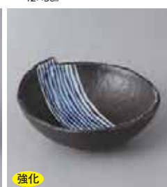
強化 68-15-77G 1,140円 京清水強化黒釉とじ目小ボール 11×4.5cm