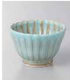
73-17-71G 650円 みずあさぎ菊型深小鉢 9.5×6cm