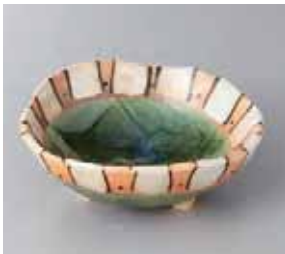
46-25-22G 1,750円 塗分織部十草三ツ足向付 14.5×5cm