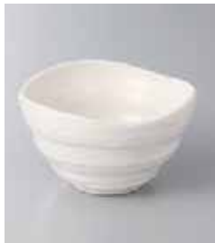
77-25-2G 300円 粉引三ツ山小鉢 10×6cm