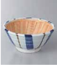
73-10-79G 650円 十草すり鉢4.0 11.8×5.5cm