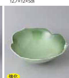
強化 78-29-79G 1,450円 緑彩三葉松花堂 12.5×12.5×4cm