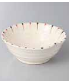
73-33-71G 630円 二色十草(赤)片押し鉢 12×11.7×4.6cm