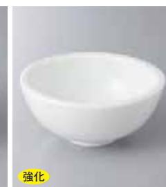
強化 66-12-22G 2,000円 フュージョン4.3ボール(W) 13×7cm