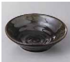
57-1-71G 870円 金彩天目5.0鉢 15×4.5cm