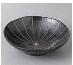
51-13-57G 550円 黒マツ十草5.5浅鉢 17×5cm