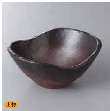
土物 60-1-51G 2,750円 備前楕円鉢(中) 13.5×12.5×6.5cm