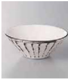
67-28-20G 1,200円 錆粉引しのぎ深鉢(小) 80入 12.6×4cm