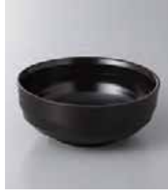
77-17-48G 320円 梨地天目丸小鉢 11.7×5cm