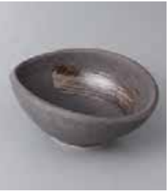
70-12-56G 890円 うずたまご 4.0小鉢 14×12×6cm