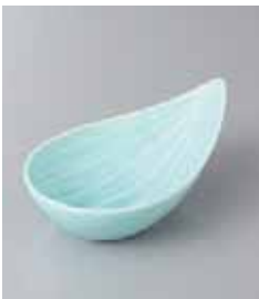
80-14-25G 850円 笹型小鉢(青磁) 14×8.5×5.4cm