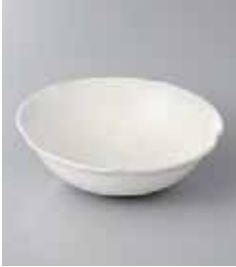
70-14-8G 880円 京唐津朝顔小鉢 13.3×4.5cm