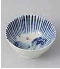
72-8-10G 720円 京野菜八角小鉢 白菜 10.9×5.4cm