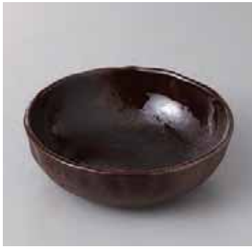
53-18-77G 1,710円 備前灰釉5寸丸鉢 15.8×5cm