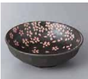
57-20-2G 530円 染付桜4.5ボール 15×4.8cm