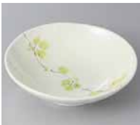
51-27-36G 420円 リーフ浅鉢 17.8×4.8cm