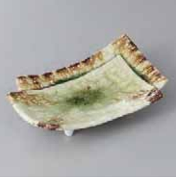
42-7-23G 2,500円 灰釉井桁向付 17.5×11.2×4.7cm