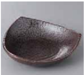
50-13-56G 900円 いぶし三角鉢 17.5×17×5cm