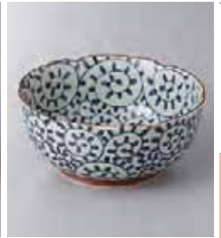
67-6-93G 1,350円 有田焼 内外タコ唐草深小鉢 5入 13.2×5.8cm