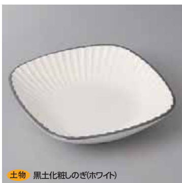
土物 黒土化粧しのぎ(ホワイト) 43-23-25G 2,100円 6.5角鉢 19.5×19.5×4.3cm 43-24-25G 1,200円 4.5角鉢 14.3×14.3×4.3cm