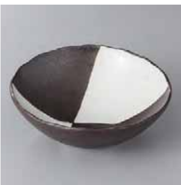
44-14-71G 2,150円 市松向付 15.4×5cm