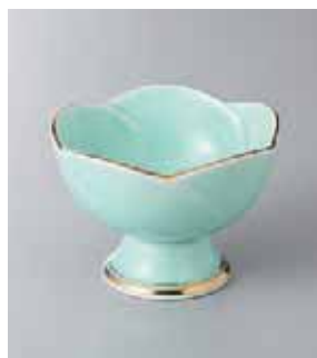
63-10-48G 1,750円 天竜寺高台3.0小鉢 9.5×7cm