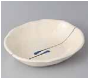
50-21-27G 830円 釉禪楕円浅鉢(小) 17.5×14.5×3.8cm