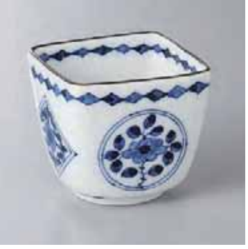
60-8-35G 2,600円 古染亀甲角小付 7.8×7.8×7cm