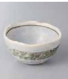
73-27-22G 630円 タタラ刷毛目小鉢(大) 11×6cm