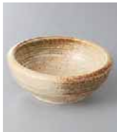
75-13-77G 510円 いぶきくくり手 4寸深鉢 12.8×4.5cm