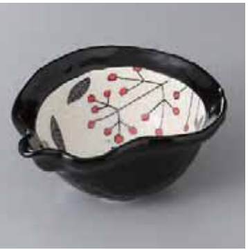
60-12-23G 2,500円 黒織部南天片口ひさご鉢 15.2×11.8×7.1cm