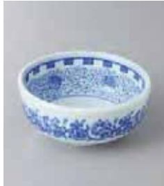
76-21-25G 380円 牡丹唐草3.5ボール 10.4×4.7cm