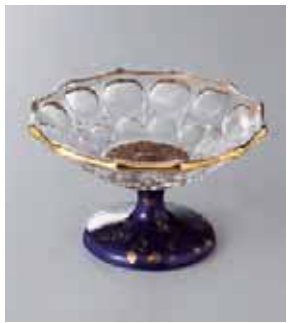
62-1-22G 3,700円 ガラスリリ釉高台鉢 11.8×7cm