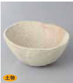
土物 70-3-23G 900円 リプルタラボール(小) 11×5cm