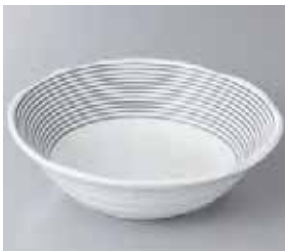
57-7-48G 700円 ドリームライン白オートミル 16×5cm