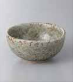
70-28-71G 840円 益子結晶 3.5鉢 11.6×11.4×5.4cm