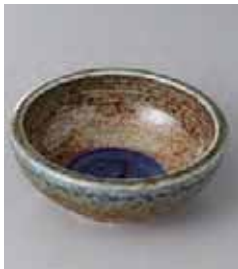
75-29-34G 450円 藍流し青炎括り手 4.0鉢 12.5×5cm