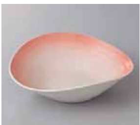
46-29-57G 1,350円 ピンク吹たわみ型向付 16.6×15.1×5cm