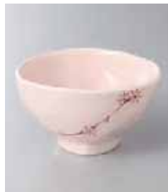
72-35-45G 680円 ピンク小花三角小鉢 11.5×11.5×6.2cm