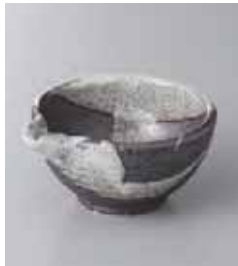
73-13-35G 670円 唐津流し片口鉢(小) 10×9×4.8cm