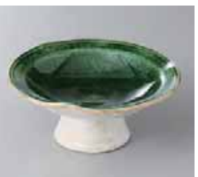
64-24-33G 1,060円 織部タタキ高台皿 12.5×5.5cm