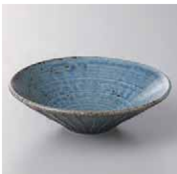
55-10-20G 1,300円 わび 紺ねずしのぎ浅鉢 小 100入 14.5×4cm