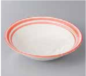
50-8-25G 980円 朱音 5.0 鉢 16.7×4.5cm