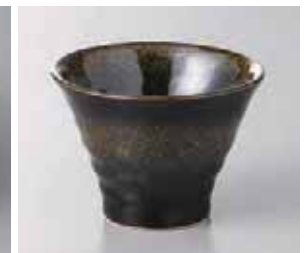
65-30-71G 630円 金彩天目高ハマ小鉢 9.5×7cm