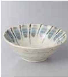
76-2-23G 440円 唐津十草4.0深鉢 13×5cm