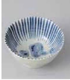
72-9-10G 720円 京野菜八角小鉢 しいたけ 10.9×5.4cm