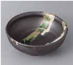
46-14-56G 1,830円 南蛮織部白流5.5ボール 16.5×6.5cm