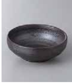
77-10-31G 340円 いぶし 3.5ポール 10.7×3.7cm