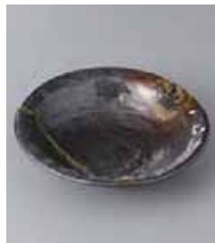
74-2-31G 630円 南蛮吹流し石目 3.3鉢 11×3.2cm