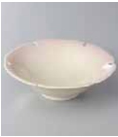
67-26-77G 1,230円 柄抜紫吹松花堂 12×3.5cm