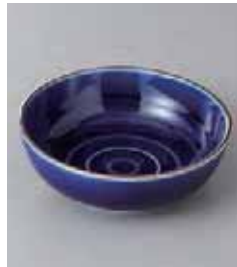
71-24-33G 770円 測金ルリ 3.8ボール 11.3×3.8cm