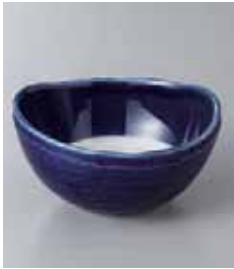
67-3-77G 1,380円 マルチ白抜(ルリ)小鉢 11×10.5×6cm