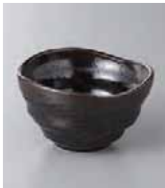
77-26-2G 300円 黒釉三ツ山小鉢 10×6cm