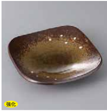
強化 42-17-77G 2,400円 金彩むさしの向付 15.5×15.5×3.5cm