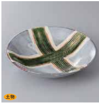
土物 42-9-3G 2,500円 糸巻5.0鉢 17×3.7cm