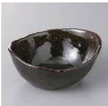
55-6-71G 1,300円 金彩天目楕円深鉢(中) 16×13.5×7cm