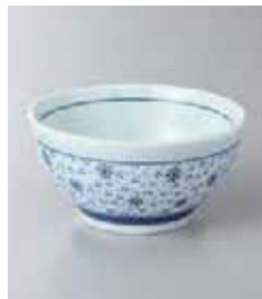
76-35-43G 350円 花ちらし小鉢 11×5.5cm