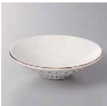
55-8-20G 1,300円 錆粉引しのぎ浅鉢(小) 100入 14.5×4cm