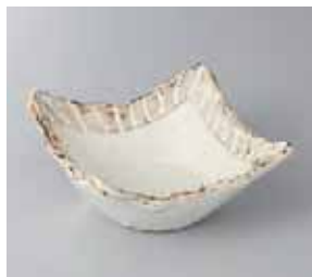
49-26-22G 1,050円 粉引ライン角小鉢 13.5×13×6.2cm