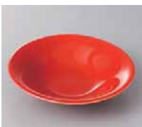
49-15-5G 1,100円 朱朱向付 16.2×3.6cm