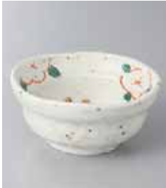
72-19-71G 710円 白イロボ赤絵花 3.6小鉢 11×5cm