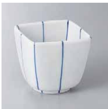
60-13-23G 2,500円 紺筋角小鉢 7.9×7.9×7.1cm