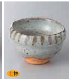
土物 66-5-45G 1,650円 唐津四方くくり小鉢(手造) 9.5×9.5×6cm