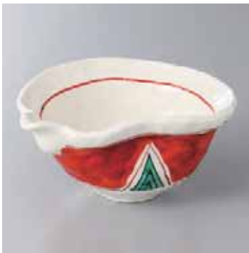
59-19-2G 2,800円 赤絵片口鉢 15×7.5cm