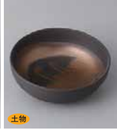
土物 72-18-61G 700円 金流し小鉢 80入 12×4cm