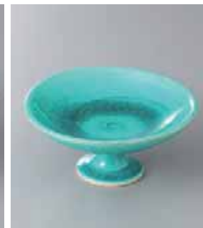
62-9-52G 2,780円 緑彩釉4.0高台皿 12×5.5cm