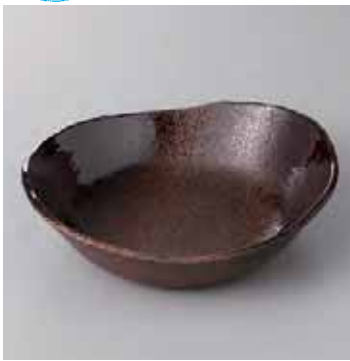
44-3-77G 2,160円 備前灰釉向付 18×16×5cm