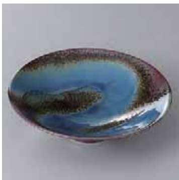
41-4-93G 2,600円 有田焼 南蛮ルリ流し平小鉢 5入 16×4.5cm