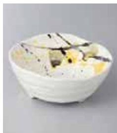
71-35-21G 740円 薄墨ろくべい取鉢 12.3×5.3cm