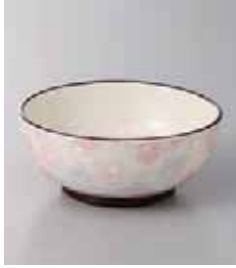
71-8-77G 800円 盛りざしこピンク・紫丸小鉢 10.2×4.5cm