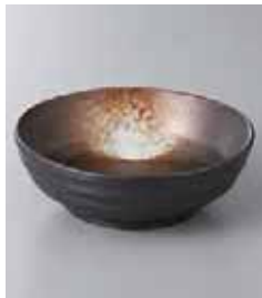
76-27-22G 370円 黒伊賀白吹4寸取鉢 13×4.7cm