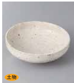
土物 66-2-2G 1,800円 粉引サビ散らし取り小鉢 13×4cm