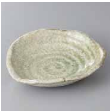
45-2-53G 2,100円 緑釉カイラギなぶり手向付 18×16×4.3cm