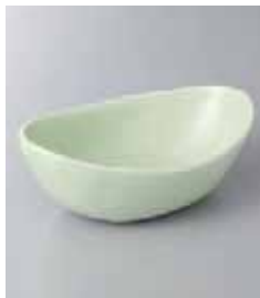
79-34-33G 950円 ミント舟形小鉢 15.5×9.5×5cm