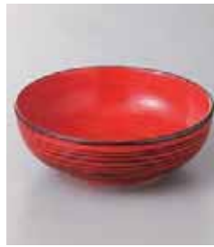
67-29-20G 1,200円 根来千段4.0ボール 80入 13×4.5cm