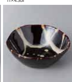
68-21-71G 1,100円 天目うのふ散し4.0小鉢 13×4.3cm