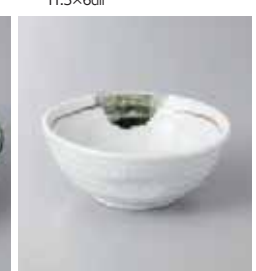
74-36-79G 540円 志野茶ライン玉割 10.7×4.5cm