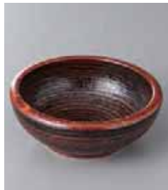
75-26-77G 470円 黒龍くくり手 4寸深鉢 12.7×4.5cm