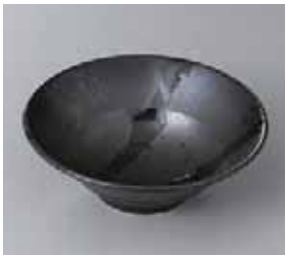
50-18-21G 850円 漆黒輪二重 5.5 深鉢 16×5.5cm