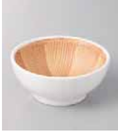
73-8-77G 730円 白すり鉢(小) 10.5×1.5cm