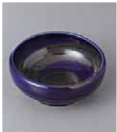
74-1-25G 630円 銀彩ブルー 3.3小鉢 10.5×5cm