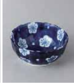
77-18-32G 320円 福々梅菊型 3.0小鉢 140入 9×4.1cm