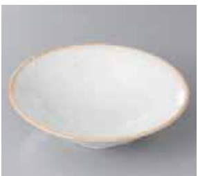
51-3-34G 680円 桜流し5.5平鉢 17.5×5cm