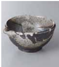
69-27-35G 930円 唐津流し片口鉢(中) 13×11.5×6cm