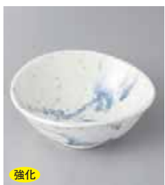
強化 78-7-52G 2,050円 吹染精円小鉢 14×13×5.5cm