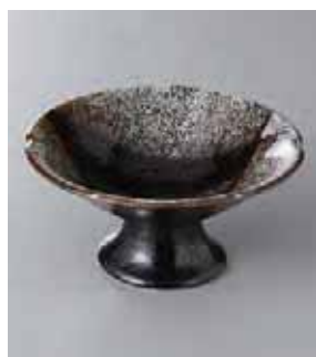
63-25-77G 1,780円 かいらぎ高台小鉢 13×6.5cm