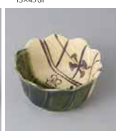
74-33-27G 550円 織部梅ネジリ小付 10×10×4.8cm