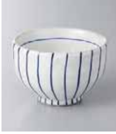
67-9-2G 1,350円 粉引十草姫小鉢 10×7cm