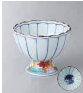
62-12-23G 2,700円 菊割春秋高台3.6小鉢 9.4×7.5cm