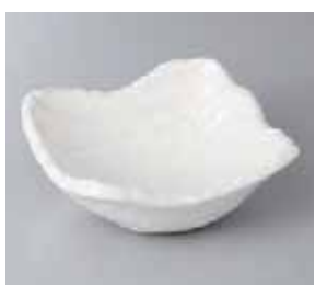
56-26-56G 880円 白釉荒ソギ小鉢 14.2×13.9×5.8cm