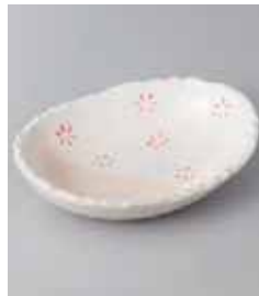
79-29-77G 990円 粉引小紋楕円 5.0 鉢 15×11.3×3.3cm