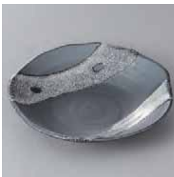
45-8-22G 2,050円 天目白流 6.0深皿 18.8×18×3.3cm