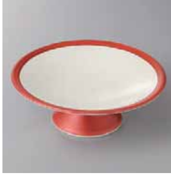
42-5-22G 2,500円 赤銀彩高台向付 16.5×5.7cm