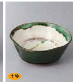
土物 78-6-2G 2,000円 織部花小鉢 13×12.8×5.7cm