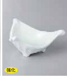
強化 79-18-52G 1,050円 青白磁ちぎり三角小鉢 14×12×7cm