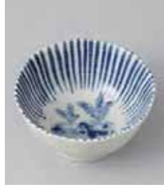
72-11-10G 720円 京野菜八角小鉢 かぶら 10.9×5.4cm