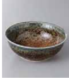
76-17-23G 380円 砂地藍流し4.0深口ボール 13.3×4.8cm