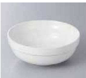
57-32-78G 250円 白釉スタック小鉢 12.5×4.5cm