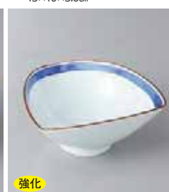
強化 78-16-52G 1,700円 染付線三方小鉢 11.5×11×5cm