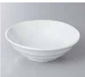
57-24-48G 400円 鳴門白煮物鉢 16.7×5.2cm