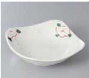
57-8-71G 670円 雪粉引赤絵花5.0角皿 14×14×4cm