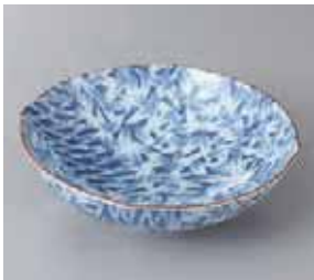
50-25-22G 750円 内外京笹絵 5.0 向付 15×4.5cm