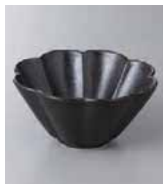
73-35-8G 630円 菊花小鉢油滴天目 13×6.3cm