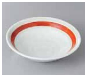
51-1-2G 700円 朱帯5.0鉢 16.7×4.5cm