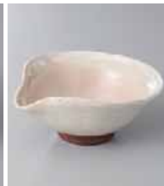
66-4-53G 1,800円 粉引片口小鉢 14.2×12.5×6cm