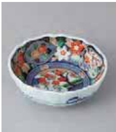
72-25-34G 700円 若紫 3.5小鉢 11.2×3.8cm