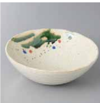
53-8-77G 1,940円 野の花丸盛鉢中 15.5×5.5cm