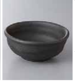
67-18-77G 1,300円 備前変形小鉢 12.4×12×5cm