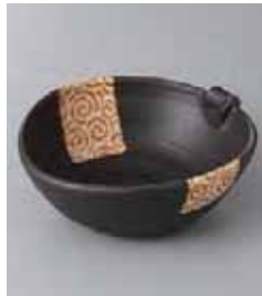
71-17-34G 780円 うず唐草耳付小鉢(黒)