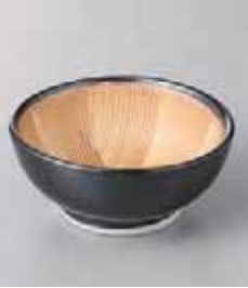
73-9-77G 730円 黒すり鉢(小) 10.5×4.5cm