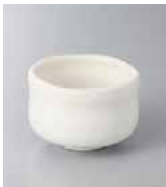
75-11-43G 500円 白志野はんわり碗 9.3×6.4cm