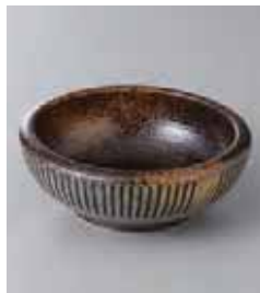
75-14-25G 500円 民芸十草括り手 4.0鉢 12.9×4.7cm