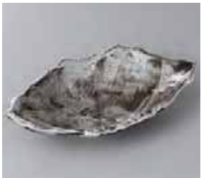
46-21-41G 1,800円 かいらぎちぎり中鉢 23.8×14.5×4cm