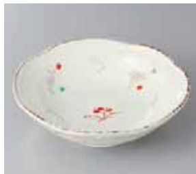
51-6-36G 650円 粉引赤絵唐草5.5浅鉢 17×4.7cm