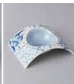
78-10-2G 1,850円 染付藍花反小鉢 13×10×3.6cm