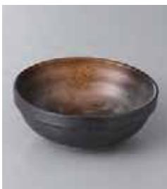
75-6-37G 500円 金茶吹きスタッツ小鉢 11.8×4.5cm