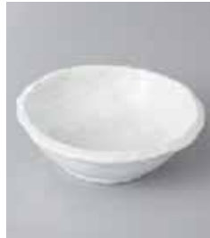
73-5-33G 680円 白河濃丸小鉢 12.3×4cm