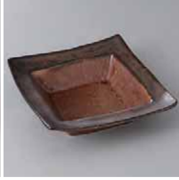
44-8-71G 2,050円 鮎平鉢 16.7×16.7×4.6cm