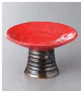
63-3-77G 2,010円 高台赤丸4寸皿 13.5×8.2cm