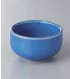
77-20-48G 300円 青釉ナマコ小鉢 9.2×5.2cm