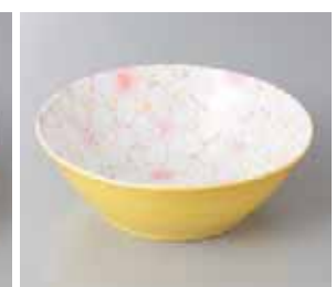
56-30-2G 850円 黄吹さくら 14.5cmボール ピンク 14.6×5cm