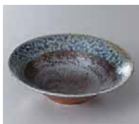
57-11-43G 650円 民芸藍流し5.0平鉢 16×4.6cm