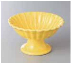
64-12-23G 1,300円 菊形高台小鉢黄 11.2×6.2cm