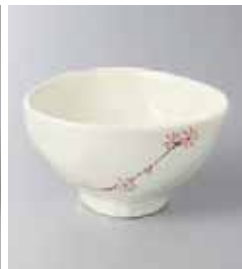
72-36-45G 680円 イエロー小花三角小鉢 120入 11.5×11.5×6.3cm