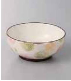
71-7-77G 800円 ぼかし水玉赤・グリーン・黄丸小鉢 10.2×4.5cm