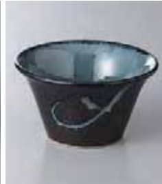
69-24-71G 950円 黒潮3.6反小鉢 11.3×6.2cm