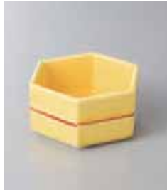
79-22-73G 1,060円 黄釉サビ筋六角小鉢 9×7.8×4.4cm