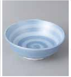
67-24-52G 1,230円 銀彩コバルト巻丸小鉢 11×4cm