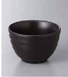
77-15-48G 320円 梨地天目切立小鉢 10.5×6.7cm