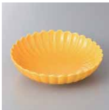
43-5-52G 2,300円 黄釉菊型鉢 16.5×4cm