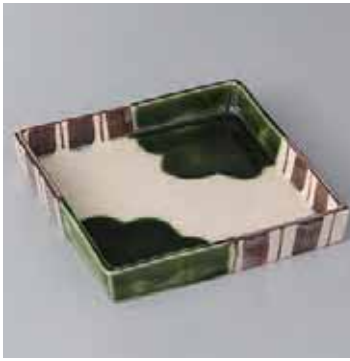
44-19-5G 2,130円 瀏織部四方向付 15×15×2.5cm