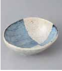
70-27-33G 840円 モダングレー三角小鉢 12×10.2×4.2cm