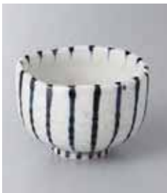
67-33-6G 1,180円 ゴス十草丸小鉢 9.8×6.4cm