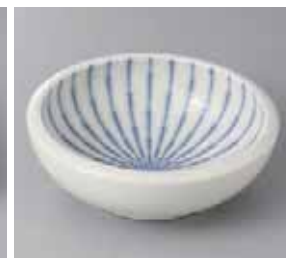
56-14-21G 980円 フォーカス 白くくり手 5.5 鉢 17.7×5.5cm