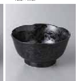
74-30-43G 550円 銀彩天目 3.6小鉢 11.5×6cm