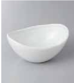
79-20-33G 1,200円 乳白ライン楕円小鉢 14.3×11.2×7cm