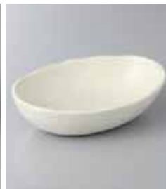
79-36-60G 930円 粉引夕月小鉢 16×10.8×4.3cm