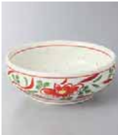
73-16-33G 660円 赤絵花4.0ボール 13×4.7cm