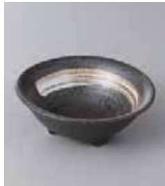
75-32-21G 450円 白刷毛天目三つ足ミニ小鉢 9.3×3.4cm