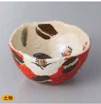
土物 60-3-71G 2,750円 赤濃山茶花小鉢 12.5×6.5cm