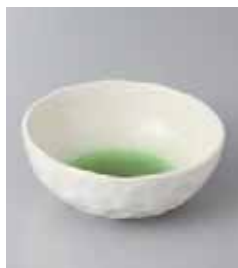
75-2-32G 530円 うのふエメラルドグリーン亀甲ボール 11.8×4.6cm