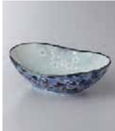
79-21-93G 1,200円 有田焼 花ごころ小鉢 5入 14.6×12×5cm