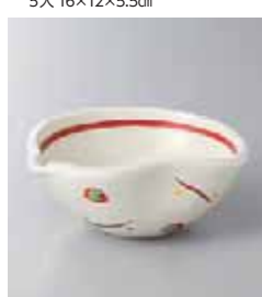
78-20-2G 1,600円 粉引赤絵なごみ小鉢 12.5×10.5×4.8cm