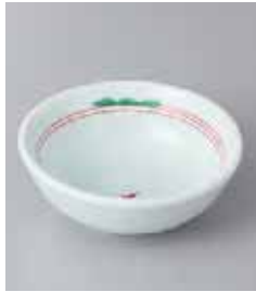
76-3-33G 440円 錦水玉丸小付 10.1×3.5cm