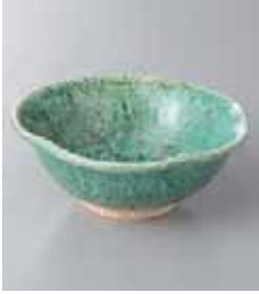
70-20-71G 860円 緑釉花型 4.0小鉢 12×4.7cm