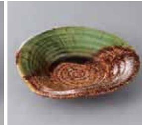
47-24-56G 1,580円 ア×唐津織部流5.5浅鉢 18×17.5×3.7cm