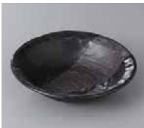
50-28-52G 750円 夜宙石目 5.0 鉢 16.5×4.1cm