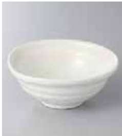
73-20-5G 650円 ゆず白4.5鉢 13.5×13.3×5.5cm