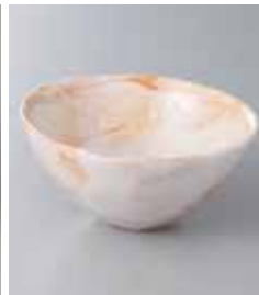
69-30-31G 920円 赤志野円錐鉢(小) 12.3×6cm