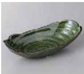
49-2-57G 1,280円 織部三ツ足楕円向付 19.6×9×5.2cm