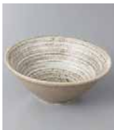
71-33-25G 750円 風の舞リップル 4.5深鉢 14×5.6cm