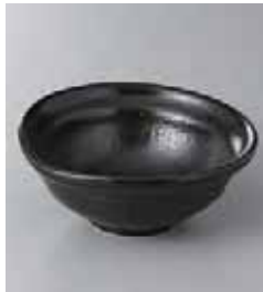
73-19-5G 650円 ゆず黒4.5鉢 13.5×13.3×5.5cm