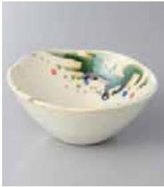
69-1-77G 1,170円 野の花丸盛鉢 小 12.8×5.5cm