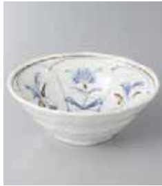
76-4-23G 440円 草花白結晶4.0小鉢 13×5cm