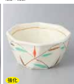
強化 66-15-77G 1,730円 金彩あし八角小鉢(中) 10×4.9cm