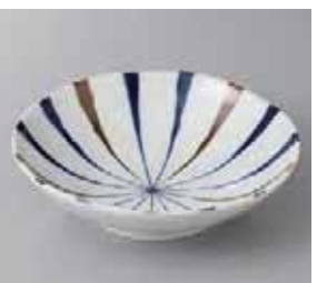
51-25-34G 420円 藍十草5.5浅鉢 17×4.8cm