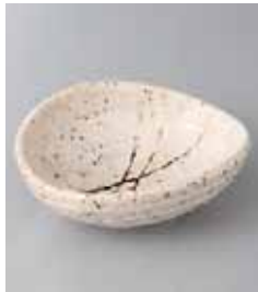
71-21-45G 780円 アマ乱うず取鉢 14.5×12×5cm