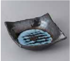
50-6-36G 1,000円 いずみ四ツ足煮物鉢 15.5×15.5×5.5cm