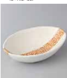
80-26-37-45G 850円 うす唐草(白)アーモンド鉢(小) 16.5×10.2×4cm