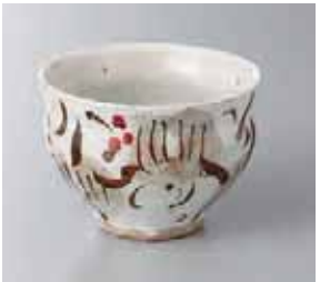
64-8-52G 1,950円 錆山帰来茶漬碗 11×7.8cm