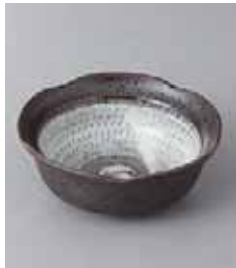
71-15-6G 750円 トチリ梅型 3.0鉢 9.8×3.9cm