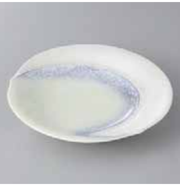
42-11-35G 2,450円 パープル吹ラスター勾玉平鉢(中) 16.7×16×4cm