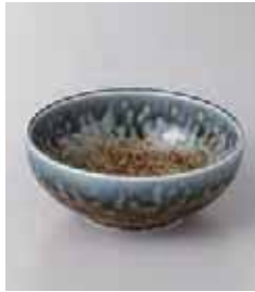
77-4-26G 350円 砂地藍流し 3.5ポール 10.7×4cm