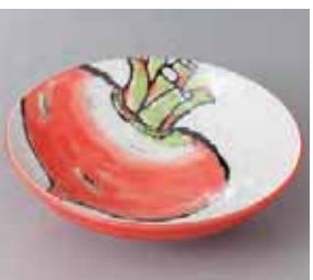
51-19-8G 500円 京野菜カブ55鉢 18×5cm