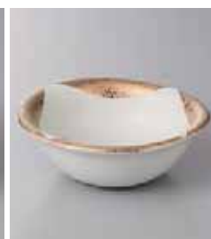
66-10-10G 1,650円 ゴールドスクエアつば付丸4.0鉢 13.5×4.6cm