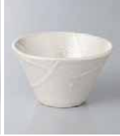
69-12-73G 990円 ラスター彩3.0反小鉢 8.5×5cm