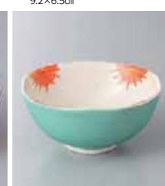
66-24-71G 1,500円 緑巻フリル小鉢 10.5×4.5cm