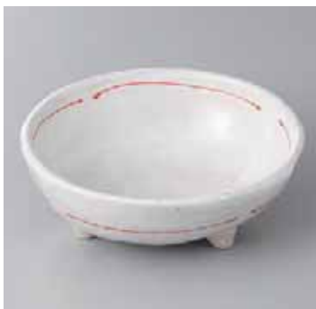
55-2-71G 1,400円 粉引結び糸三ツ足5.0小鉢 15.3×13.2×5.5cm