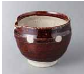
65-12-56G 1,930円 あめ水玉丸片口スリ小鉢 10×9.5×8.2cm