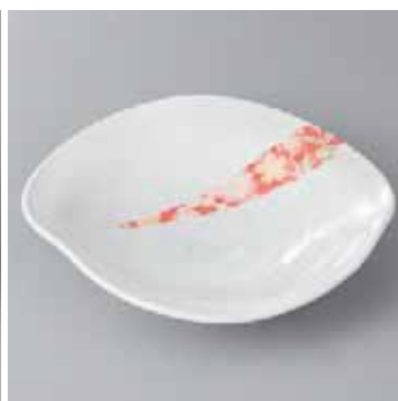
44-16-77G 2,150円 赤華友禅変形6寸皿 18.5×18×4.1cm