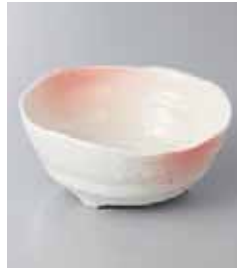
71-6-48-43G 800円 桜吹六兵衛小鉢 12.5×5cm