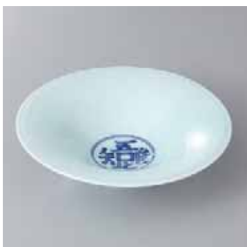
41-18-52G 2,550円 染付漢詩見込5.0反鉢 15.8×4.3cm