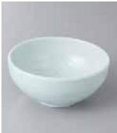
71-19-71G 780円 うす青磁彫丸鉢 12×5.2cm