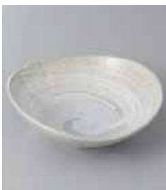
71-34-56G 740円 青地刷毛中鉢 14.5×14.5×5.3cm