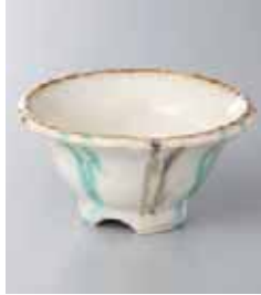
69-15-56G 980円 うのふ二色流丸小鉢 10.5×5.5cm