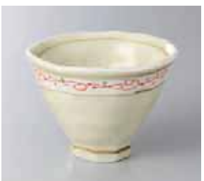
64-23-51G 1,150円 一珍ゆず変形小鉢 10.8×8cm