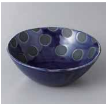
55-7-1G 1,300円 レインブルー深鉢 小 14.8×5.7cm