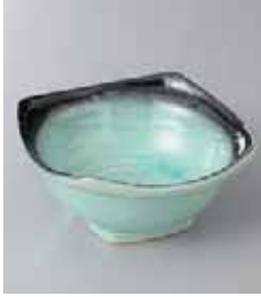
72-7-77G 730円 淵黒青磁小鉢 11.3×11.3×5.2cm