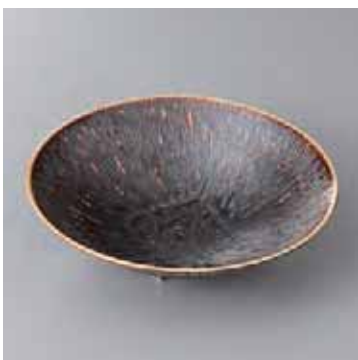
43-7-27G 2,300円 白土孔雀とちり丸皿 17.5×4.7cm