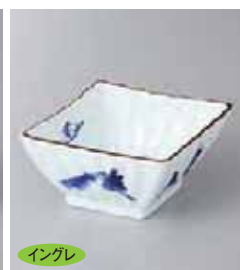
イングレ 78-9-5G 1,880円 染付山水菱型小鉢 14.3×11.2×5.6cm