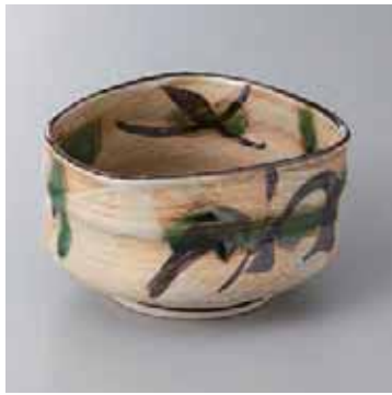
60-9-2G 2,550円 黄瀬戸風オリベ流小鉢 10.5×6cm