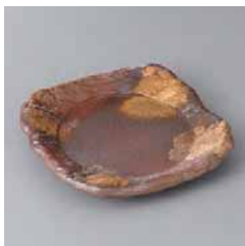
43-13-52G 2,250円 備前風金彩石タキ正角皿 16×16×2.5cm