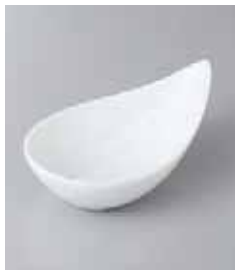
80-15-2G 830円 白色小鉢 14×8.4×5.4cm