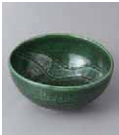
71-20-71G 780円 織部彫丸鉢 12×5.2cm