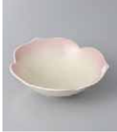
79-15-77G 1,100円 三葉紫吹松花堂 12×4cm