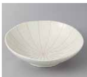
51-11-57G 550円 粉引十草5.5浅鉢 17×5cm