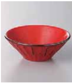
67-27-20G 1,200円 根来しのぎ深鉢(小) 180入 9.5×3.6cm