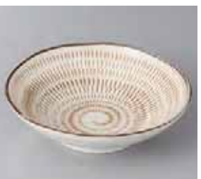
51-20-34G 420円 飛び鉦六兵衛5.5浅鉢 17×4.9cm