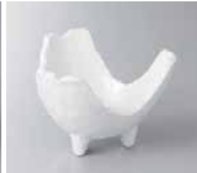
47-22-22G 1,600円 白釉割山椒小鉢 13.5×13×8.6cm