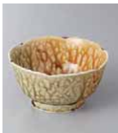
75-3-21G 520円 彩アメ織部 3.6小鉢 11.3×6cm