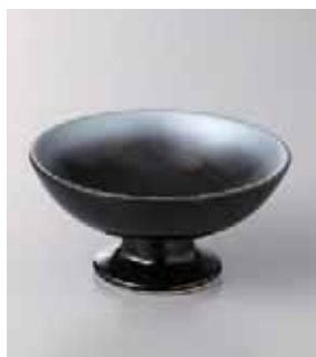
63-6-77G 1,760円 銀彩黒高台小鉢 11.5×5.7cm