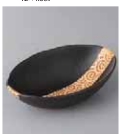
80-25-37-45G 850円 うす唐草(黒)アーモンド鉢(小) 16.5×10.2×4cm