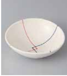
69-8-71G 1,000円 結び一珍小鉢 13.8×13×4.2cm