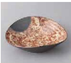
46-30-57G 1,350円 信楽織部たわみ型向付 16.6×15.1×5cm