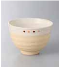
77-2-36G 370円 ショコラドットポール クリーム 11.2×7.8cm