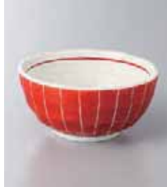
71-11-78G 800円 赤巻色絵 3.0鉢 9.5×4.5cm