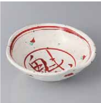
42-14-52G 2,450円 粉引赤画ひねり向付 14.5×14.7×5cm