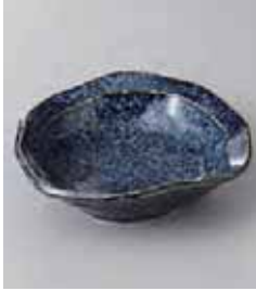
70-31-32G 830円 紺新淡雲変形 4.0深皿 15×14.5×4cm