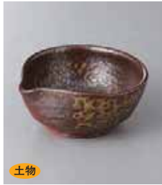
土物 79-4-45G 1,300円 灰吹片口小鉢(手造) 10.5×10×4.8cm