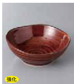
強化 68-8-71G 1,150円 ア×釉小鉢(大) 12.4×12.2×4.5cm