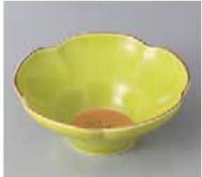
65-6-93G 2,000円 有田焼 五袖金緑花型小鉢 5入 13.5×5.5cm