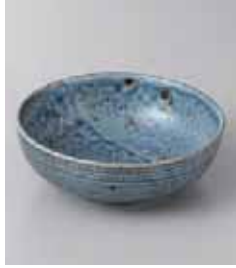
71-9-20G 800円 わび 紺ねず千段 4.0ボール 80入 13×4.5cm