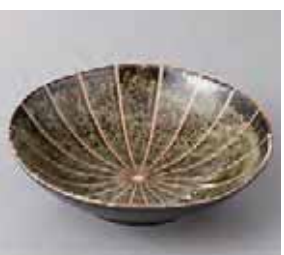
51-14-57G 550円 深緑十草5.5浅鉢 17×5cm