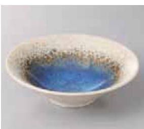
57-15-77G 530円 青水彩輪二重16cm平鉢 16×4.7cm