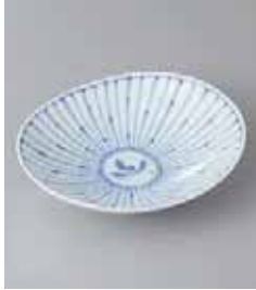
79-14-93G 1,100円 有田焼 十草蘭楕円皿(中) 5入 15.5×13×2cm