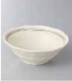
76-13-56G 400円 茶ライン4.0深鉢 12.8×5cm