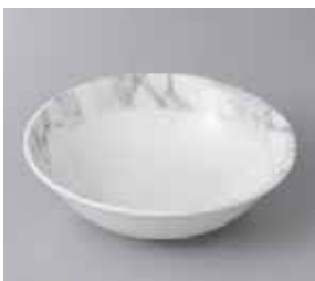
51-2-37G 690円 アラベスカート玉淵オートミル 16.1×4.9cm