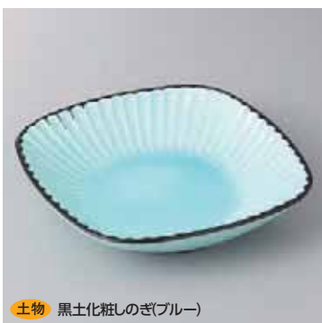
土物 黒土化粧しのぎ(ブルー) 43-21-25G 2,100円 6.5角鉢 19.5×19.5×4.3cm 43-22-25G 1,200円 4.5角鉢 14.3×14.3×4.3cm