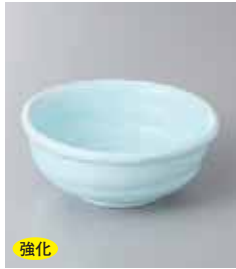
強化 72-3-71G 730円 青白磁たわみ鉢 11×4.4cm