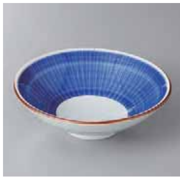
53-9-2G 1,800円 ダミ千筋5.0丸鉢 16.2×5cm