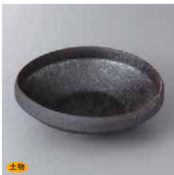
土物 43-12-33G 2,250円 金結晶5.5鉢 17.7×16.2×6cm