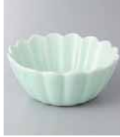
67-17-93G 1,300円 有田焼 青磁 菊型小鉢 5入 12.5×5cm