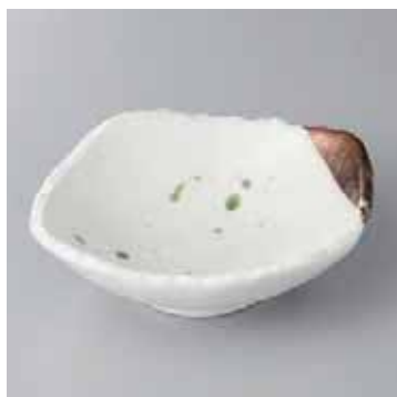
45-9-2G 2,000円 金彩おりべ散らし 5.5平鉢 16.3×14×5cm