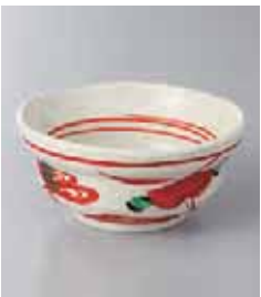
70-4-35G 900円 手描花鳥 3.5鉢 10.9×4.9cm