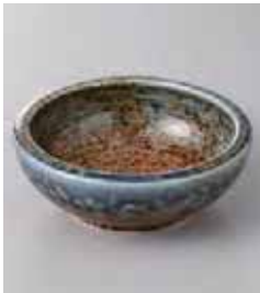
75-24-26G 430円 砂地藍流し括り手 4.0鉢 12.8×4.8cm