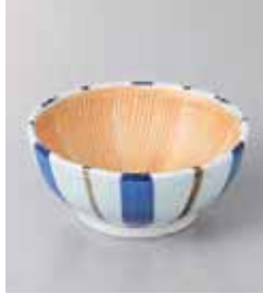
73-7-77G 750円 十草すり鉢(小) 10.5×4.5cm