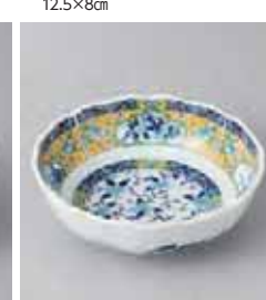
68-30-10G 1,000円 菊濃唐草4.0鉢 13×4.5cm