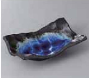
50-10-34G 950円 深海波型取皿 19×12×4.8cm