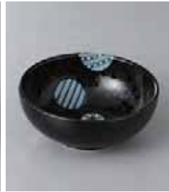
76-6-25G 420円 丸小紋3.5ボール 10.9×4.3cm