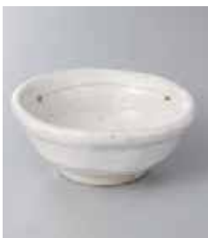
71-31-77G 750円 粉引点彩 3.5小鉢 11.3×4.5cm