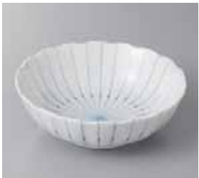
50-16-57G 880円 ピンストライプ 5.0 鉢 16×5.3cm