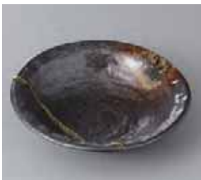
49-30-31G 1,010円 南蛮吹流し石目 5.0鉢 16.8×4.2cm