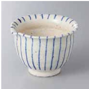
61-5-56G 2,300円 青十草反片口スリ小鉢 11.5×11.5×8.7cm