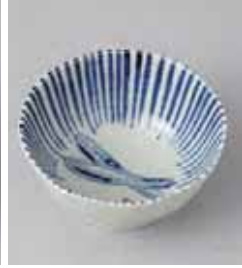
72-12-10G 720円 京野菜八角小鉢 きゅうり 10.9×5.4cm