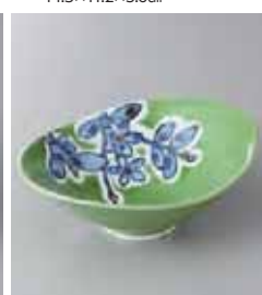
78-15-93G 1,750円 有田焼 緑花精円小鉢 5入 16×12×5.5cm