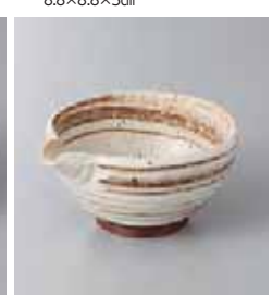
80-36-78G 700円 梨地茶刷毛目3.0片口小鉢 10.3×9×4.8cm