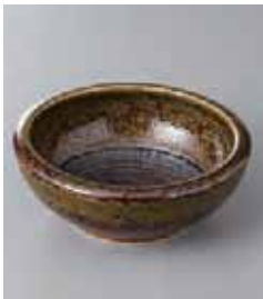
75-30-33G 450円 美濃古道くくり手 4.0鉢 12.7×4.8cm