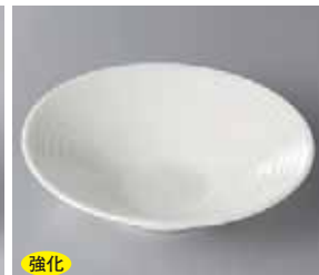
強化 56-3-52G 1,200円 N.Bウェーブ 15cm平鉢 15×3.8cm