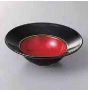
60-4-22G 2,700円 外黒赤うるし風丸小鉢 15.5×5cm