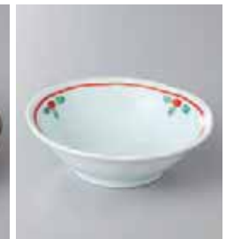
74-18-37G 560円 青地赤絵花 3.3 浅并 11.3×3.6cm