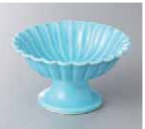
64-14-23G 1,300円 菊形高台小鉢ルコ 11.2×6.2cm