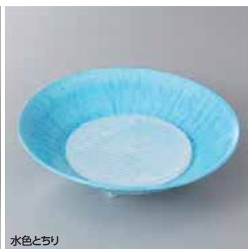
水色とちり 43-19-77G 2,250円 43-20-77G 660円 丸皿(小) 17×4.5cm クールアイス丸φ10 10×1cm