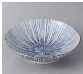
51-21-36G 420円 細十草5.5浅鉢 17×4.9cm