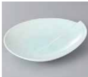
49-6-52G 1,200円 青白磁トシメ向付 20×15.3×3.5cm