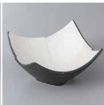
61-19-27G 2,100円 銀サシ入正角小鉢(小) 10.2×10.2×6cm