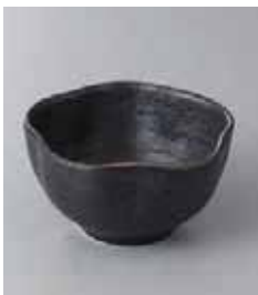
73-28-24G 600円 黒備前梅型小付 10.5×5.6cm