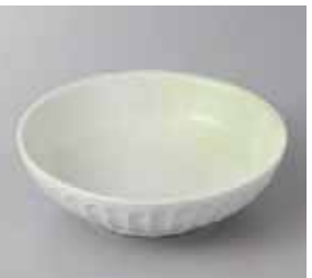
51-10-57G 560円 若草ソギ5.0浅鉢 15.3×4.6cm