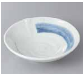
49-24-2G 1,050円 清瀬翔中鉢 17.5×16×5.5cm