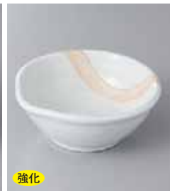
強化 66-3-78G 1,860円 粉引塗分け片口4.0鉢 12.2×11.8×4.8cm