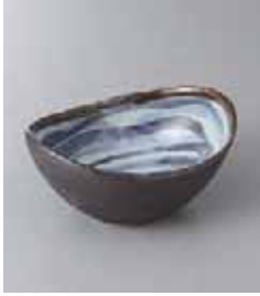
79-7-23G 1,300円 黒潮楕円鉢 14.5×11×7cm