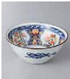
69-33-93G 900円 有田焼 染錦紋様小鉢 5入 13×5.5cm 325cc