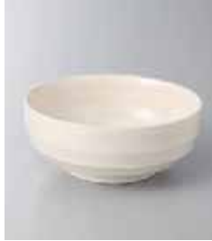
77-16-48G 320円 梨地白釉丸小鉢 11.7×5cm