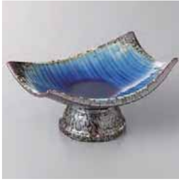
59-8-93G 3,200円 有田焼 南蛮ルリ高台小鉢 5入 14.5×12×7.5cm