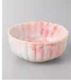
69-17-60G 980円 桜志野菊型小鉢 11.5×11.5×5.5cm