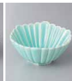
78-12-23G 2,000円 マリンブルー菊彫六角小鉢 13.2×12.6×6cm