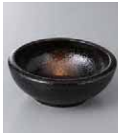
75-25-77G 470円 慶くくり手 4寸深鉢 12.7×4.5cm