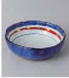
69-9-71G 1,000円 新珠スナック3.3鉄鉢 10×3.4cm