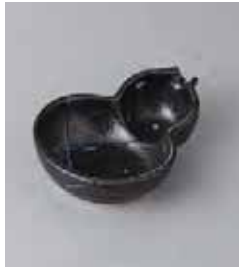
80-7-73G 950円 黒潮瓢型小鉢 13×9.7×3.5cm