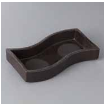
41-10-52G 2,650円 炭化土切立変型向付 19×9.5×3.6cm