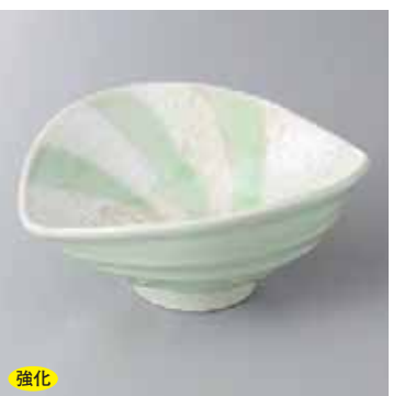
強化 60-16-71G 2,400円 真珠ラスタールヒツ穂スゲ笠小鉢 15.5×12.3×6.3cm