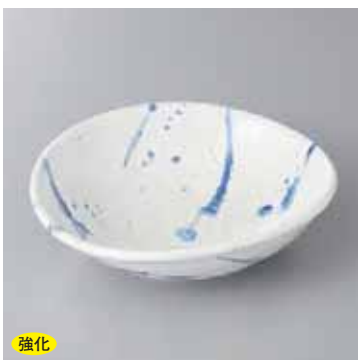
強化 43-11-52G 2,250円 吹染精円向付(小) 16×14.5×4.5cm