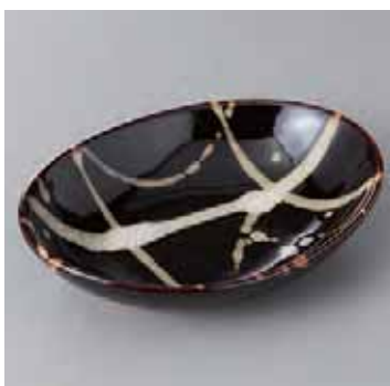
55-20-71G 1,200円 天目うのぶ散しフルーツ鉢 17×12.5×3.7cm