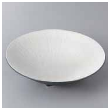
41-1-21G 3,100円 銀ペトリ丸皿(小) 17.1×4.6cm