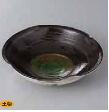
土物 42-8-2G 2,500円 内黒織部四方押し向付 17.5×4.4cm