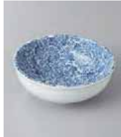
77-23-8G 300円 古典唐草玉淵 33鉢 11×4cm