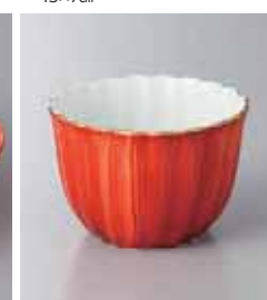
66-18-3G 1,600円 朱ハケ小鉢(大) 9.2×6.5cm