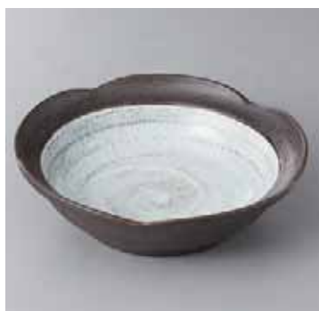
55-13-6G 1,280円 トチリ梅型5.0鉢 17.5×5cm