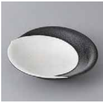
53-14-27G 1,750円 黒結晶ラスター勾玉皿 14.2×4cm