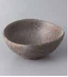
70-30-37G 840円 黒伊賀楕円小鉢 13×11.5×5cm