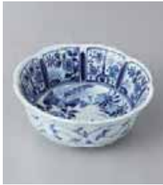
72-2-52G 730円 花鳥雪輪型 3.6小鉢 12×4.5cm