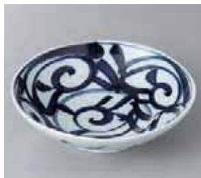
51-26-34-36G 420円 藍草紋5.5浅鉢 17×4.8cm