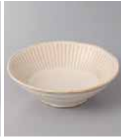
77-6-8G 350円 ハスイト章チタンマット和軽 40鉢 14×4.3cm