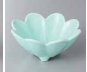
65-10-31G 1,880円 翡翠(強化)菊割小鉢 12.5×5.7cm