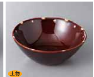
土物 56-5-1G 1,150円 天目小深鉢 小 14.5×5.4cm