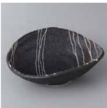
45-15-48G 1,950円 春雷黒精円向付 17.2×13.3×5.5cm