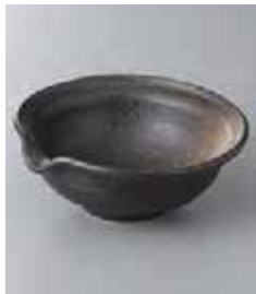
69-28-32G 930円 古代れいめい片口4.0鉢 13.3×5.3cm