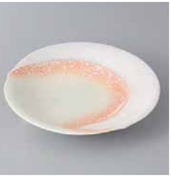
42-12-35G 2,450円 オレンジ吹ラスター勾玉平鉢(中) 16.7×16×4cm