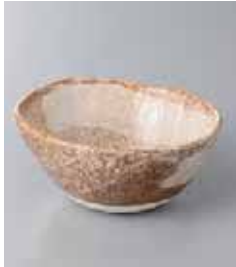
69-20-33G 960円 茶粉引刷毛モエギボール(小) 11.5×5.2cm