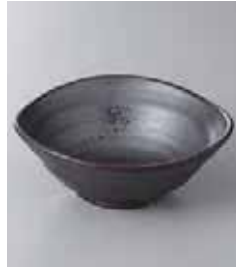
76-23-31-56G 370円 いぶし4.0鉢 12.9×4.7cm