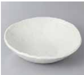
50-12-56G 900円 粉引 6.0 平鉢 17.5×16.5×4.5cm