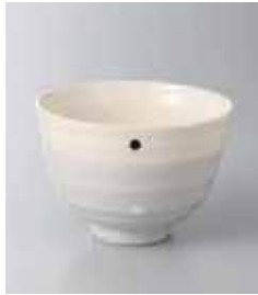
77-3-36G 370円 ショコラドットポール グレー 11.2×7.8cm