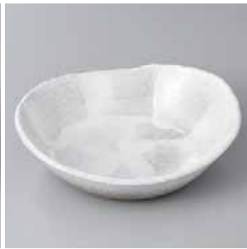
44-4-71G 1,950円 うのふ6.0変型鉢 18.5×16.5×5cm