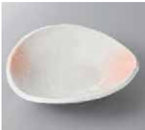
46-20-37G 1,800円 あけぼの志野盛鉢 20.5×18×5cm