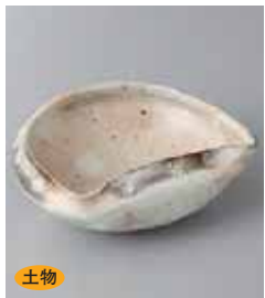
土物 66-1-3G 2,000円 手造粉引貝型小鉢 12.1×10.7×5.8cm

刺身・向付 中鉢・小鉢・組小鉢 高台小付・小付・珍珠 菓子碗・蓋用・円 むし碗・土瓶むし 前菜皿 仕出血・焼物皿 天皿・呑水 組皿・和皿 盛皿・オードブル 大鉢・盛鉢・組鉢 箸受け・箸置き・小物・酒器・箸置き・小皿・灰皿