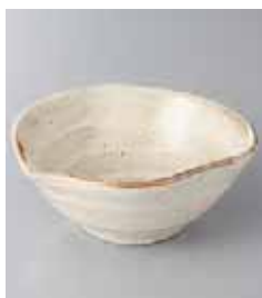
71-27-25G 760円 渦刷毛片口小鉢 13.5×12.5×5cm