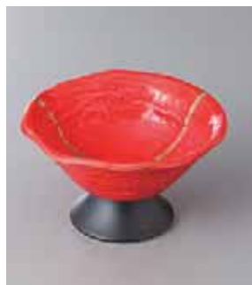
63-4-77G 1,590円 金線赤高台デザート 12×7cm