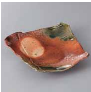
45-11-41G 2,000円 嵯峨野変形前菜皿 17.5×16×5cm