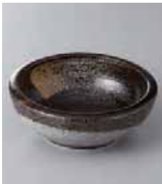
75-28-77G 450円 二色刷毛目くくり手 4寸深鉢 12.8×4.5cm