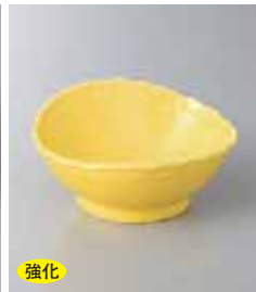
強化 79-30-78G 980円 黄楕円小鉢 11.6×10.3×5.8cm