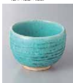
68-14-34G 1,150円 ブルー粉引覗き小鉢 10×7.3cm