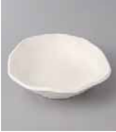
70-32-32G 830円 白変形 4.0深皿 15×14.5×4cm