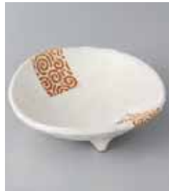
71-18-34G 780円 うず唐草三ツ足小鉢(白)