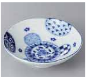
51-23-36G 420円 藍丸紋六兵衛5.5浅鉢 17.8×4.8cm