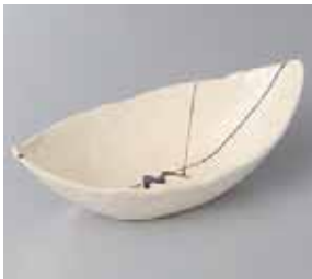
50-17-35G 860円 乱線舟型鉢 20.3×10×7cm