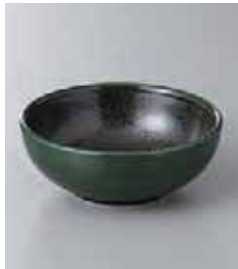
75-33-55G 450円 グリーン志野京風 3.3ボール 10.8×4.2cm