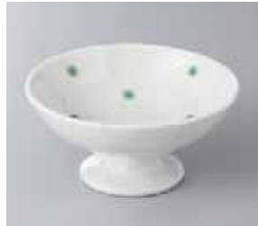
65-2-23G 1,000円 志野グリーンドット高台デザート 11.7×5.8cm