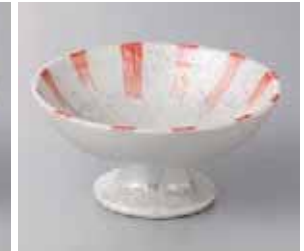
65-5-77G 900円 ピンクラスター十草高台小鉢 11.5×5.7cm