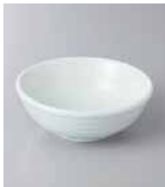
77-31-25G 280円 青白 3.3小鉢 10×3.3cm