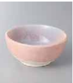
70-6-71G 900円 紅釉 3.5鉢 11.8×5.5cm