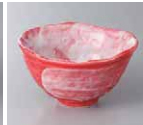
65-24-60G 1,250円 赤彩花手造鉢 13×12.5×7cm