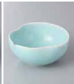
78-4-33G 2,200円 青白磁ひさご小鉢大 10.5×10.2×4.7cm