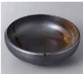
49-29-31G 1,030円 南蛮吹流し 5.5ボール 17×5.6cm