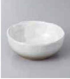
70-19-71G 860円 うのふ 3.5小鉢 11×4cm