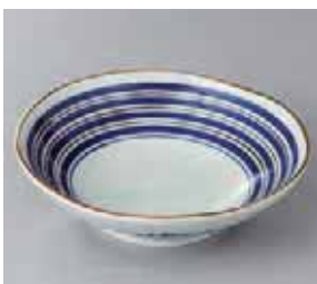
51-22-34G 420円 駒筋六兵衛5.5浅鉢 17×4.9cm