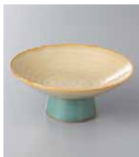
63-15-1G 1,450円 グリーンまこ4.0高台鉢 12.5×5cm