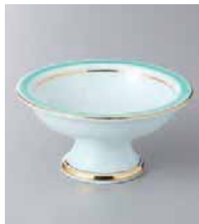
62-7-34G 2,850円 青白グリーン交趾ライン高台丸鉢 11.5×5.7cm