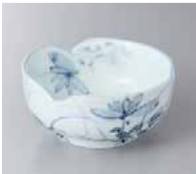
46-22-22G 1,800円 古染菊刺身鉢 14.5×7cm