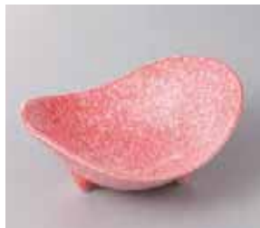
47-11-57G 1,680円 柿釉白吹三ツ足向付 14.6×12.1×5.8cm