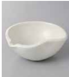
75-20-32G 670円 粉引酒器型 3.5小鉢 12×10×4.3cm