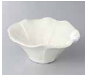
65-22-22G 1,200円 クリーム花型小鉢(大) 12×5.5cm