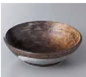
57-12-43G 650円 てびねり新錦5寸鉢 16.7×5.2cm