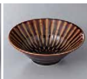
56-28-21G 860円 フォーカス アメ輪二重 5.5 深鉢 16×5.5cm