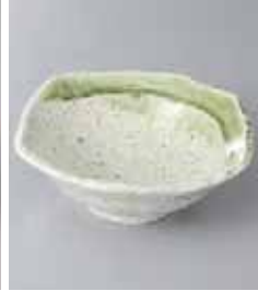
69-18-36G 960円 緑風取鉢 14.2×13.7×4.9cm