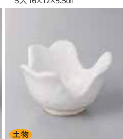
土物 78-21-32G 1,700円 雪志野割山椒小鉢 10.5×6.2cm