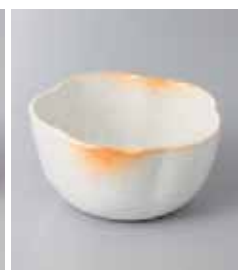
68-10-2G 1,150円 火色志野梅形深小鉢 10.8×5.8cm