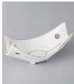
78-2-35G 2,200円 プラチナ透し舟小鉢 15×7.2×6.5cm