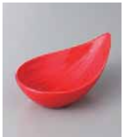
80-13-2G 1,000円 赤色小鉢 14×8.4×5.2cm