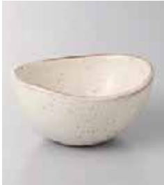
69-19-21G 960円 オルジュ12.5デリカ鉢 12.7×11.5×6.3cm