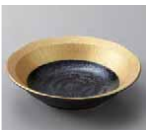
49-14-5G 1,120円 黒潮 5.0浅鉢 16.8×4cm