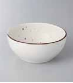
70-23-35G 850円 測錫梨地 3.6深鉢 11.4×5cm