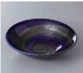
57-10-25G 650円 銀彩ブルー5.0鉢 16.7×4.5cm