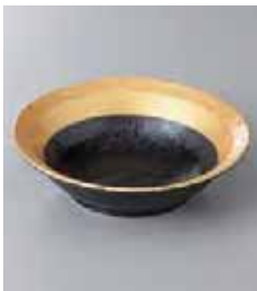
70-1-5G 900円 黒潮フルーツボール 14×3.9cm