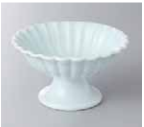
64-13-23G 1,300円 菊形高台小鉢青磁 11.2×6.2cm