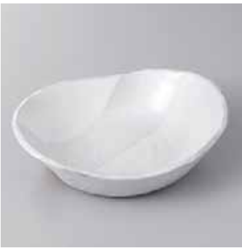
44-2-77G 2,160円 白釉重ね向付 18×16×5cm