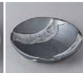
47-5-22G 1,700円 天目白流5.0ボール 15×4cm