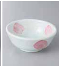
68-3-26G 1,160円 かすりピンク刷毛3.6小鉢 11.8×4.7cm