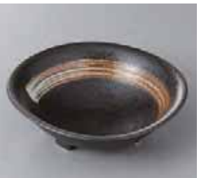
51-9-2G 580円 白刷毛天目三ツ足中鉢 14.5×5cm