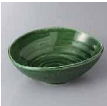
55-12-6G 1,280円 織部壺形中鉢(夕円) 18.5×14.8×6.5cm