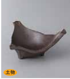
土物 79-8-41G 1,280円 炭化土三角小鉢 14.2×12.7×7cm