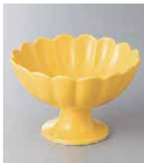
63-2-2G 2,000円 黄菊型高台小鉢 12.5×8cm