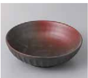
57-13-57G 560円 鉄砂吹ソギ5.0浅鉢 15.3×4.6cm