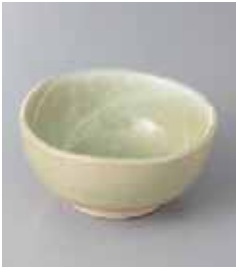
70-8-71G 900円 彩(グリーン)3.5鉢 11.8×5.7cm