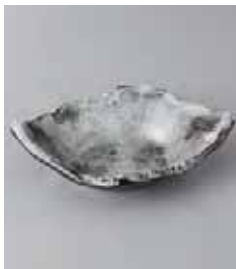
79-32-77G 1,080円 かいざぎ黒ちぎり角小鉢 15.5×11×4cm