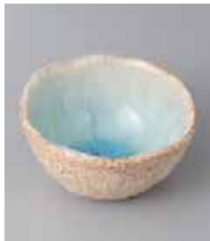
72-28-56G 700円 伊賀清流小鉢 11×5.7cm