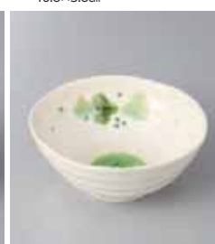
68-16-25G 1,140円 緑彩ぶどう取鉢 13×5.3cm