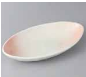
49-28-77G 1,030円 舟型鉢ピンク吹向付 24.3×13.6×4cm