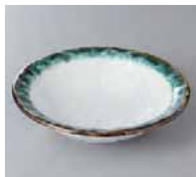
56-12-77G 1,050円 うのぶ織部流し 5.0 寸鉢 16.5×4cm