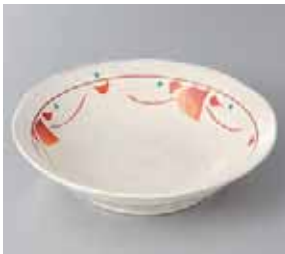
50-22-77G 810円 粉引赤小花 5寸浅鉢 17×4cm