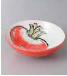
77-8-8G 350円 京野菜カブ 40鉢 13.5×4.5cm