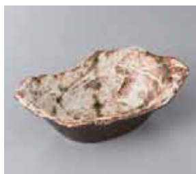
49-16-51G 1,100円 かいらぎ織部吹き舟型鉢 17.2×11.7×5.5cm