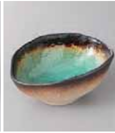
80-10-26G 900円 新海変形ダ円小鉢 14.8×11.5×6cm