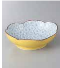
79-6-93G 1,300円 有田焼 黄ざくら 木甲小鉢 5入 15×12×4.5cm