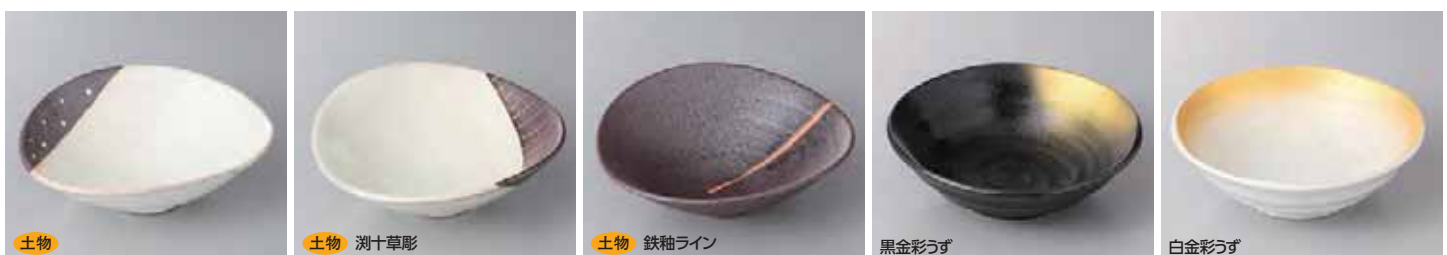
48-26-2G 1,550円 測水玉中鉢 18×16×6cm 48-27-1G 1,300円 変形鉢(中) 18×16×6cm 48-28-1G 850円 変形鉢(小) 15.2×13.2×5.1cm 48-29-1G 1,250円 変形鉢(中) 18×16×6cm 48-30-1G 780円 変形鉢(小) 15.2×13.2×5.1cm 48-31-77G 1,400円 煮物鉢 17cm 16.7×5.2cm 48-32-77G 1,330円 深皿 14cm 14.7×3.8cm 48-33-77G 1,380円 煮物鉢 17cm 16.7×5.2cm 48-34-77G 1,320円 深皿 15cm 14.7×3.8cm