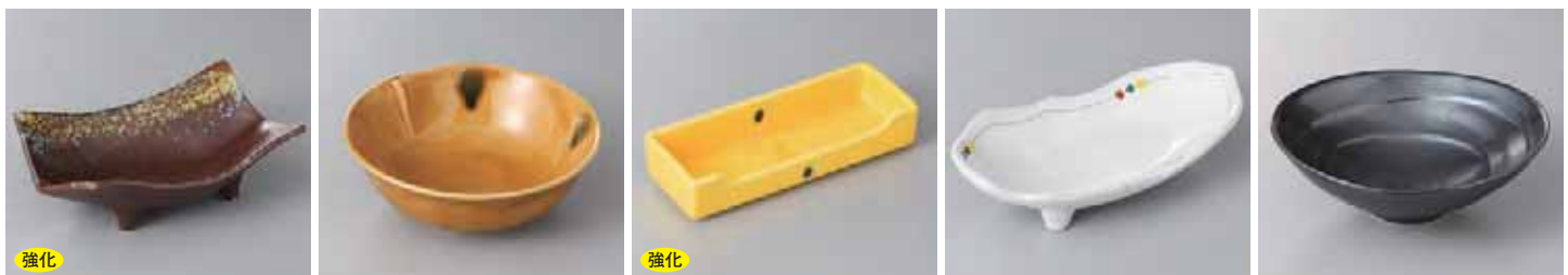
48-16-79G 1,360円 信楽吹向付 17.5×10.5×6cm 48-17-2G 1,350円 黒瀬戸中鉢 15.8×5.5cm 48-18-79G 1,350円 黄輝一品盛 17.5×6.5×3.5cm 48-19-45G 1,350円 点紋三ッ足(中) 18.2×9.8×4.5cm 48-20-26G 1,300円 鉄結晶リップル5.8鉢 17×16×5.8cm