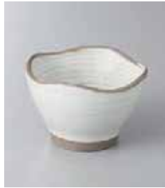
71-5-27G 820円 白刷毛目四ツ山小鉢 9×6cm