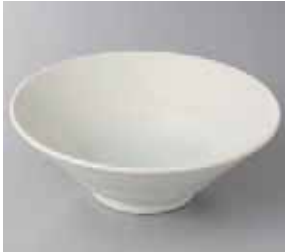
50-7-21G 980円 初水輪二重 6.5 深鉢 20×6.8cm