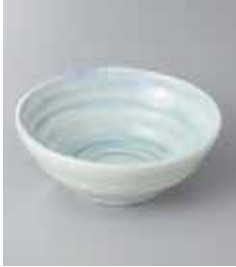
70-13-56G 890円 かれん 4.5鉢 13.7×5cm