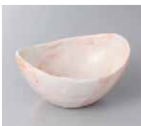
49-12-31G 1,170円 赤志野玉子型鉢(小) 11×14.7×6.8cm