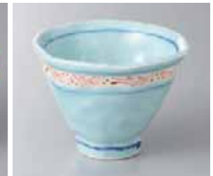
65-25-51G 1,150円 一珍青磁変形小鉢 10.8×8cm