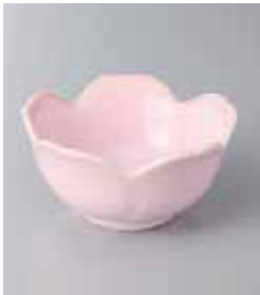
75-36-78G 450円 桜ピンク小鉢 11×5.4cm