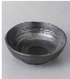
75-19-57G 480円 黒濁小鉢 13.3×4.5cm