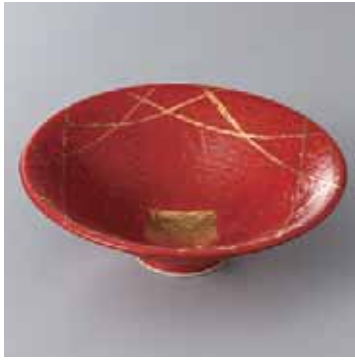
59-4-48G 3,750円 朱巻金彩反小鉢 13.7×4.5cm