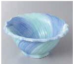
65-16-52G 1,650円 青磁流水彫桔梗型鉢 13.5×6cm