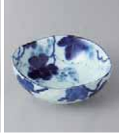
77-12-34G 330円 藍染ぶどう 3.5鉢 10.8×4.5cm