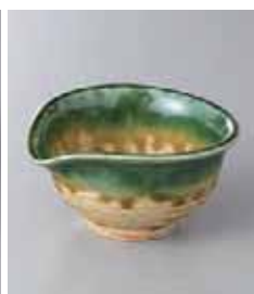
80-22-6G 880円 黄瀬戸織部片口3.0小鉢 9.8×8.5×5cm