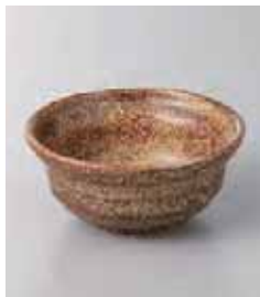
77-33-2G 280円 茶辛子縄文小鉢 10.8×4.6cm