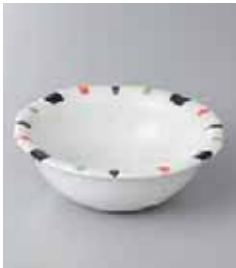
71-13-35G 800円 二色十草フリル4.0小鉢 13.5×4.7cm