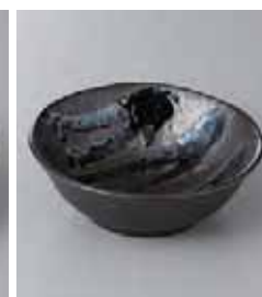
74-23-32G 570円 黒織部流し 4.0鉢 12×4.2cm