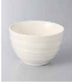
77-14-48G 320円 梨地白釉切立小鉢 10.5×6.7cm