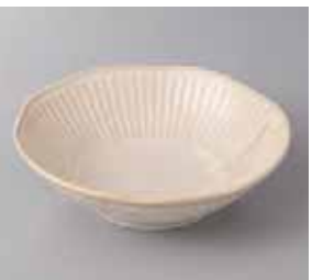
51-29-8G 400円 ハスイ十草チタンマット和軽50鉢 16.5×5cm