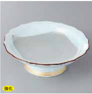
強化 42-10-5G 2,480円 錦銀彩高台皿 15×5.2cm