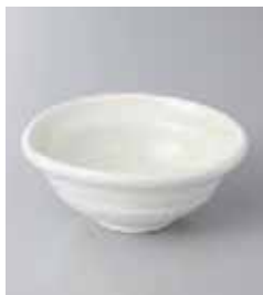
75-9-5G 500円 ゆず白 3.5鉢 11.6×11.1×4.8cm