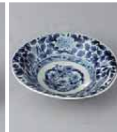
66-6-93G 1,680円 有田焼 濃唐紋小鉢 5入 14.5×4cm