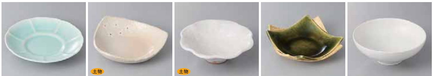
48-11-2G 1,450円 青磁花彫6寸皿 18.7×3.5cm 48-12-73G 1,400円 白押花三角刺身鉢 16.7×16.7×4.5cm 48-13-32G 1,500円 雪志野輪花小鉢(大) 14.5×4.5cm 48-14-37G 1,400円 織部重ね向付 16×16×4.5cm 48-15-21G 1,400円 白モダンローボール 15.2×6cm