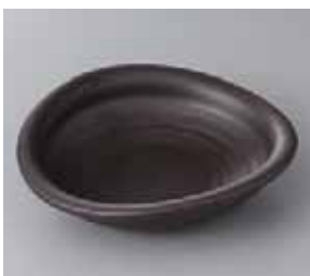
49-20-32G 1,100円 黒マツ袖 5.5たわみ鉢 17.3×15.2×4.8cm