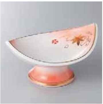
60-2-23G 2,750円 オレンジ吹舟型高台小鉢 16.5×11×6.8cm