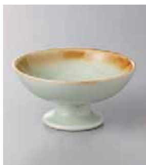
63-17-57G 1,200円 ヒワ貫入高台小鉢 11.8×6cm