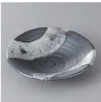
45-7-22G 2,050円 天目白流 5.0平向付 16.5×3.5cm