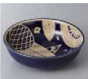
57-14-8G 550円 ルリ刺し子16.5cm中鉢 16.5×5cm