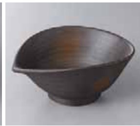
56-8-35G 1,100円 黒伊賀ねじり鉢(大) 15.1×12.6×6.3cm