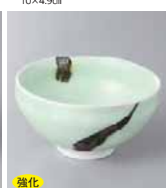
強化 66-21-52G 1,650円 飛び青磁楕円4.0小鉢 11.7×10.5×5.8cm