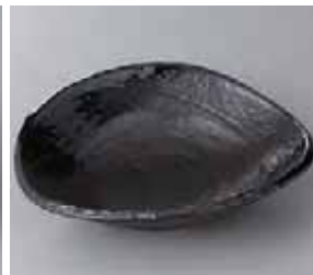
47-7-35G 1,700円 大和6.5扇大鉢 20.8×18.5×5.7cm