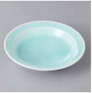
60-20-56G 2,400円 青白磁友禅彫4.0浅鉢 13.5×3cm