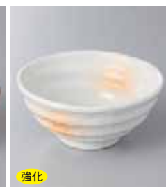
強化 66-11-78G 1,930円 あけぼのろくべい4.3弁 13.9×6cm