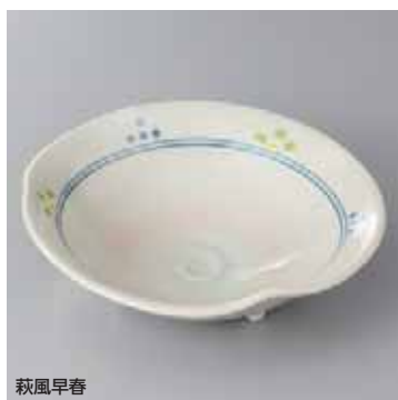
萩風早春 43-17-77G 2,250円 43-18-77G 1,500円 三ツ足6.0浅鉢 18×5cm 三ツ足5.0浅鉢 15×4.5cm