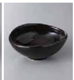
80-24-35G 800円 黄河たまご4.0小鉢 14.2×12×5.8cm