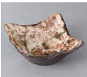
49-17-51G 1,100円 かいらぎ織部吹き角鉢 13.5×6.3cm