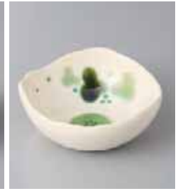
80-12-25G 900円 緑彩ぶどう小鉢 11×4.5cm