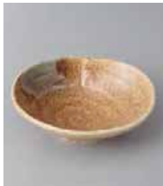
72-27-37G 700円 吹き織部とじめ小鉢 13×4cm