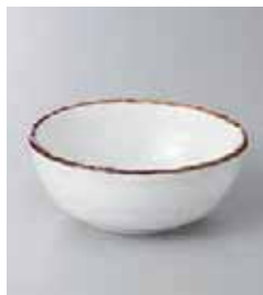
75-8-71G 500円 ソバ志野小鉢 11×4.3cm