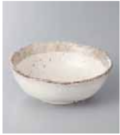
74-7-48G 600円 白唐津丸 3.6小鉢 12.5×12.2×4.6cm