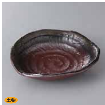
土物 43-6-22G 2,300円 備前なぶり手5.0鉢 17.5×16×4cm