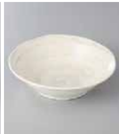
76-30-43G 360円 クラブ粉引4.0鉢 14×4.8cm