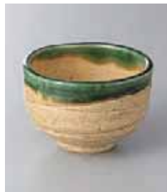
67-35-6G 1,180円 黄瀬戸オリベウズ丸小鉢 9.8×6.4cm