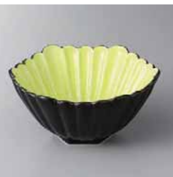
60-15-22G 2,450円 外黒グリーン釉菊彫六角小鉢 13×12.5×6cm