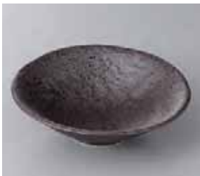
49-9-36G 1,200円 こげ茶水晶向付 15.3×4.5cm