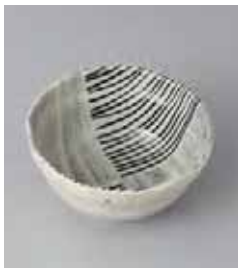
75-17-37G 500円 唐津市松 3.8小鉢 12×5.5cm