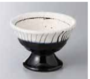
64-20-2G 1,050円 白マット茶十草高台小鉢 10.3×7.5cm