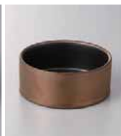
68-9-22G 1,150円 ゴールド内黒マット切立鉢 12×5cm