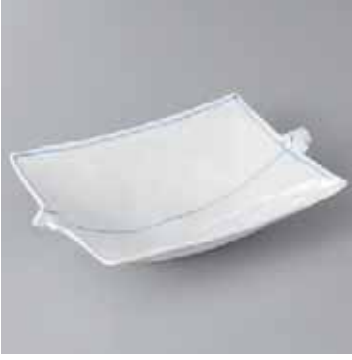
42-6-35G 2,500円 呉須ライン耳付向付 19.3×12.5×4cm