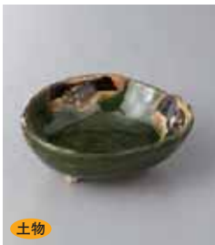
土物 79-31-77G 980円 織部楕三ツ足小鉢 12.2×10.5×4cm