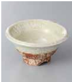
69-26-56G 940円 ヒワイラボ丸小鉢 10.5×5.5cm