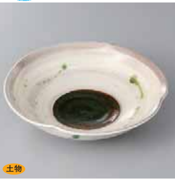
土物 42-3-2G 2,500円 粉引織部散し四方押し向付 18.3×4.6cm