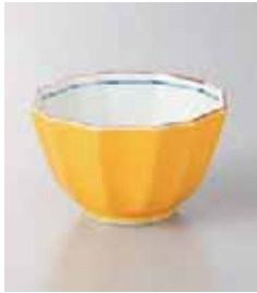
79-2-52G 1,300円 外黄釉 12角小鉢 10×6cm