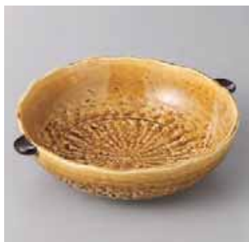
55-9-71G 1,300円 黄瀬戸耳付中鉢 17.5×15.5×4.5cm