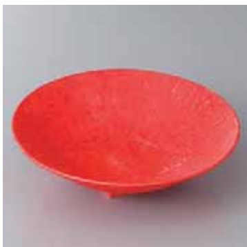
41-2-21G 2,400円 ローズ赤トリ丸皿(小) 17.1×4.6cm