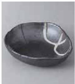
80-1-71G 950円 潮流し変形鉢 15.5×15×4cm