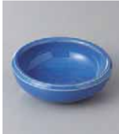
77-19-48G 310円 ナマコ浅鉢 9.6×3cm