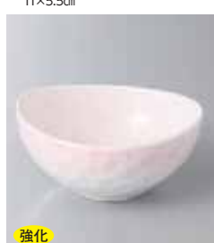
強化 66-20-78G 1,660円 ピンク吹き楕円小鉢 10.8×10.6×5.3cm