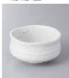
74-26-48G 550円 梨地抹茶型小鉢(大) 9.8×5.5cm