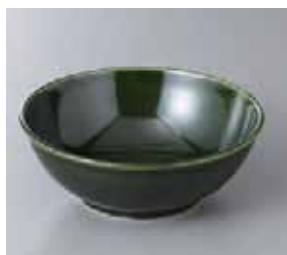
57-21-78G 500円 織部釉ボール 軽量 14×5cm