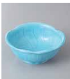
74-19-79G 560円 ブルー梅小鉢 11.5×11.2×4.5cm