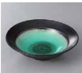
51-17-31G 470円 深海平鉢 16.5×4.5cm