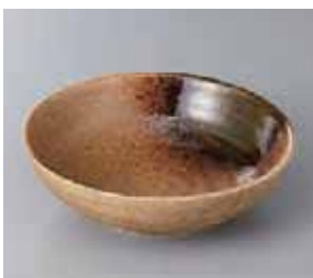
57-17-2G 530円 伊賀おりべ吹4.5ボール 15×4.8cm