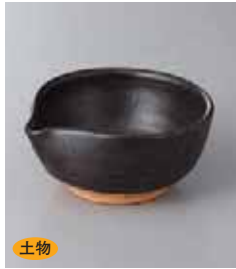
土物 79-3-45G 1,300円 黒釉片口珍珠小付(手造) 10.5×10×4.8cm