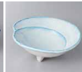
47-15-2G 1,650円 渦潮中鉢 17×6.5cm