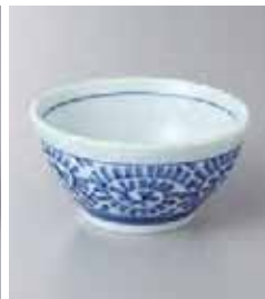
76-36-43G 350円 タコ唐草小鉢 11×5.5cm