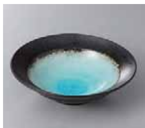
51-16-36G 520円 深海水色平鉢 16.3×4.5cm