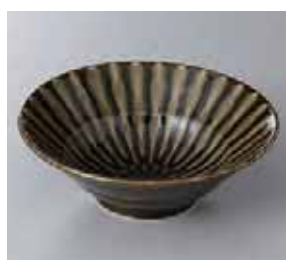
56-27-21G 860円 フォーカス 織部輪二重 5.5 深鉢 16×5.5cm