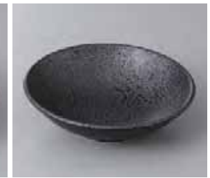
56-10-55G 1,100円 墨おどし 4.5 浅ボール 14×4cm