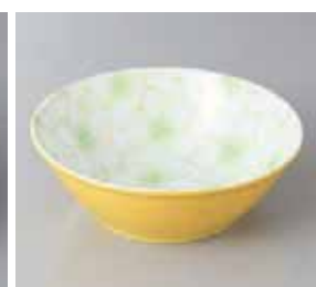
56-29-2G 850円 黄吹さくら 14.5cmボール グリーン 14.6×5cm