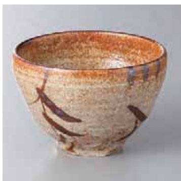
61-17-52G 2,100円 唐津草紋丸鉢 11×7cm