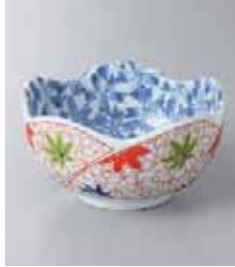
69-16-93G 980円 献上錦春秋小鉢 5入 11×6cm