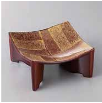
60-17-22G 2,400円 鉛釉金タタキアーチ型小鉢(小) 11.2×11.2×6cm