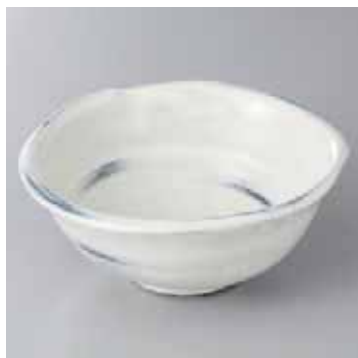
45-1-48G 2,100円 化粧流し向付 16×14×6.5cm