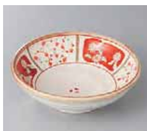
49-11-25G 1,180円 間取赤絵浅鉢 16.7×5cm