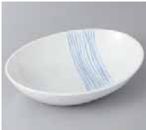
46-7-78G 1,940円 乱れライン楕円鉢 20.5×15×4.6cm