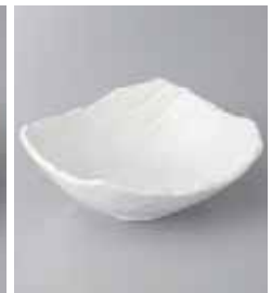
80-6-33G 920円 白釉砂目小鉢 15.5×12.5×5.5cm