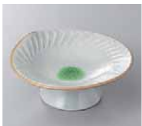
64-21-24G 1,100円 測彫高台皿 14×5.8cm