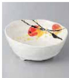
71-36-21G 740円 おげほのろくべい取鉢 12.3×5.3cm