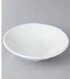
76-15-48G 350円 鳴門白4.5深皿 14.7×3.8cm