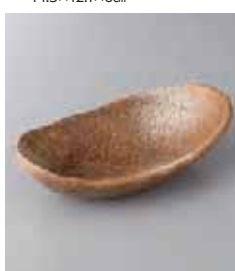
80-27-45G 840円 備前吹舟形鉢(大) 10×18.7×4.5cm