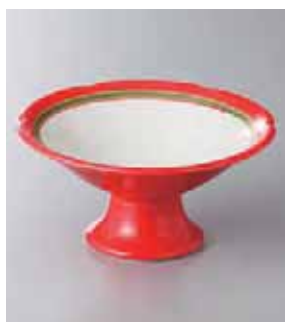
63-22-77G 1,780円 赤釉高台白抜小鉢 13×6.5cm