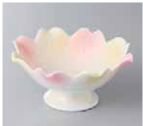
64-1-34G 1,350円 二色吹デザート 12.2×5.5cm