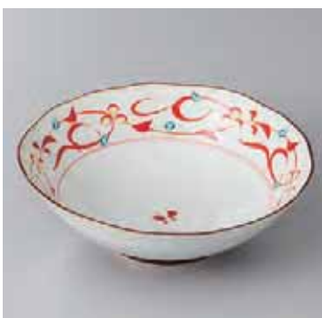
55-19-93G 1,200円 有田焼 赤絵唐草平小鉢 5入 14.5×5cm