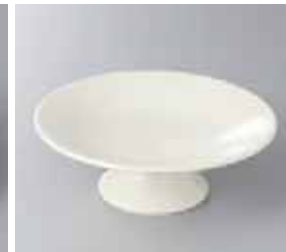
47-19-22G 1,600円 クリーム5.0高台皿 16.5×5.5cm