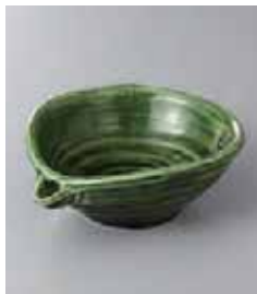
79-33-43G 950円 織部片口穴アキ楕円小鉢 15.5×12.5×5.5cm