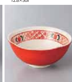
66-23-71G 1,500円 赤巻フリル小鉢 10.5×4.5cm