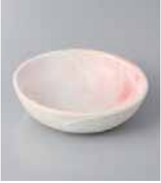
70-22-60G 850円 桜志野丸鉢 11.5×11.2×3.3cm