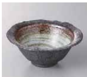
49-21-60G 1,050円 白輪花鉢(大) 15×15×6.5cm