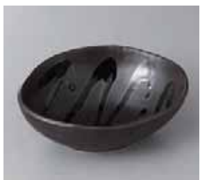
56-16-36G 980円 ひるがの三角中鉢 15.4×13×5cm