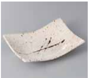
50-11-45G 920円 アメ乱長角取皿(中) 18.3×13×4cm