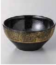
67-15-77G 1,300円 黒内金吹き3.6玉井 13×6.2cm