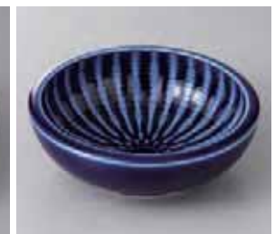
56-15-21G 980円 フォーカス ルリくくり手 5.5 鉢 17.7×5.5cm