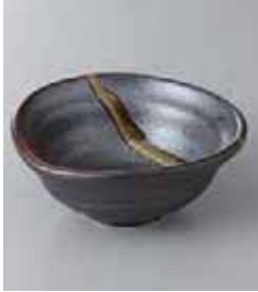
72-13-31G 720円 南蛮吹流しなぶり 3.5小鉢 11.9×11.2×4.8cm