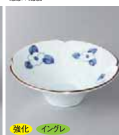
強化 イングレ 66-16-5G 1,570円 椿絵朝顔小鉢 12.5×4.5cm