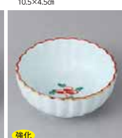
強化 66-29-5G 1,540円 朱金見込花小鉢 10.4×4.5cm