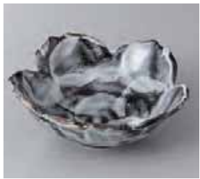
56-6-56G 1,150円 黒しのサクラ鉢 15×15×5.5cm