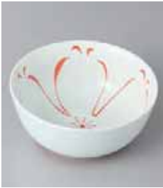
67-2-93G 1,380円 有田焼 花ひらり小鉢 5入 12×5cm