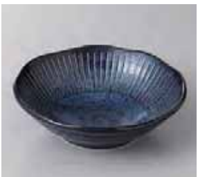
51-28-8G 400円 ハスイ十草海碧和軽50鉢 16.5×5cm