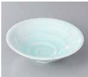
49-7-34G 1,200円 青白磁うず潮向付 15×4.4cm