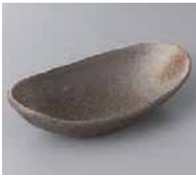
50-20-37G 840円 黒伊賀舟型向付 19×10.5×4.5cm