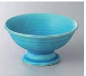
64-15-34G 1,200円 トルコマットデザート 12.5×6.3cm