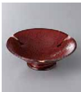
63-11-52G 1,670円 紅袖子天目高台小鉢 13.3×4.4cm