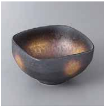
59-13-93G 2,900円 有田焼 黒ゆず結晶金彩四方なぶり小鉢 5入 11.5×11.5×6cm