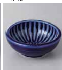
74-27-21G 550円 フォーカス ルリ×くり手 4.0鉢 13×4.7cm