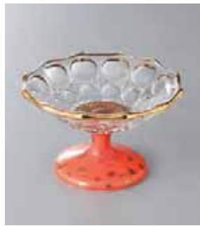
62-2-22G 3,700円 ガラスオレンジ釉高台鉢 11.8×7cm