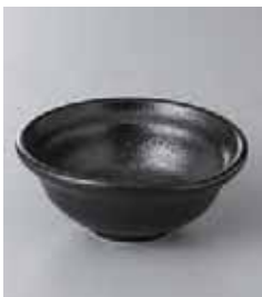
75-10-5G 500円 ゆず黒 3.5鉢 11.6×11.1×4.8cm