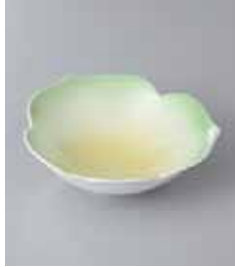
79-16-77G 1,100円 三葉黄ヒツ吹松花堂 12×4cm