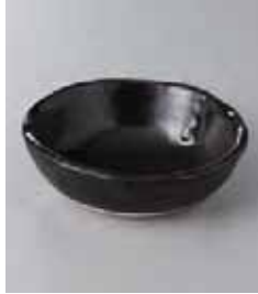
72-16-77G 710円 瀬戸黒タタラ型とんすい 11×3.5cm