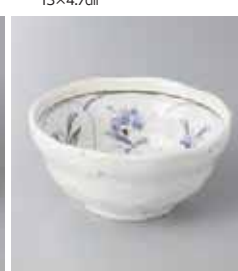
74-34-23G 540円 草花白結晶 3.8小鉢 12×5.4cm