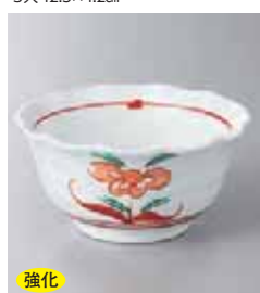
強化 66-14-48G 1,850円 赤絵草花紋小鉢 11×5.5cm