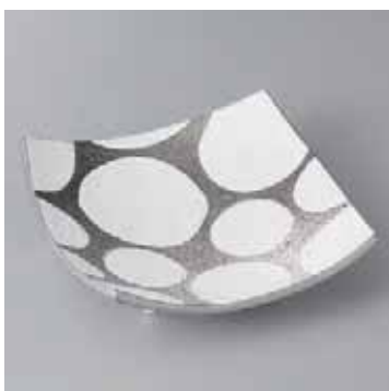
41-16-34G 2,580円 銀彩水玉四方上り皿 15.8×15.8×4.5cm