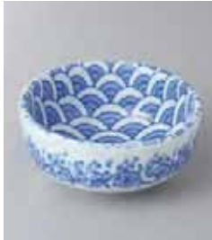
76-20-25G 380円 波3.5ボール 10.4×4.7cm