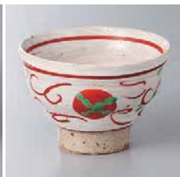
61-20-52G 2,050円 粉引朱丸紋小鉢 11×7.5cm