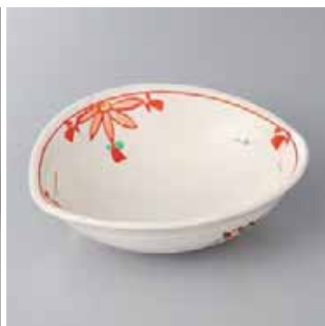
43-10-78G 2,270円 赤給花つなぎすげ傘向付 17.3×15×5.3cm