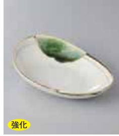
強化 79-11-71G 1,180円 織部流し変型小鉢 15.4×11.3×4.4cm