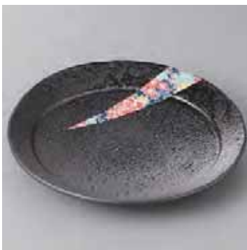
45-3-77G 2,300円 青四季友禅 6.5寸皿 20.5×3cm