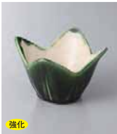
強化 79-25-5G 1,050円 織部花形小鉢 8.5×8.5×6.5cm