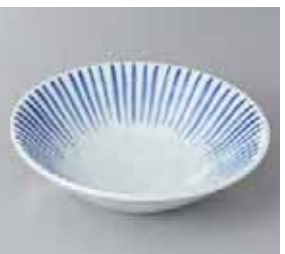
51-5-52G 650円 染付十草リッブル5.0鉢 16.5×4.5cm