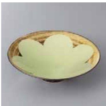
41-6-93G 2,600円 有田焼 南蛮うぐいす平小鉢 5入 16×4.5cm