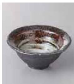
71-29-60G 760円 白輪花鉢(小) 11×11×5.5cm