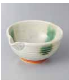
80-20-77G 880円 イラボ片口3.8并 13×11.3×6cm