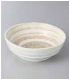
76-26-22G 370円 刷毛茶粉引4寸取鉢 13×4.7cm