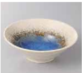
57-3-77G 840円 青水彩輪二重16cm深鉢 16×5.5cm