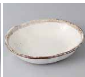
56-23-48G 950円 白唐津楕円鉢 17×14×4cm