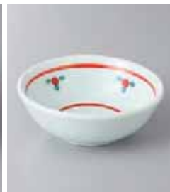
74-3-27G 640円 赤小花 3.0鉢 10.2×3.8cm