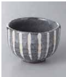
67-34-6G 1,180円 ネズ三十草丸小鉢 9.8×6.4cm