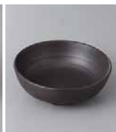
74-22-32G 570円 黒マツ袖五輪小鉢 11×4cm