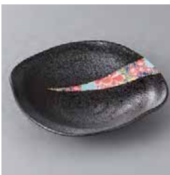
44-15-77G 2,150円 青四季友禅変形6寸皿 18.5×18×4.1cm