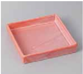
46-23-5G 1,770円 赤染四方皿 15×15×2.5cm