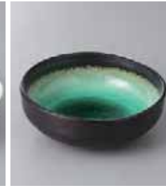
74-11-32G 580円 深海グリーンツツ山 4.0鉢 13.4×4.8cm