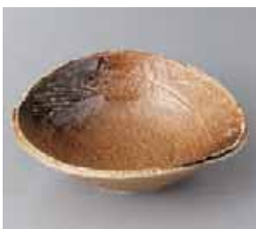
49-25-2G 1,050円 伊賀おしべ吹扇中鉢 17.5×16.5×5.5cm