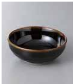
76-33-24G 350円 織部3.5小鉢 11×4cm