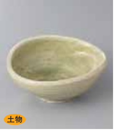
土物 70-36-5G 820円 灰釉たまご 4.0鉢 14.2×11.6×5.6cm