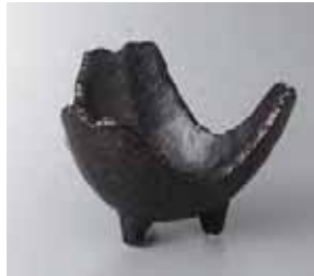
47-21-22G 1,600円 黒釉割山椒小鉢 13.5×13×8.6cm