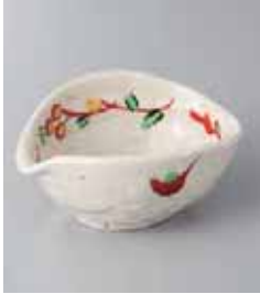
79-13-78G 1,130円 手書玉花片口鉢 11.0×8×4.9cm