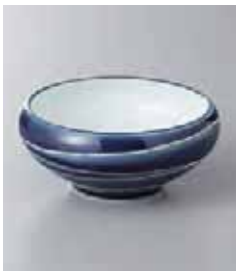
67-31-33G 1,200円 ルリ白濁くり中付 10×4.5cm