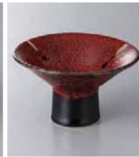
62-19-48G 2,100円 紅柚子天目4.4高台小鉢 12.6×7cm