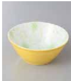
72-29-2G 700円 黄吹さくら 11cmボール グリーン 11×4.6cm