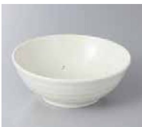
57-22-78G 500円 粉引釉ボール 軽量 14×5cm