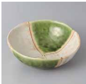
55-1-71G 1,400円 オリーブ市松5.0鉢 14.8×14.4×5cm