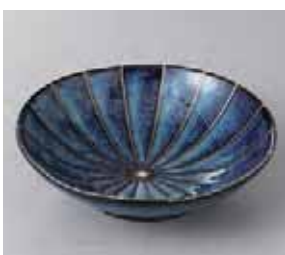
51-12-57G 550円 薫変紺十草5.5浅鉢 17×5cm