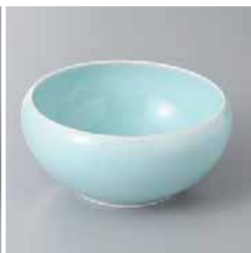
61-15-33G 2,100円 青白磁深口丸鉢 10.3×5cm