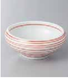
67-14-33G 1,350円 朱千段くり中付 10×4.5cm