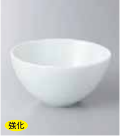
強化 70-16-71G 880円 スワン白磁丸碗(大) 10.8×5.6cm