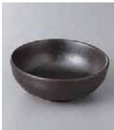
76-32-24G 350円 黒茶3.5小鉢 11×4cm