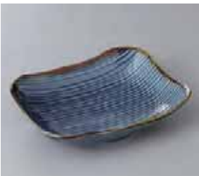
57-9-52G 670円 測鑄兵須千段四方鉢 15.8×12×3.5cm