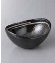
79-19-6G 1,100円 黒けがき楕円鉢(小) 14.3×11.2×6.7cm