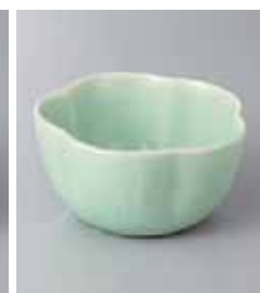
68-11-2G 1,150円 灰釉ビードロ梅形深小鉢 10.8×5.8cm