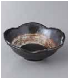
75-16-48G 500円 ひとはな黒刷毛目小鉢 12×5cm