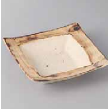
44-7-41G 2,050円 白茶平鉢 16.7×16.7×4.6cm