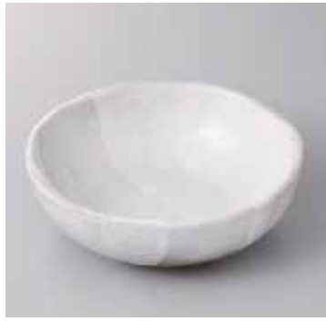
53-17-77G 1,710円 白釉重ね5寸丸鉢 15.8×5cm