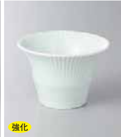
強化 79-24-52G 1,050円 青磁菊型中付 10×7cm