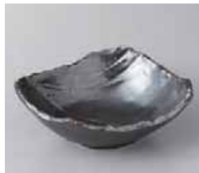
56-2-26G 1,200円 鉄結晶荒瀬型 小鉢 14.5×12×5.5cm