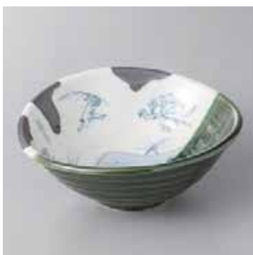
45-14-2G 1,950円 染分鳥獣戯画たわみ小鉢 15.5×13.8×5.9cm