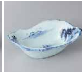
47-14-48G 1,650円 手描き山水手作り風舟型鉢 19×5.5cm