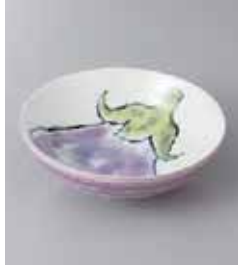
77-7-8G 350円 京野菜ナス 40鉢 13.5×4.5cm