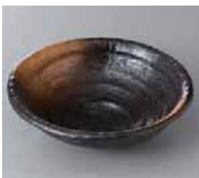
46-31-37G 1,700円 金茶吹き舞深鉢 20.5×19.5×6.5cm