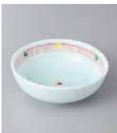
71-25-33G 770円 赤絵水玉 3.8ボール 11.3×3.8cm