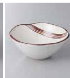
68-12-71G 1,150円 志野流線4.0丸鉢 13×5.5cm