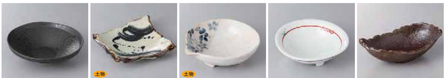
48-21-35G 1,300円 黒吹たわみ5.5寸向付 16.8×16.2×4.6cm 48-22-27G 1,300円 ゴスハケ飛ちぎり皿(中) 18×16.5×4.4cm 48-23-73G 1,280円 雪化粧藍花片口5.0鉢 16.7×15.5×5cm 48-24-2G 1,250円 粉引錦若芽向付 14.5×4.5cm 48-25-57G 1,250円 あずき釉ひねり型向付 18.9×11.6×6.2cm