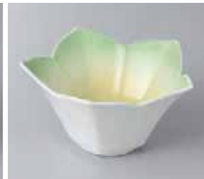
65-23-77G 1,100円 桔梗黄ヒワ吹小鉢 11×6cm