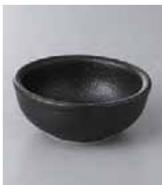
71-32-6G 750円 黒備前(M)10cmボール 10.2×4.1cm