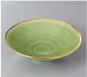
46-1-93G 2,000円 有田焼 四軸金緑平小鉢 5入 15.5×4.5cm