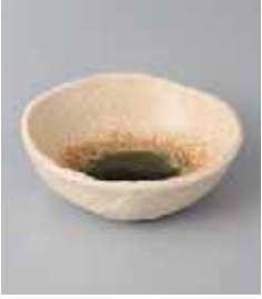
70-29-77G 840円 伊賀織部タラ型とんすい 11×3.5cm