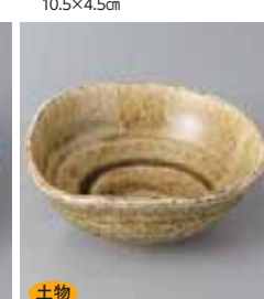
土物 66-30-45G 1,550円 黄瀬戸柿小鉢 12.7×12×5cm