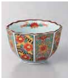
72-33-77G 750円 錦古伊万里花かご八角小付 有田焼 8.7×5.5cm