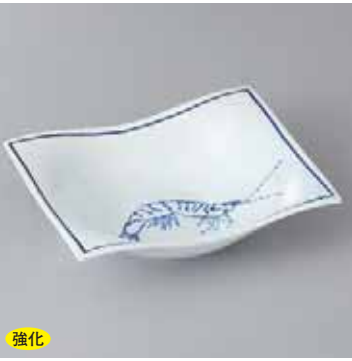
強化 42-19-78G 2,380円 海老画四方形向付 16.2×12.3×4.6cm