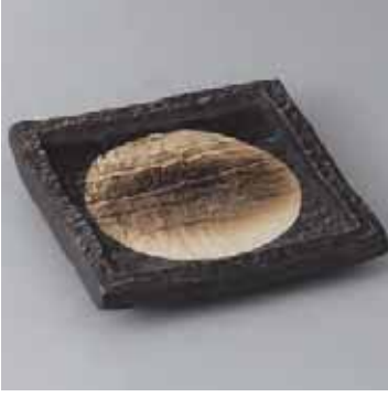
44-6-52G 2,200円 黒釉砂目正角6.5皿 17.5×17.5×3cm