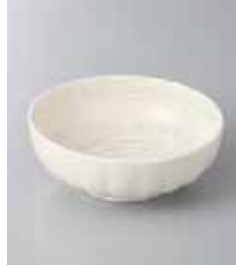
77-11-45G 335円 白ドットライン菊型小鉢 11×4cm