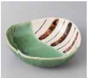
50-23-78G 800円 織部十草変形中鉢 15.5×3.5cm