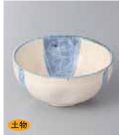
土物 72-23-2G 700円 コス三ツ押小鉢 10.4×4.8cm