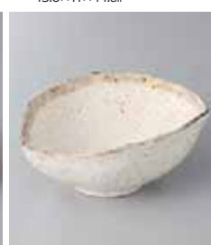
80-29-27G 800円 志野粉引変形小鉢 15×11.6×6.2cm