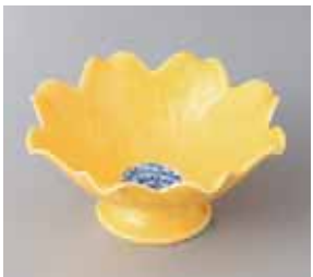
64-2-34G 1,350円 黄彩ユリ型高台小鉢 12.2×5.5cm