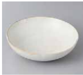
56-7-8G 1,100円 京唐津平鉢 16×4.7cm