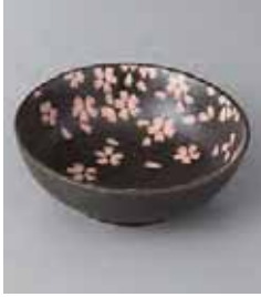
76-7-2G 420円 染付桜12cmボール 12×4.3cm