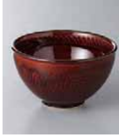
67-10-52G 1,350円 トチリ漆油3.5小鉢 10.5×6.5cm