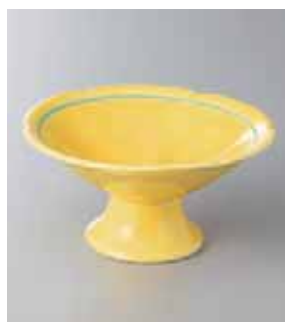
63-23-77G 1,650円 黄釉高台小鉢 13×6.5cm