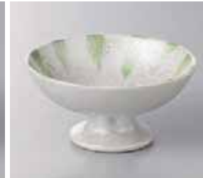
65-4-77G 900円 グリーンラスター十草高台小鉢 11.5×5.7cm