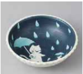
51-8-8G 580円 ねごとちよびあめ50鉢 16×5cm