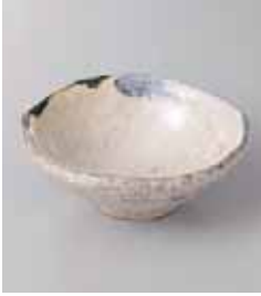
70-21-84G 860円 織部流線 4号深小鉢 12.5×5cm