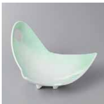
45-13-35G 2,000円 ヒワ吹のし型中鉢 15×15×9cm