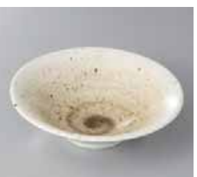
51-15-21G 490円 里粉引茶5.0平鉢 15.9×4.6cm