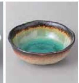
74-6-26G 600円 新海小鉢 12.5×4.5cm