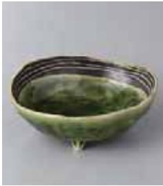
71-1-71G 810円 ライン織部三つ足楕円小鉢 12.3×10.6×4.3cm