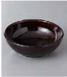
69-3-52G 1,050円 トチリ漆釉丸鉢 11.5×4cm