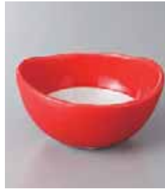
67-5-77G 1,380円 マルチ白抜(赤)小鉢 11×10.5×6cm