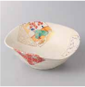
44-18-5G 2,120円 百人一首仁清風三方鉢 15.2×15.2×5.2cm