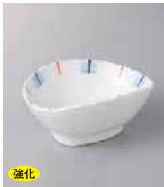
強化 79-26-79G 1,030円 二色十草楕円小鉢 11.6×10.3×5.8cm