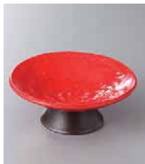
63-5-77G 1,400円 赤塗り高台4寸皿 13.8×5cm