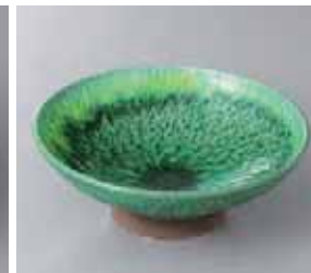
47-9-33G 1,670円 緑釉黄流・チリ高台向付 16×6cm