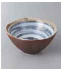
68-7-23G 1,150円 黒潮4.0円錐鉢 12.3×6cm