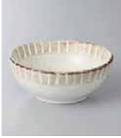
70-25-22G 850円 粉引ライオン 4.0ボール 11.6×4.7cm