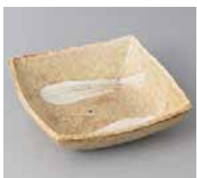
56-21-71G 950円 黄灰袖正角中鉢 15.2×15.2×4cm