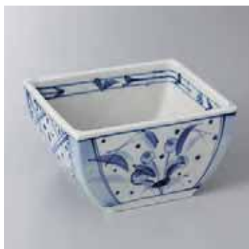
41-9-2G 2,650円 染付け角向付 14.8×12.2×8cm