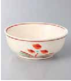
69-7-35G 1,050円 高麗花絵吸皿 10×3.8cm