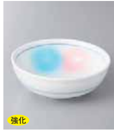
強化 72-5-77G 730円 二色水玉ボール鉢 11.9×4.4cm