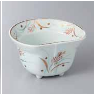
61-7-35G 2,300円 半月金ススキ染付小鉢 11×9.4×6.2cm