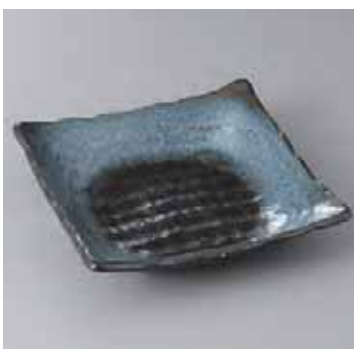
55-15-22G 1,250円 黒志野四ツ足多用鉢 18×18×5cm