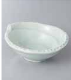
69-22-32G 950円 灰釉貫入シエル小鉢 12.7×12×5cm