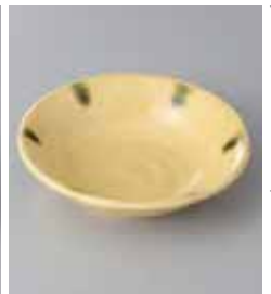
67-36-23G 1,200円 ネオクラフト黄瀬戸4.2鉢 13.8×3.3cm