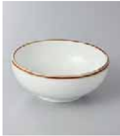
77-1-56G 350円 白うのぶ 3.5ポール 11×4.3cm