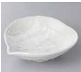
49-19-52G 1,100円 白刷毛目片口向付 17×16×5cm