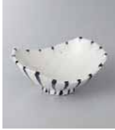
79-9-34G 1,180円 呉須十草舟型鉢 12.2×10×5cm