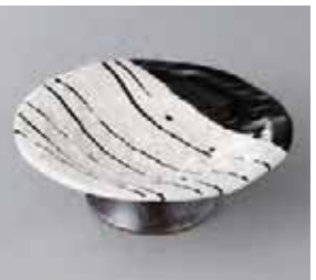
64-4-77G 1,400円 黒塗分けストライプ高台4寸皿 13.8×5cm