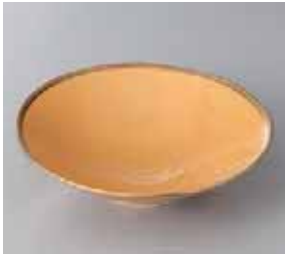
46-4-93G 2,000円 有田焼 四軸金黄平小鉢 5入 15.5×4.5cm