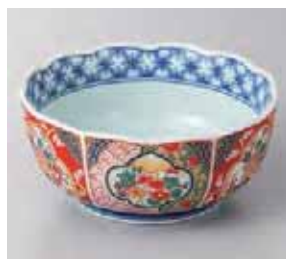
56-17-77G 1,080円 錦唐草木甲菊型小鉢 有田焼 13×6.7cm