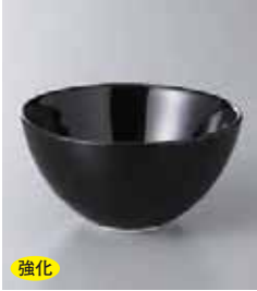
強化 70-15-71G 880円 スワンブラック丸碗(大) 10.8×5.6cm