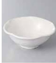
73-11-71G 680円 白釉花型4.0小鉢 12×4.7cm