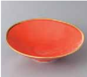
46-2-93G 2,000円 有田焼 四軸金赤平小鉢 5入 15.5×4.5cm