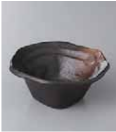
76-1-36G 470円 黒備前吹きなぶり小鉢 11.5×5cm