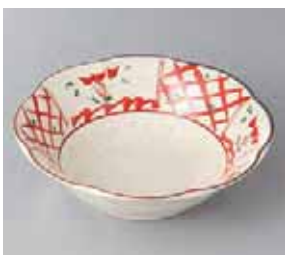
49-23-21G 1,050円 格子間取花花型鉢 17.3×5cm