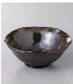
71-28-71G 750円 金彩天目花小鉢 12×5cm