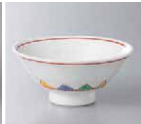
65-18-22G 1,800円 白マット三角紋反小鉢 11.5×5.2cm