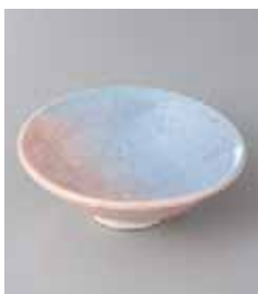
71-26-71G 770円 紅袖平鉢 12.5×4.5cm