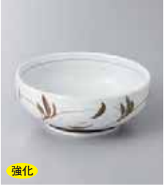
強化 70-35-78G 830円 梨地唐草吞水 10.6×4.1cm