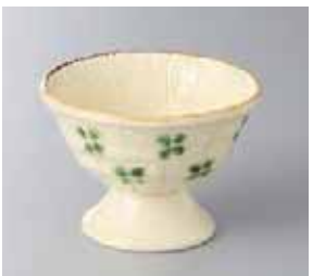
64-18-2G 1,050円 粉引織部花散高台小鉢 10.3×7.5cm