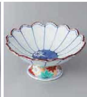
62-8-23G 2,800円 菊割春秋高台4.3小鉢 13×6.2cm