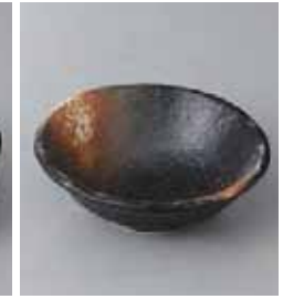
74-12-8G 580円 黒備前花型小付 11.3×3.8cm