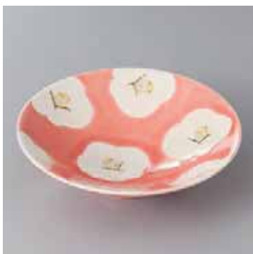
41-8-93G 2,600円 有田焼 紅袖椿平小鉢 5入 16×4.5cm