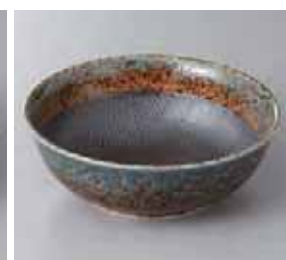
56-24-43G 900円 民芸藍流し 5.5 中鉢 16.6×5.8cm