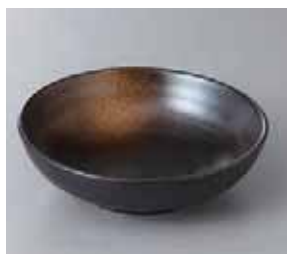
57-16-31G 530円 備前風山茶吹4.5ボール 15×4.5cm