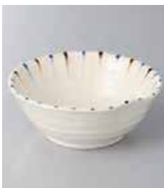
73-34-71G 630円 二色十草(青)片押し鉢 12×11.7×4.6cm