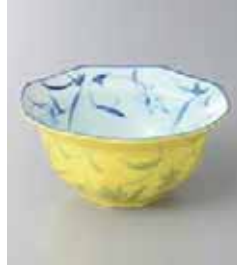
71-12-2G 800円 黄吹草花八角小鉢 12×5.5cm