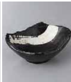
80-4-36G 950円 黒炭白刷毛小鉢 14.3×12.5×5.8cm