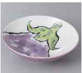
51-18-8G 500円 京野菜ナス55鉢 18×5cm