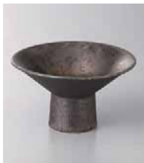
63-1-26G 2,000円 金結晶杯形高台鉢 13.2×7.3cm