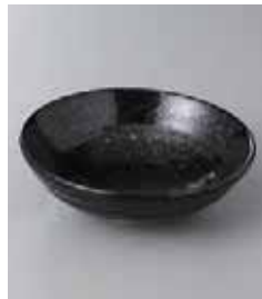
76-29-35G 360円 油滴天目六兵衛4.0鉢 13.7×4.4cm