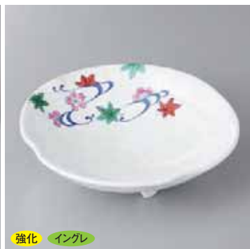
強化 イングレ 43-2-5G 2,340円 錦春秋向付 18×5.5cm