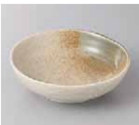
57-25-37G 400円 織部砂茶吹き京4.5ボール 15×4.7cm