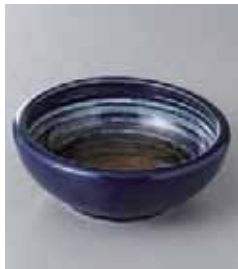
75-27-77G 450円 青風くくり手 4寸深鉢 12.8×4.8cm