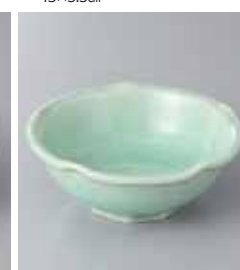
68-18-2G 1,100円 灰釉ビードロ4.0鉢 12×4.8cm