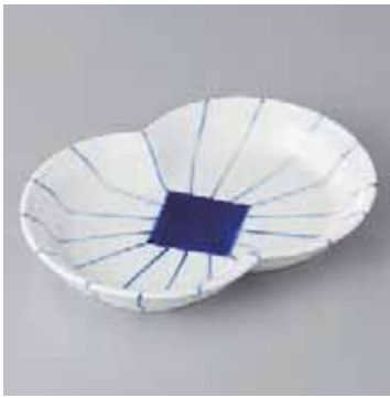
59-11-23G 2,900円 紺筋輪つなぎ皿 16.7×11.1×2.8cm