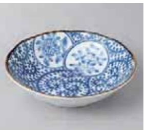
51-30-57G 350円 丸紋唐草5.5浅鉢 16.5×4cm

盛皿・オードブル 大鉢・盛鉢・組鉢 酒器 箸置き 卓小物 箸 スプーン レンゲ 盛皿