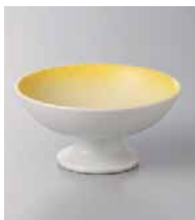
63-16-57G 1,200円 イエロー吹高台小鉢 11.8×6cm