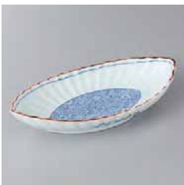
43-15-52G 2,200円 染付春秋菊型小判向付 21.5×10.8×4cm