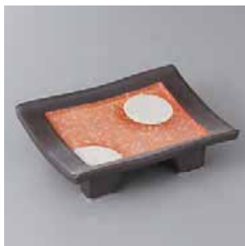
43-9-22G 2,300円 黒土萬月高台5.0皿 15.6×11.5×4.4cm