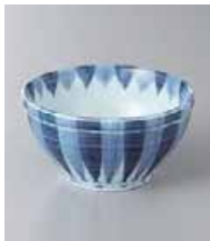
76-34-43G 350円 千段十草小鉢 11×5.5cm