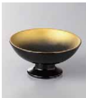
63-7-77G 1,760円 金彩黒高台小鉢 11.5×5.7cm