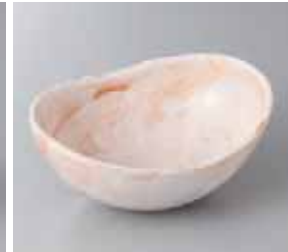
47-23-31G 1,590円 赤志野玉子型鉢 大 17.6×13.4×7.4cm