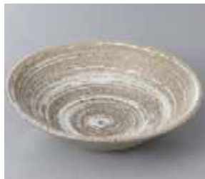
57-6-25G 750円 風の舞リップル5.0鉢 16.7×4.5cm