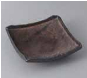
46-11-52G 1,850円 金結晶正角向付 14.5×14.5×4.5cm