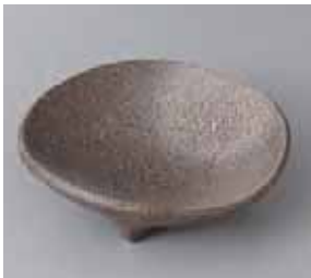
50-19-37G 840円 黒伊賀三つ定向付 14.5×14×4.5cm