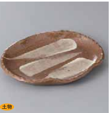
土物 42-16-2G 2,400円 萩釉楕円皿(手造り) 19×14.5×2.5cm