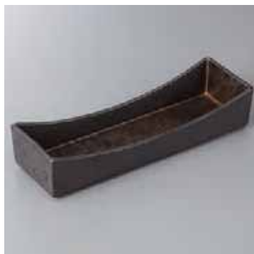
43-1-52G 2,350円 金結晶切立長角鉢 25.5×8.5×5.5cm