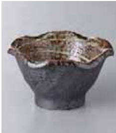
73-4-60G 680円 うず潮花型3.0小鉢 10×5.5cm