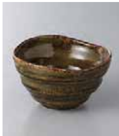
77-27-2G 300円 おりべ三ツ山小鉢 10×6cm