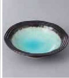
76-18-32G 370円 リム深海水色4.5浅鉢 14.5×3.5cm