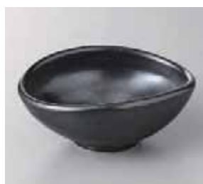
56-22-26G 950円 鉄結晶タマゴ鉢 14×12×6cm