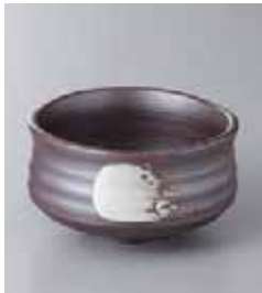
73-14-48G 650円 いびし白刷毛抹茶型小鉢(大) 9.8×5.5cm