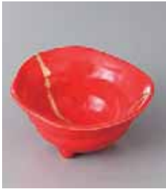
67-1-77G 1,400円 金線赤三つ足小鉢 11×5.5cm