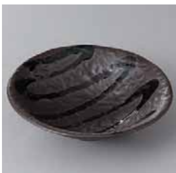
55-18-32G 1,220円 黒織部流向付 15×4.4cm