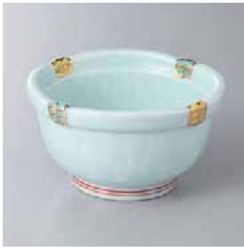
59-12-93G 3,000円 有田焼 測錦龍目小鉢 5入 12×7cm