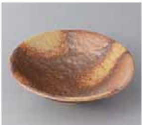
49-8-36G 1,200円 美膳岩向付 15.3×4.5cm