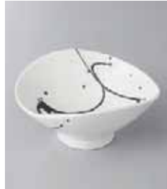
79-23-77G 1,050円 白結晶黒とばしすげ笠小鉢 11.3×10.5×5cm