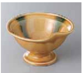
64-22-2G 1,100円 黄瀬戸高台小鉢 12×7cm