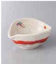
79-27-35G 1,000円 花たんざく片口小鉢 11.3×9×4.9cm