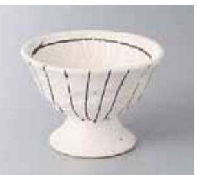
64-29-35G 900円 ストライプ(白)高台小鉢 10.2×7.4cm