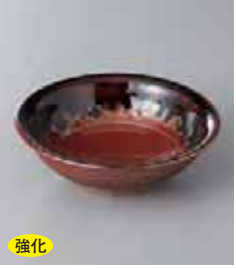
強化 70-24-71G 850円 みのり 3.6丸鉢 11.4×3.8cm