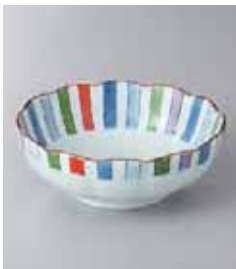
69-31-93G 900円 有田焼 錦十草小鉢 5入 13×5cm