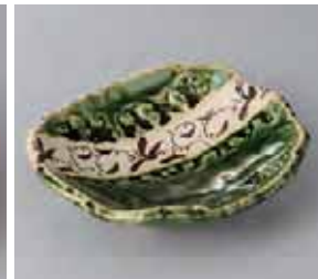
47-18-71G 1,600円 織部唐草向付 16×13.5×4.5cm