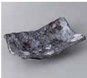
49-27-32G 1,050円 白雪 長変形取皿長角皿 18.5×11.5×5cm