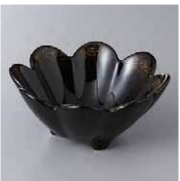
60-14-2G 2,450円 蒔絵菊割小鉢 12.5×5.6cm