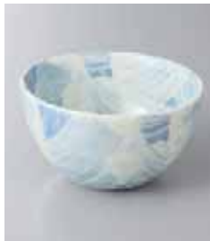
76-28-33G 360円 美濃刷毛3.5深鉢 11×6.3cm