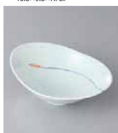
78-14-93G 1,750円 有田焼 穂精円小鉢 5入 16×12×5.5cm