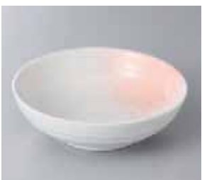
57-18-2G 520円 あけぼの4.5ボール 15×4.8cm