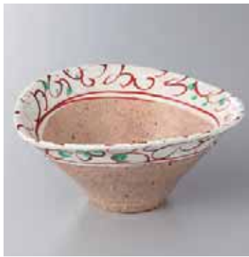
42-1-52G 2,550円 粉引湖唐草傘型向付 16.8×14.6×7.5cm