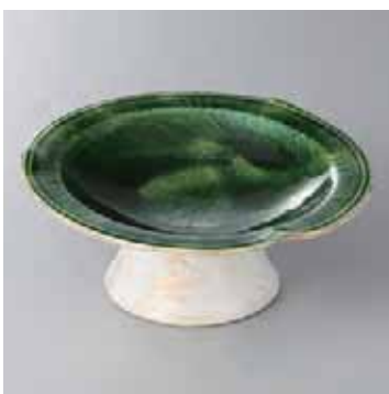
45-19-33G 1,950円 織部タタキ高台皿(大) 16.5×7.5cm