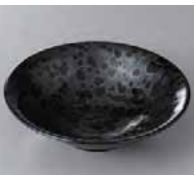
51-4-34G 680円 油敵天目平鉢 17.8×4.8cm