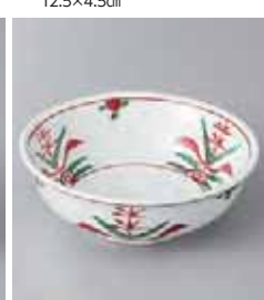
66-22-37G 1,600円 三方花取皿 11.5×4cm