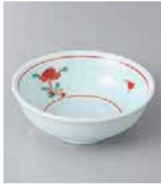
72-4-37G 720円 青地赤絵小花反 3.5鉢 11.7×4.2cm