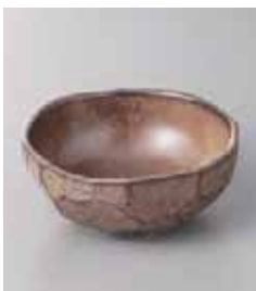
75-4-5G 520円 窯変茶流たたき 4.0鉢 12×11.5×5cm