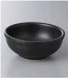
70-9-6G 900円 黒備前(M)13.5cmボール 13.7×5.5cm