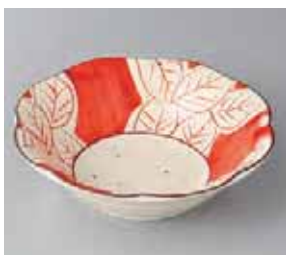
49-22-21G 1,050円 木の葉花型鉢 17.3×5cm