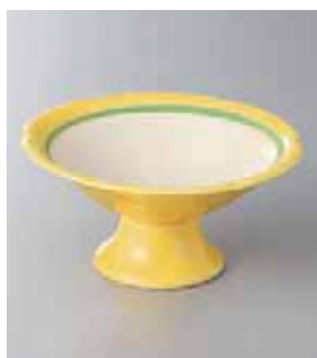
63-21-77G 1,780円 黄釉高台白抜小鉢 13×6.5cm