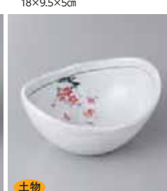
土物 78-28-23G 1,500円 野書紅梅 5.0楕円鉢 14.5×11.3×7.5cm