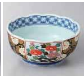
56-18-77G 1,080円 錦菊牡丹菊型小鉢 有田焼 13×6.7cm