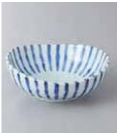
76-25-32G 370円 濃十草精円3.5鉢 11×10.5×4cm