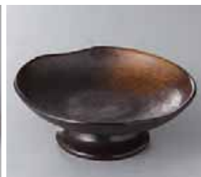
47-2-33G 1,750円 黒茶結晶高台皿(大) 15.5×5.5cm