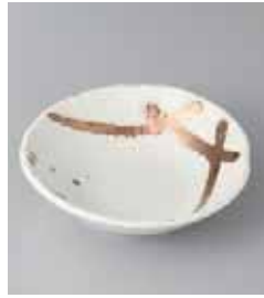
74-8-77G 590円 金色流し取鉢 15×14.5×4.3cm