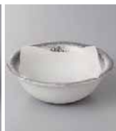
66-9-10G 1,650円 プラチナスクエアつば付丸4.0鉢 13.5×4.6cm