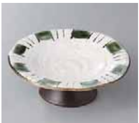
64-17-34G 1,200円 織部十草高台4.0寸皿 14×4.7cm