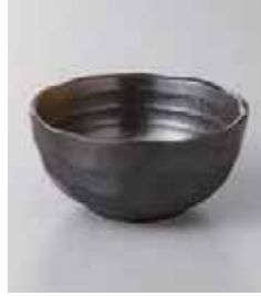
76-11-27G 400円 黒備前金茶吹石垣9cmボール 9.5×4.7cm