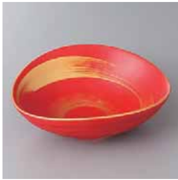
44-9-77G 2,200円 赤釉金彩刷毛目渦橋門向付 17.3×15.5×6cm