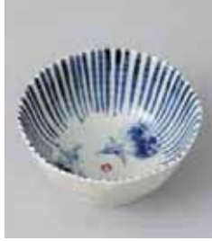
72-10-10G 720円 京野菜八角小鉢 なす 10.9×5.4cm