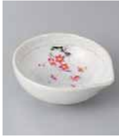
67-22-23G 1,250円 暁書紅梅片口3.5鉢 11.5×10.6×4.5cm