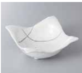
57-2-56G 850円 白一珍四方鉢(小) 13.5×13.5×5.5cm