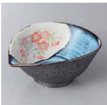
55-14-23G 1,280円 清流サクラネシ(鉢大) 15.2×12.7×6.4cm