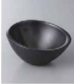
69-14-2G 980円 黒マット4.0ボール 12×12×6.5cm