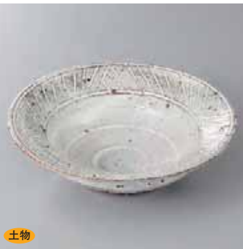
土物 42-15-52G 2,450円 粉引三島彫5.5鉢 18.2×5.3cm