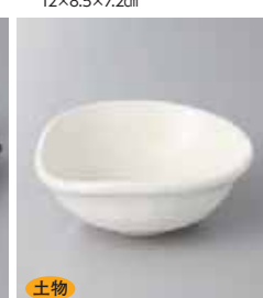
土物 78-23-45G 1,550円 粉引|柿型小鉢(手造) 12.7×12×5cm