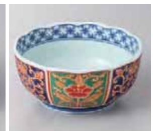
56-20-77G 1,080円 錦唐草木甲菊型小鉢 有田焼 13×6.7cm