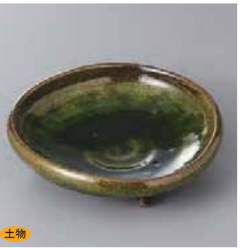
土物 42-4-2G 2,500円 織部三ツ足向付(手造り) 14.7×4.8cm