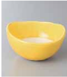
67-4-77G 1,380円 マルチ白抜(黄)小鉢 11×10.5×6cm