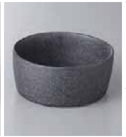
67-30-45G 1,200円 鉄ペーパー切立小鉢 11.2×11.2×5cm