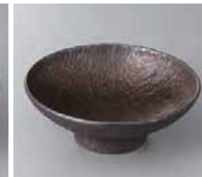
47-10-33G 1,670円 金結晶・チリ高台向付 16×6cm