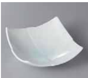
49-5-33G 1,200円 青白磁市松向付 14×14×5cm