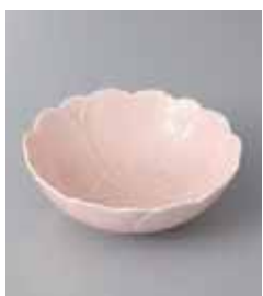
66-7-93G 1,950円 有田焼 さくら(桃釉小鉢)12.5 3入 12.5×4.2cm