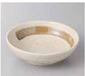
57-30-37G 400円 織部砂茶刷毛京4.5ボール 15×4.7cm