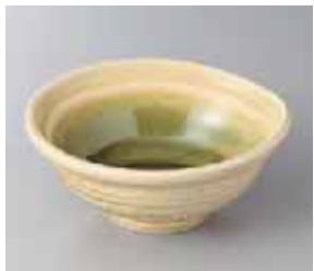
56-1-2G 1,200円 琥珀 16cmボウル 16×6.5cm