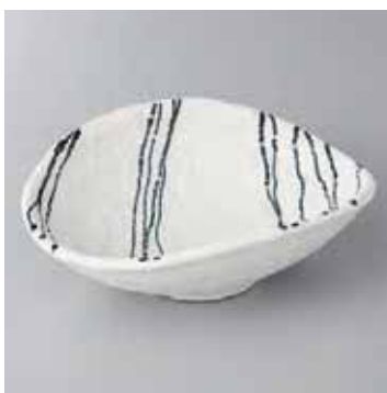
45-16-48G 1,950円 春雷白精円向付 17.2×13.3×5.5cm