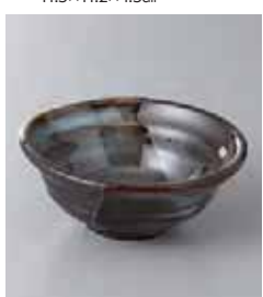
74-25-23G 550円 山霧なぶり小鉢 12×11.5×5cm