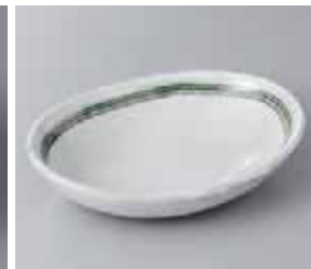
56-4-71G 1,200円 あおい楕円鉢 17×12.6×3.5cm