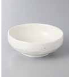
77-9-31G 340円 乳白 3.5ポール 10.7×3.7cm