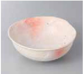
50-1-60G 1,000円 桜志野手造り鉢 15.5×15×11cm