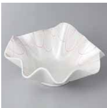
41-20-27G 2,500円 ピンクパールスター紙銅型向付 18×18×7.5cm