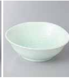
74-10-32G 580円 もえぎ岩清水 4.0 呑水小鉢 12×4cm