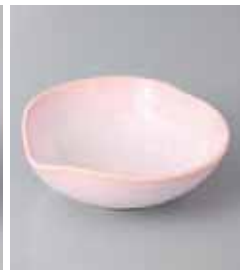
74-15-52G 570円 ピンク志野花びら型小鉢 12×12.5×4.3cm