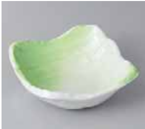
50-2-32G 1,000円 春夏秋冬荒ノギ 14cm小鉢 13.5×13.5×5cm