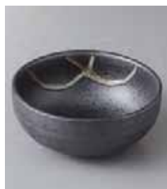
71-30-71G 750円 潮流し 4.0丸小鉢 13×5.7cm