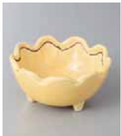
68-1-73G 1,180円 黄釉菊型三ツ足小鉢(大) 10.3×5cm