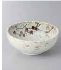
77-5-21G 390円 織部吹声 3.5ポール 11×4.4cm