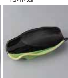
78-22-56G 1,580円 有明の月葉月(小) 18×9.5×5cm