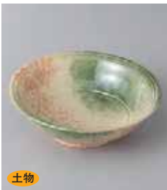
土物 70-2-77G 900円 若草 3.6玉子割 11.5×3.7cm