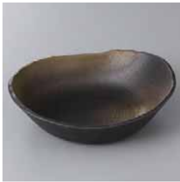
44-1-71G 2,400円 月光6.0変型鉢 18.5×16.5×5cm