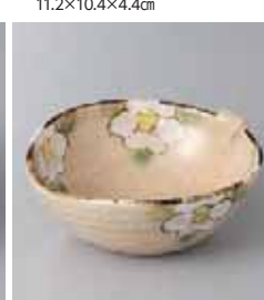
68-28-37G 1,050円 織部椿耳付小鉢 14.3×12.5×5.3cm