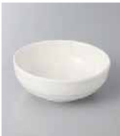
76-31-24G 350円 白粉引3.5小鉢 11×4cm