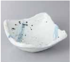
50-3-33G 990円 涼風 14cm小鉢 14×14×5.7cm