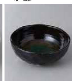
74-29-32G 550円 黒櫻トルコブルー 亀甲 4.0ボール 11.8×4.6cm