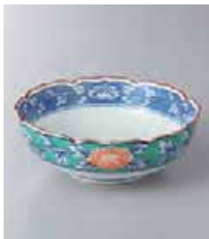
69-32-93G 900円 有田焼 緑濃牡丹小鉢 10入 13×4.5cm