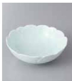
66-8-93G 1,950円 有田焼 さくら(青磁小鉢)12.5cm 3入 12.5×4.2cm