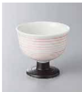
63-19-27G 1,500円 赤千段高台小付 8.2×7.5cm