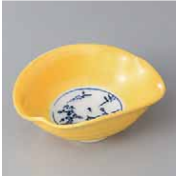
59-6-53G 3,200円 雲型黄交趾小鉢 13×10×5.3cm