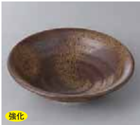
46-9-33G 1,920円 紅白十草向付 16.5×5.5cm