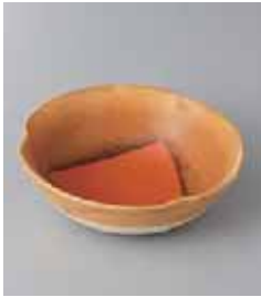
70-7-71G 900円 いろ紙三ツ押小鉢 13×4.2cm