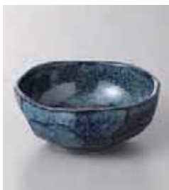
75-5-5G 520円 窯変青釉たたき 4.0鉢 12×11.5×5cm