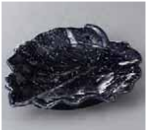
46-6-22G 1,950円 ルリ紺葉型向付 20×13.5×6cm