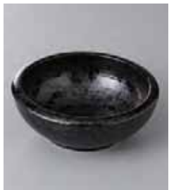
74-13-43G 580円 銀彩天目括り手 4.0小鉢 12.8×4.9cm