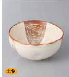
土物 72-24-2G 700円 茶サビ三ツ押小鉢 10.4×4.8cm