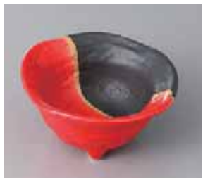
65-26-77G 1,400円 金線赤黒三ツ足小鉢 11×5.5cm