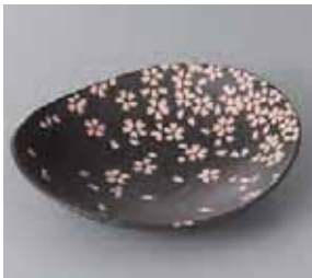
50-24-2G 800円 染付桜楕円皿(大) 17.5×15.2×4cm