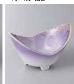
78-17-77G 1,700円 紫むさしの二ツ割小鉢(小) 12×8.5×7.2cm