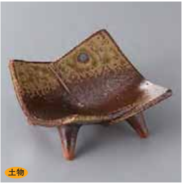
土物 60-18-45G 2,400円 トジ×灰釉小付小鉢(手道) 9.5×10×5cm