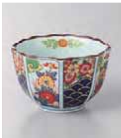
72-32-77G 750円 錦古伊万里青海波八角小付 有田焼 8.7×5.5cm