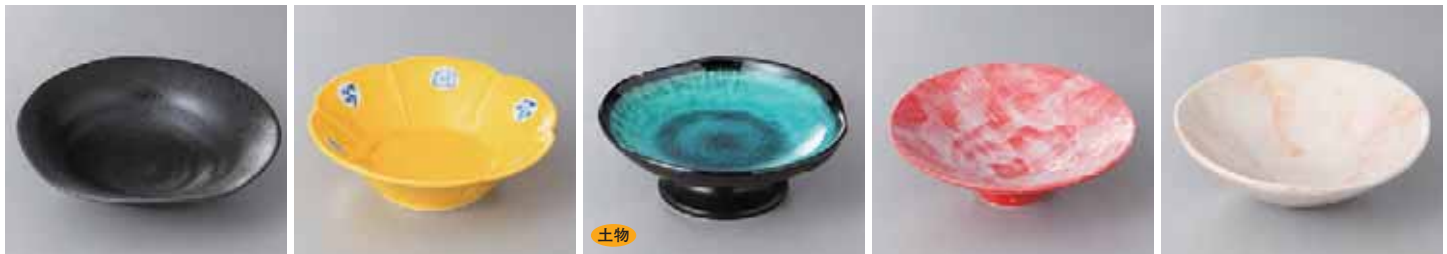
48-6-27G 1,450円 黒結晶平鉢 19.3×5cm 48-7-2G 1,450円 黄松竹梅朝顔平向付 14.5×4.5cm 48-8-23G 1,450円 ヒスイ天目高台皿(大) 15×5cm 48-9-21G 1,450円 赤染 16cm平鉢 16.2×5.2cm 48-10-31G 1,450円 赤志野向付 17.6×5.6cm