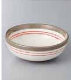
69-21-33G 960円 赤ライン玉割 11.7×4.3cm