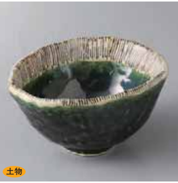
土物 60-19-35G 2,400円 織部十草精円小鉢(小) 12.2×9.8×6cm