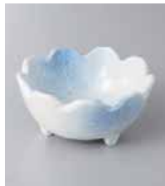
68-2-73G 1,180円 吹墨菊型三ツ足小鉢(大) 10.3×5cm