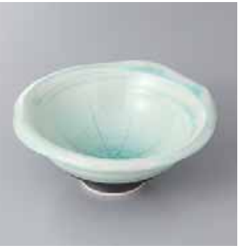
42-20-71G 2,350円 御深井ひねり向付 15.5×6.3cm