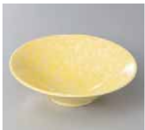
56-11-43G 1,100円 黄吹き 5.0 平鉢 16×4.8cm