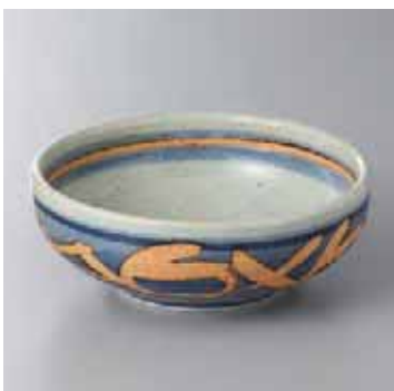
53-7-43G 1,900円 古代益子5.0浅口ボール 15×5.7cm