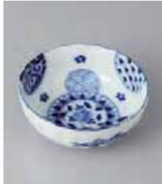
76-22-36G 380円 藍丸紋菊型3.5鉢 10.7×4.2cm