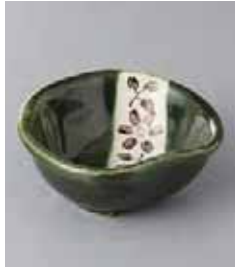
72-22-34G 700円 織部クレマスひねり小鉢 10.8×9.8×4.5cm