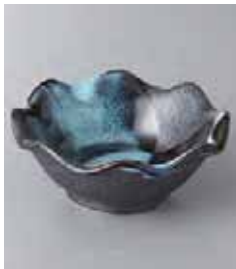
72-26-60G 700円 清流花型 3.6小鉢 11×4.7cm