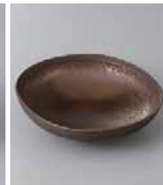
74-17-52G 570円 金結晶 12cm浅鉢 12×3.3cm