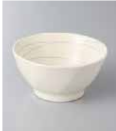
77-21-34G 300円 点丸ねじり 3.6小鉢 10.8×5.5cm