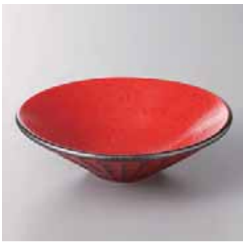
53-11-20G 1,800円 根来しのぎ浅鉢(小) 100入 14.5×4cm