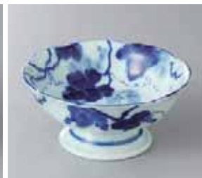
65-28-34G 680円 藍染ぶどうデザート鉢 12×5.5cm