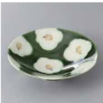
41-7-93G 2,600円 有田焼 織部椿平小鉢 5入 16×4.5cm