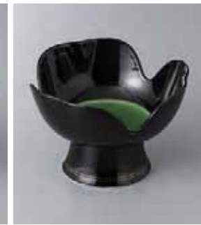
62-5-93G 3,200円 有田焼 黒釉緑掛分高台小鉢 5入 13×9cm