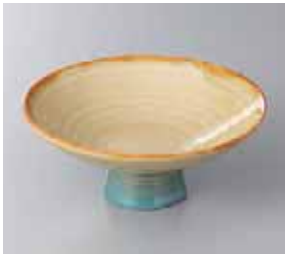
46-12-1G 1,850円 プリンなまご高台皿 15×6.5cm