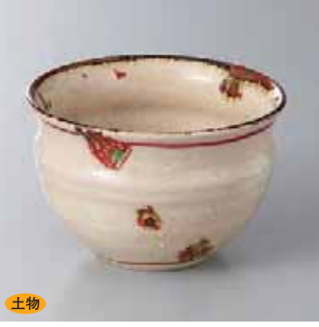
土物 60-7-37G 2,600円 錆安南赤絵小鉢 11×7cm