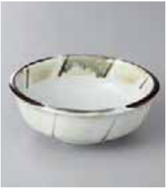
70-11-23G 900円 モダン十草玉割り小鉢 12.4×4.5cm