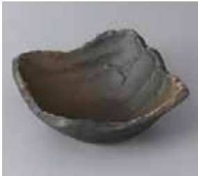
50-5-33G 880円 黒伊賀茶吹 14cm小鉢 14×14×5.7cm