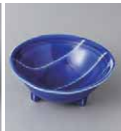
73-30-2G 630円 最上川三ツ足3.8鉢 11.5×11.5×5cm