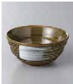
77-34-71G 260円 織部白刷毛小鉢 10.8×5cm