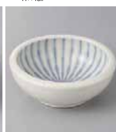
74-28-21G 550円 フォーカス 白×くり手 4.0鉢 13×4.7cm