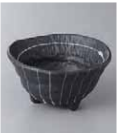
70-5-35G 900円 ストライプ(黒)三ツ足小鉢 11.4×6.1cm