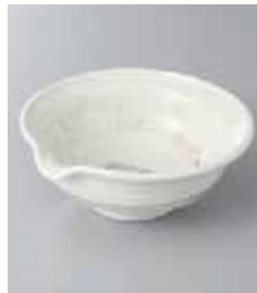
69-29-32G 930円 片口粉引風車4.0鉢 13.5×13.2×5.2cm