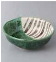
73-26-77G 650円 織部十草3.6小鉢 12.3×4.5cm