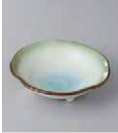
72-14-71G 720円 若草三ツ足 3寸浅鉢 11×3cm