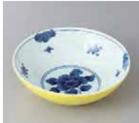
47-26-2G 1,500円 黄吹草花中鉢 17×5.3cm