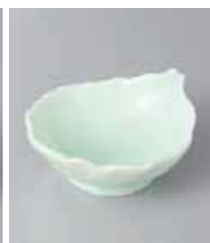
80-23-32G 870円 若草葉型小鉢 13.8×11×4.4cm