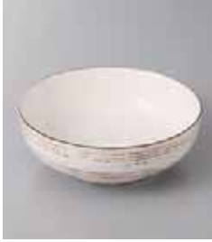
71-10-20G 800円 錆粉引千段4.0ボール 80入 13×4.5cm