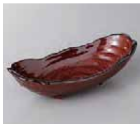
49-1-57G 1,280円 アメ軸三ツ足楕円向付 19.6×9×5.2cm