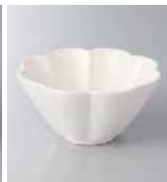
73-36-8G 630円 菊花小鉢白備前 13×6.3cm