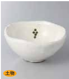
69-25-33G 950円 マスカット丸小鉢 12.5×6cm