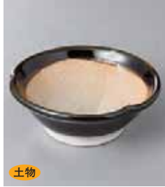
土物 72-15-45G 720円 黒織部三ツ押し花形すり鉢小鉢 12×4.5cm