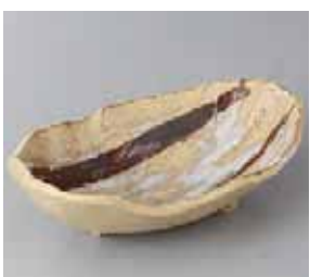
49-13-45G 1,150円 布目流水刺身鉢 20.5×12×6cm