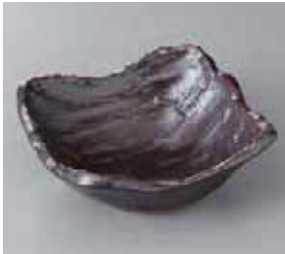
50-4-36G 880円 銀河荒ノギ小鉢 14×14×5cm