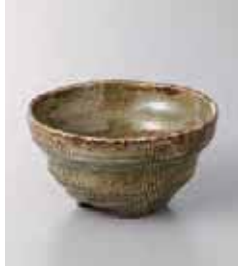
77-13-2G 330円 オリベ串目三足小鉢 11.3×5.8cm