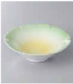
67-25-77G 1,230円 柄抜黄ヒツ吹松花堂 12×3.5cm