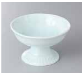
64-16-32-52G 1,220円 青地ユリ型デザート 11.5×6.7cm