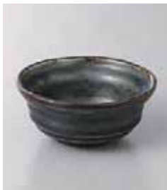
77-32-2G 280円 紺イラボ縄文小鉢 10.8×4.6cm