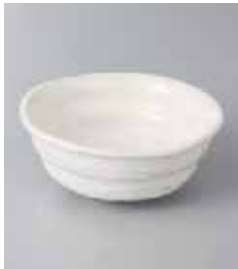
75-35-32G 450円 白釉角浜 3.3六ペイ小鉢 10.6×4.4cm