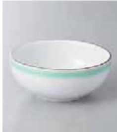
72-21-6G 700円 深翠 3.2ボール 9.5×4.2cm