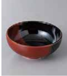
76-16-26G 380円 あけぼの天目3.5ボール 10.8×4.2cm