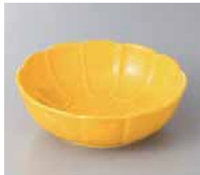
47-16-2G 1,650円 黄菊形カゴ鉢 14×4.7cm