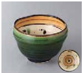
64-11-52G 1,900円 外織部内弥七田小鉢 10.5×7cm