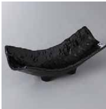
42-13-22G 2,450円 黒釉 両上り向付 24×10×8cm