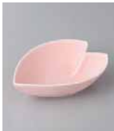
80-3-25G 950円 花びらピンク小付 13.6×9.4×3.2cm