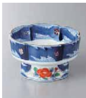
63-20-26G 2,000円 安土牡丹3.8小鉢 11.8×6.7cm