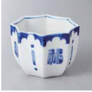
60-5-23G 2,750円 永福八角小鉢 8.7×8×6.2cm