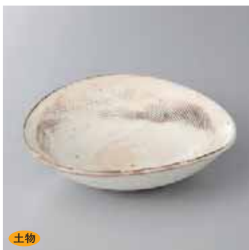
土物 43-8-45G 2,300円 粉引|欄目精円向付鉢 16.7×15.7×4.5cm