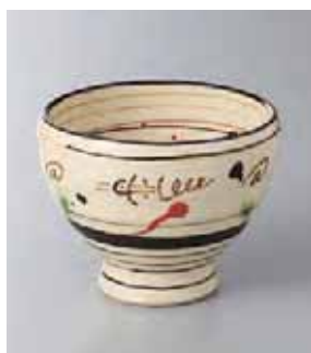
63-12-52G 1,550円 弥七田高台小鉢 10.5×8cm