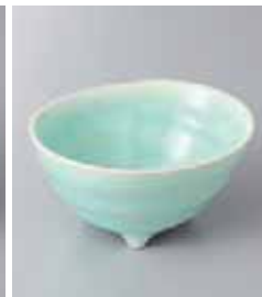
74-16-52G 570円 トルコ三ツ足楕円小鉢 11.5×9.5×5.5cm