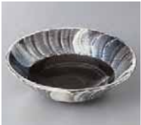
46-8-33G 1,930円 青吹白タタキ5.0向付 15.5×4.5cm