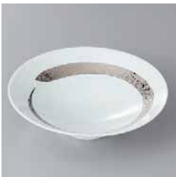
41-3-93G 2,600円 有田焼 プラチナ刷毛平小鉢 5入 16×4.5cm