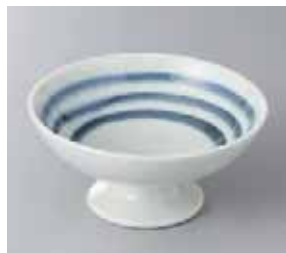
65-27-23G 960円 御深中三本線高台デザート 11.7×5.8cm