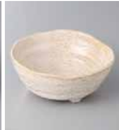
73-6-45G 670円 白うのふ取鉢 12.5×12.5×5.3cm