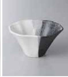
79-12-78G 1,030円 塗分朝顔型小鉢 13×12.5×6.8cm