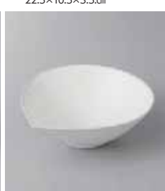
80-34-8G 750円 ドルチェモア小鉢 13.8×12.5×4.8cm