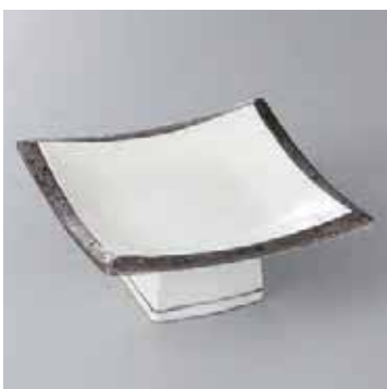
41-19-52G 2,550円 淵プラチナ正角4.5高台皿 13.5×13.5×5.5cm