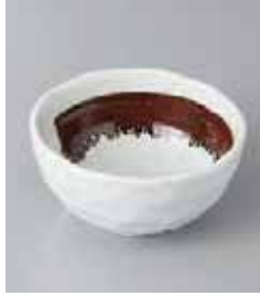
76-9-27G 410円 武蔵石垣9cmボール 9.5×4.6cm