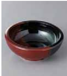
75-21-26G 480円 あけぼの天目 4.0ボール 12.8×4.8cm