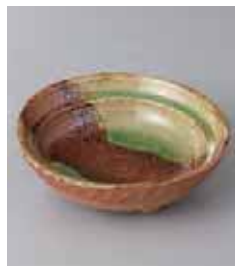
73-29-32G 630円 織部三ツ足小鉢 12.5×4.1cm