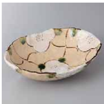
41-13-22G 2,600円 格子花椿円鉢 21.3×15.3×5.5cm