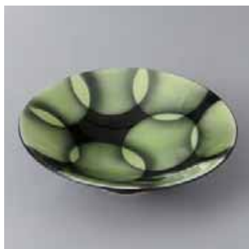
41-5-93G 2,600円 有田焼 うぐいす水玉平小鉢 5入 16×4.5cm