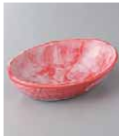
79-35-60G 950円 赤彩花夕月小鉢 16×21×4cm