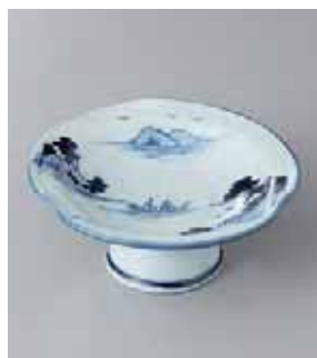
63-9-48G 1,750円 手描き山水高台小鉢 12.3×5.2cm