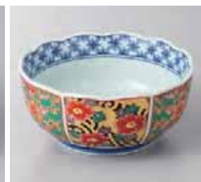
56-19-77G 1,080円 錦流水花菊型小鉢 有田焼 13×6.7cm