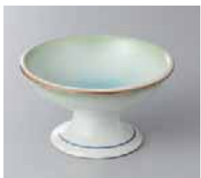
64-26-71G 950円 若草高台鉢(デザート) 11.5×6cm