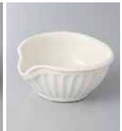
80-18-2G 880円 白マットソギ片口小鉢 12×10.8×5.2cm