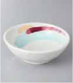
70-17-77G 870円 しらすぎ手びねり4寸鉢 13.5×4.5cm