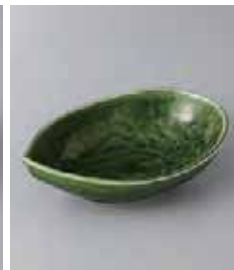
80-17-43G 850円 織部リーフ小鉢 16.8×10.8×4.5cm