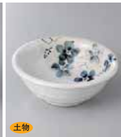
土物 68-4-73G 1,160円 雪化粧藍花4.5中鉢 13.5×5.2cm