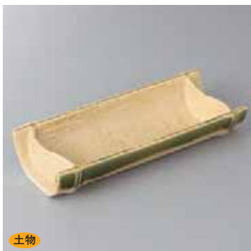
土物 43-4-73G 2,310円 黄瀬戸竹割向付 22.2×10×4cm