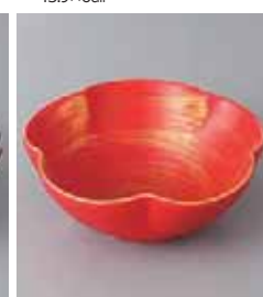
66-17-77G 1,550円 赤釉金彩刷毛目洞花型小鉢 12.8×5cm