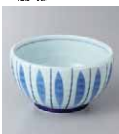
68-13-6G 1,180円 丸十草3.5小鉢 10.9×6cm