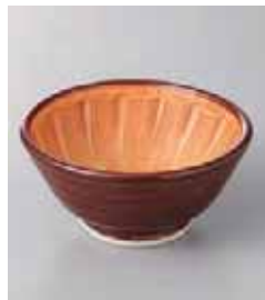
74-14-77G 570円 茶すり鉢深口(大) 12×5.7cm