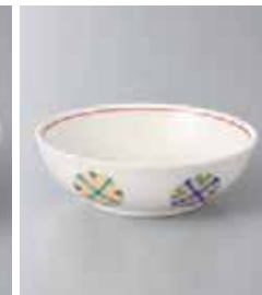
68-6-5G 1,150円 黄釉錦丸紋取鉢 11.3×3.5cm