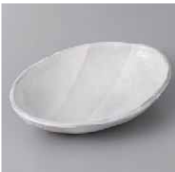
55-3-77G 1,380円 白釉重ね6寸小判鉢 18.5×13.5×3.5cm