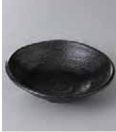
76-14-48G 400円 鳴門黒耀4.5深皿 14.7×3.8cm