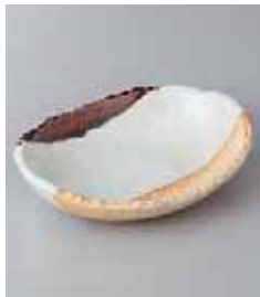
79-28-71G 1,000円 アミ塗分 5.0 舟型ボール 15.3×11.5×3cm