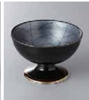
62-23-7G 2,350円 銀彩高台小鉢 11.5×7cm