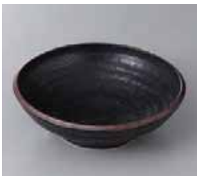
50-30-25G 700円 黒水晶荒引浅鉢 16.8×5.2cm