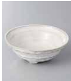
77-29-2G 290円 うのぶ片口小鉢 11.3×4.2cm