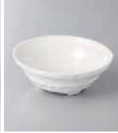
76-12-48G 400円 チタン白片口三ツ足鉢 11.5×11.3×4.5cm