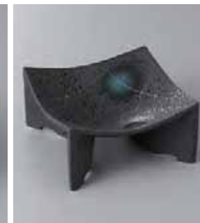
62-10-22G 2,450円 黒マット線彫正角皿(小) 12×6cm