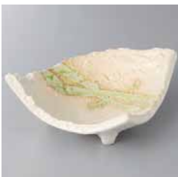
53-3-21G 2,100円 葉桜民窯三角鉢 21.3×16.5×7.7cm