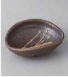
70-33-21G 830円 織部散し黒うず取鉢 14.5×12×5cm