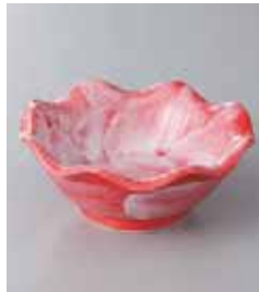
71-23-60G 770円 赤彩花花形 3.6鉢 11.2×4.5cm