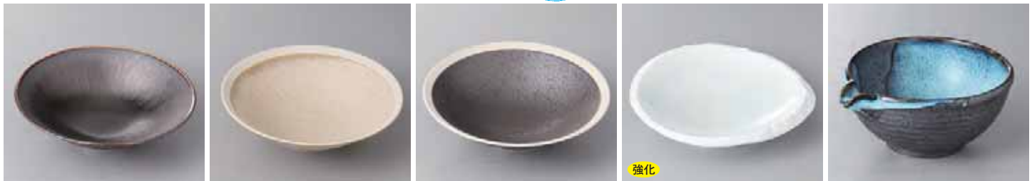
48-1-55G 1,800円 寂縁向付 17.3×4.7cm 48-2-55G 1,550円 絹衣向付 17.4×4.7cm 48-3-55G 1,800円 弥勒向付 17.3×4.7cm 48-4-34G 1,480円 ホワイトオーバル6.0向付強化 18.5×17.5×4cm 48-5-60G 1,450円 清流片口中鉢 16×14×7cm