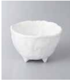
71-3-33G 810円 白磁白小雪4つ足小鉢 9×6cm