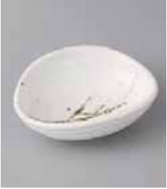
70-34-21G 830円 織部散し白うず取鉢 14.5×12×5cm