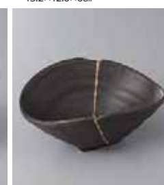
78-18-22G 1,650円 黒伊賀金ライン変形小鉢 14.8×11.3×6cm