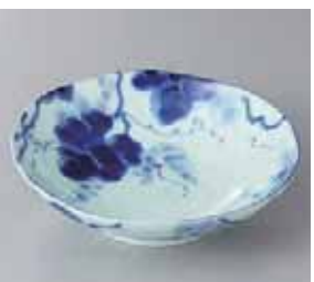
51-24-34G 420円 藍染ぶどう5.5浅鉢 17×4.8cm