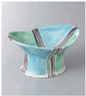
62-16-24G 2,300円 二色交趾楕円小鉢 13.7×10×6cm