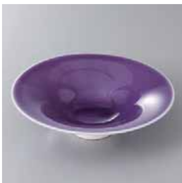
45-6-52G 2,050円 バイオレット反方向付 16.2×4.1cm