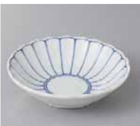
57-31-34G 300円 菊花紋4.0浅井 13.7×3.6cm