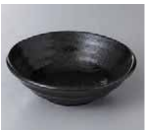
57-23-48G 460円 鳴門黒耀煮物鉢 16.7×5.2cm