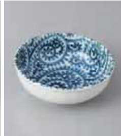
77-24-8G 300円 たご唐草玉淵 33鉢 11×4cm