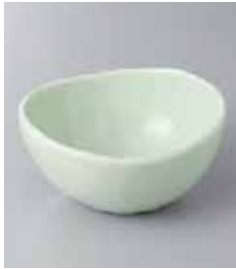
71-2-33G 810円 ミント丸型小鉢 12.5×11×6cm