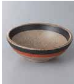
69-5-71G 1,020円 二色帯3.8小鉢 11.3×4cm