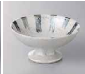
65-3-77G 900円 ゴスラスター十草高台小鉢 11.5×5.7cm